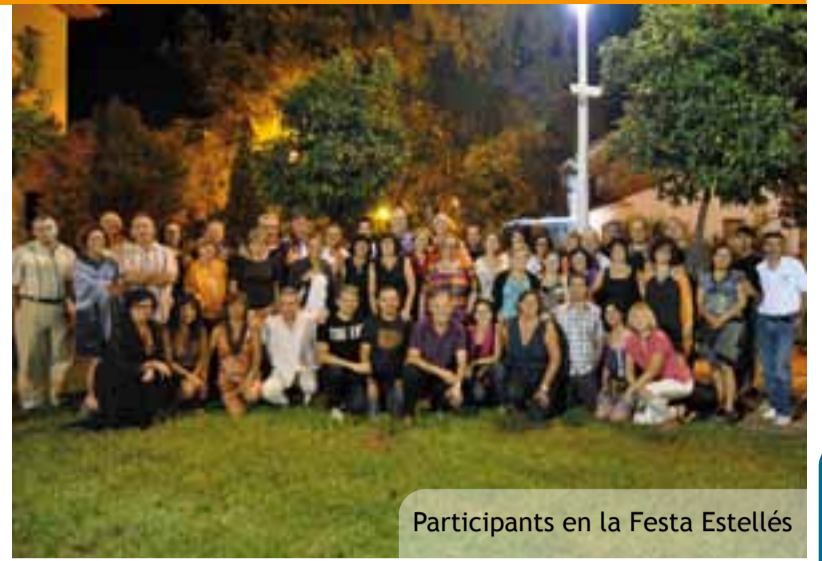
Participants en la Festa Estellés

Carmen Amoraga ganó en 1997 el premio Ateneo Joven por su novela Para que nada se pierda que también fue premio de la crítica valenciana. En 2007 fue finalista del premio Nadal por la obra Algo tan parecido al amor . En 2010 El tiempo mientras tanto la ha convertido en finalista del premio Planeta.