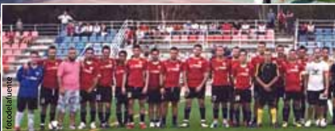
El CF Sebas l'Horta fue el primer equipo de Picanya en jugar en la nueva superficie el 19 de septiembre