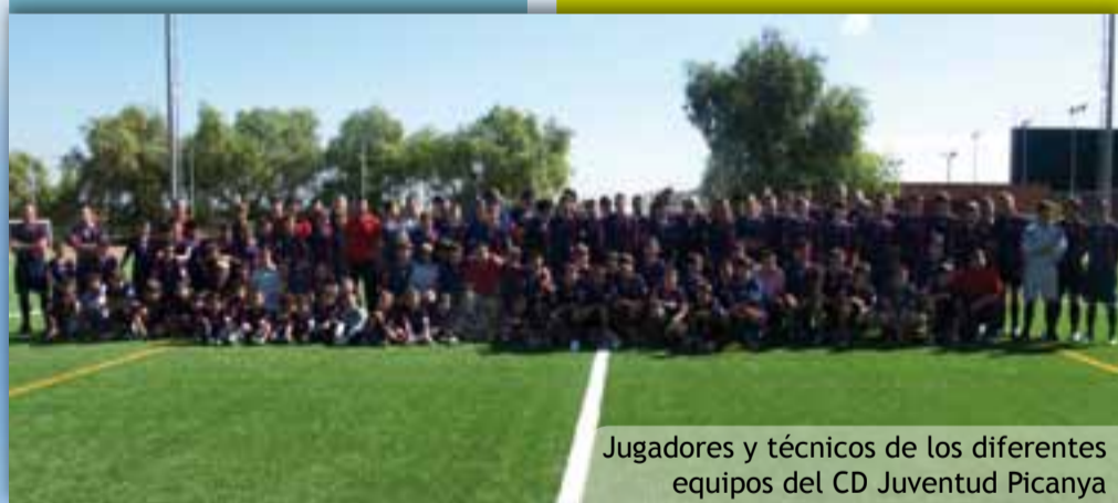
Jugadores y técnicos de los diferentes equipos del CD Juventud Picanya

Los nueve equipos con los que cuenta la entidad se presentaron entre música y los aplausos de la afición y se conjuraron para sacar el máximo partido a este nuevo césped sobre el que piensan ofrecer lo mejor de cada uno y llevar el fútbol picanyero a lo más alto posible. Entusiasmo y ganas, a tenor de lo visto, no les faltan y el trabajo, está garantizado.