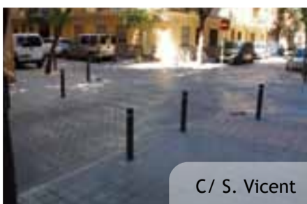
C/ S. Vicent

Ya están abiertos al tráfico los nuevos tramos de vías peatonales en las calles Sant Vicent, Sant Antoni y P. Sang. Unos espacios donde, aplicando los mismos criterios de anteriores actuaciones, se han mejorado aceras y se han elevado los cruces principales con el objetivo de mejorar el tránsito para los viandantes, libres ahora de las dificultades que plantean los bordillos a las personas con problemas de movilidad. Esta nueva intervención es un nuevo paso en la línea de conseguir vertebrar todo nuestro núcleo urbano con este tipo de itinerarios sin barreras, donde se da preferencia al peatón sobre el tráfico rodado, por lo que en los próximos meses se acometerán nuevas actuaciones.