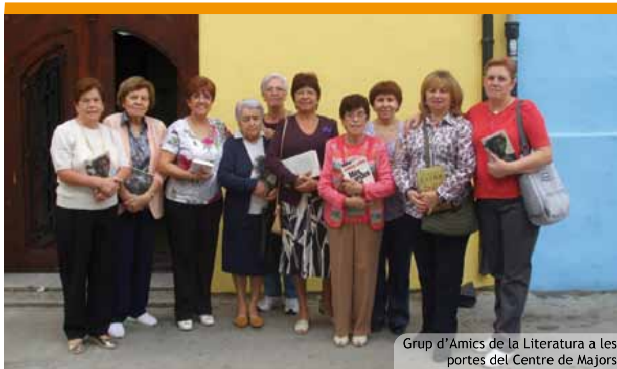
Grup d'Amics de la Literatura a les portes del Centre de Majors

Es gratis y cualquiera puede unirse. ¿Ya eres miembro? Entrar to contact Ajuntament de Picanya.