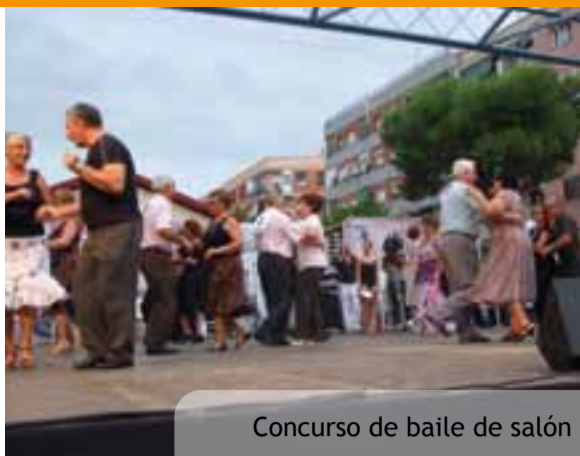
Concurso de baile de salón