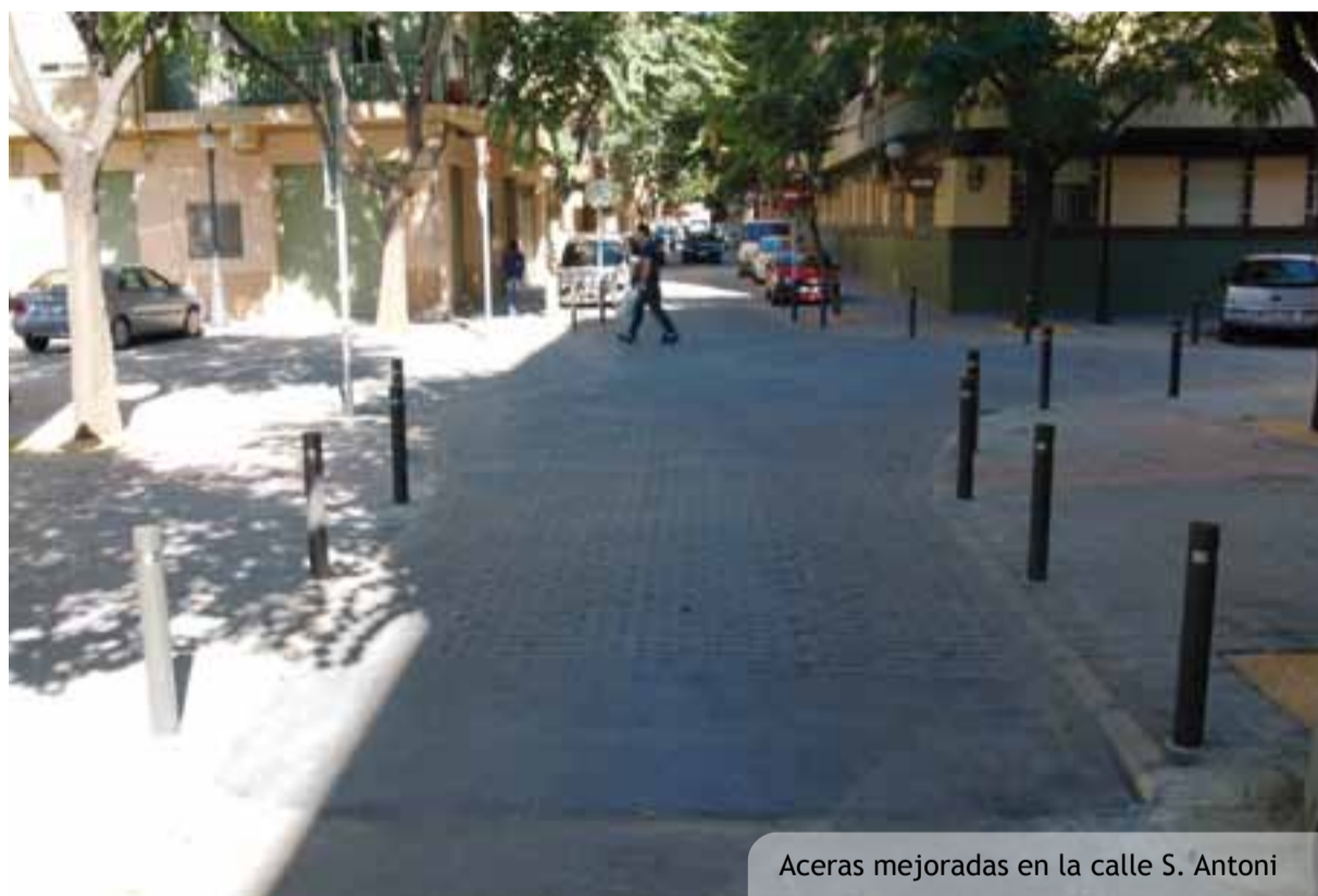
Aceras mejoradas en la calle S. Antoni

Una cuidada jardineria (amb reg per degoteig), mobiliari urbà i moderna il·luminació completen aquest nou espai polivalent que millora la dotació de l'escoleta en particular i també la del barri en general.