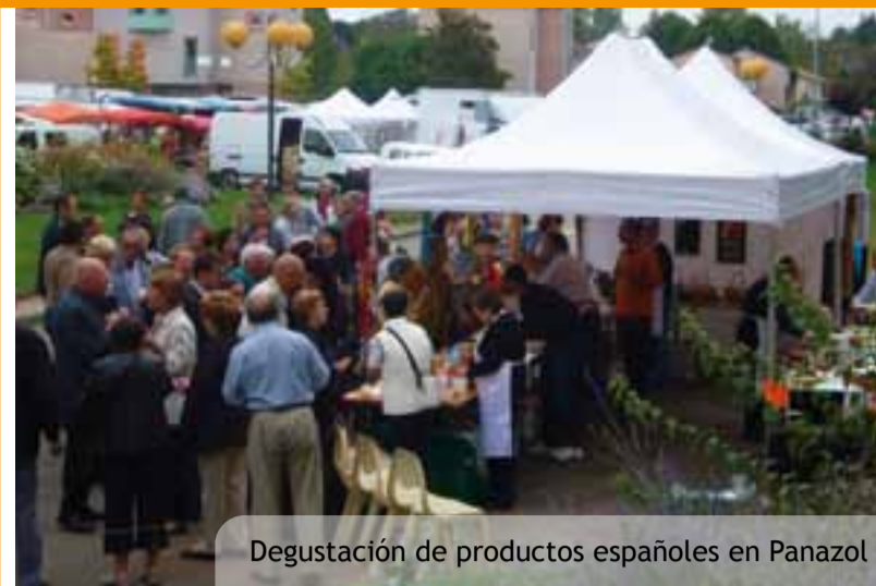
Degustación de productos españoles en Panazol

Els propietaris de gossos de razes potencialment perilloses han d'obtenir la llicència administrativa corresponent