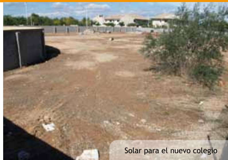
Solar para el nuevo colegio

de toda la parte hidráulica y el propio arquetón para garantizar un suministro de agua sin interrupciones (se ha instalado una doble canalización) y en las mejores condiciones de presión y caudal.