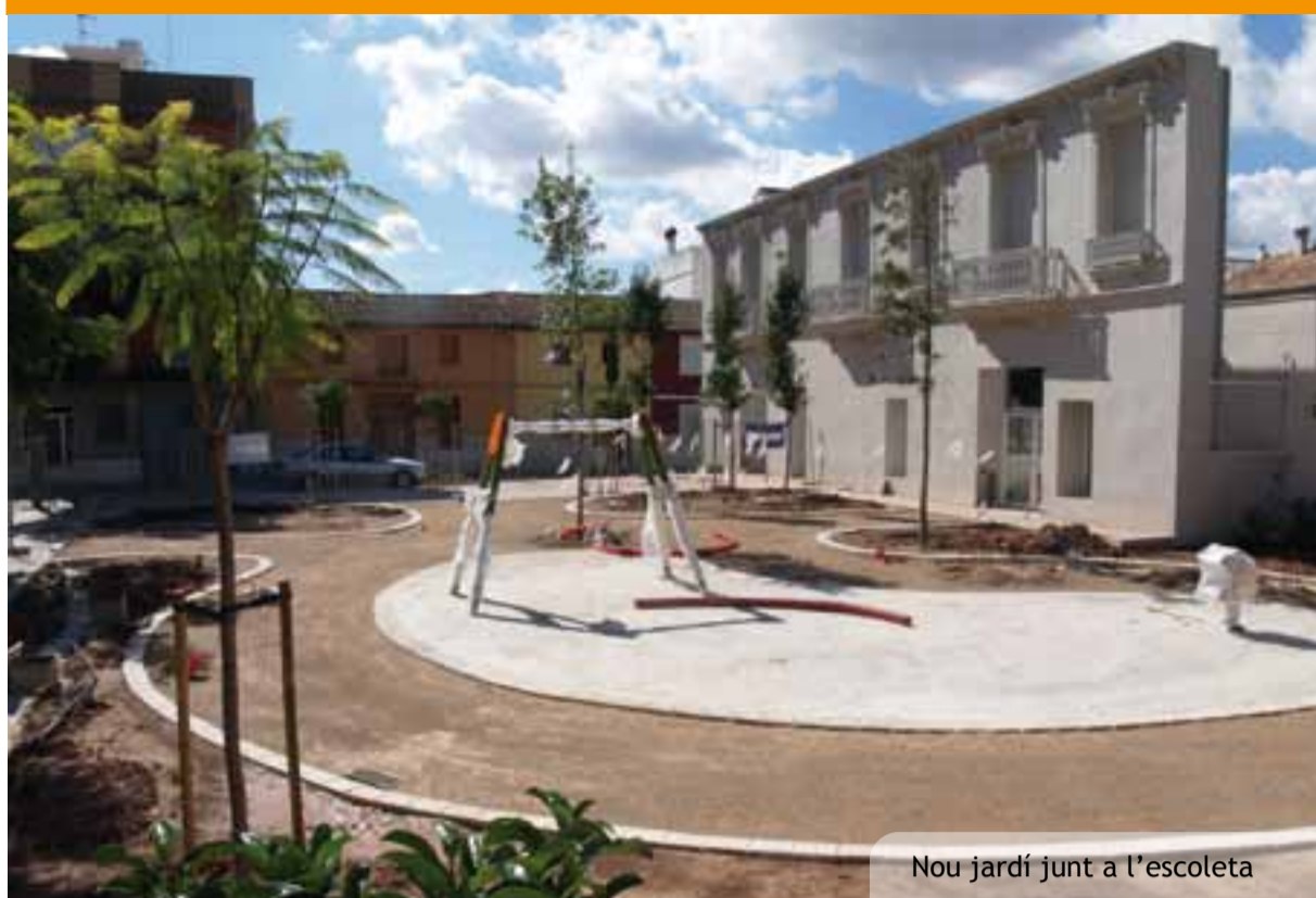
Nou jardí junt a l'escoleta