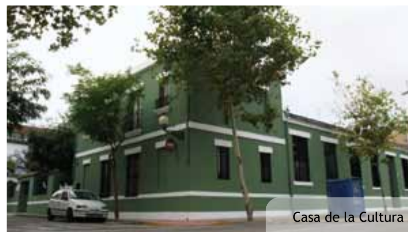
Casa de la Cultura