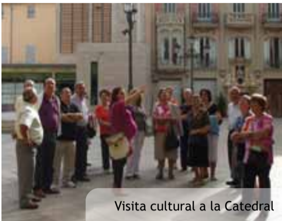
Visita cultural a la Catedral