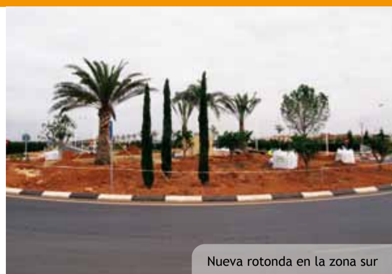
Nueva rotonda en la zona sur