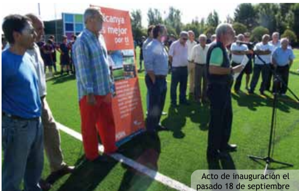
Acto de inauguración el pasado 18 de septiembre

El campo de fútbol del Polideportivo se renueva por completo con una nueva superficie de hierba artificial