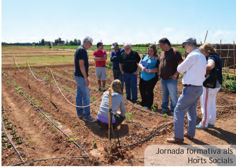
Jornada formativa als Horts Socials