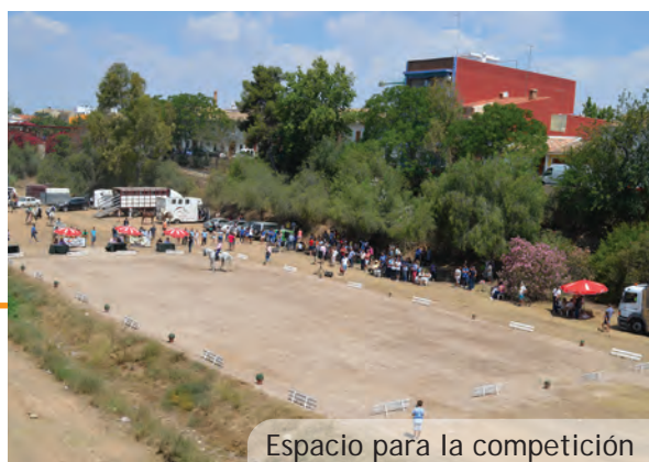
Espacio para la competición

la final de la competició provincial de Copa organitzada per la Federació de Bàsquet de la Comunitat Valenciana. Al tancament d'esta edició encara no sabem el resultat final però arribar fins a estar en una final ja és un gran èxit.