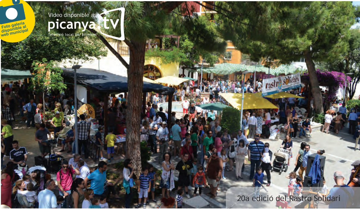
20a edició del Rastro Solidari

Video disponible a picanya.tv Televisió local per Internet