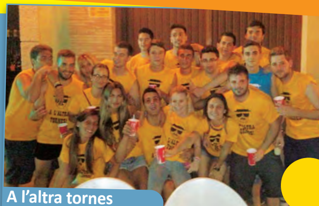
A l'altra tornes

El nom de VA O ME GITE representa a un grup d'amics i amigues que decidírem viure les festes de Picanya d'una forma més activa i participativa. El nostre objectiu sempre ha sigut fer dela festa del poble un dels moments més importants per a reunir-se i gaudir tots junts i al costat de les altres penyes. Esta és la nostra identitat.