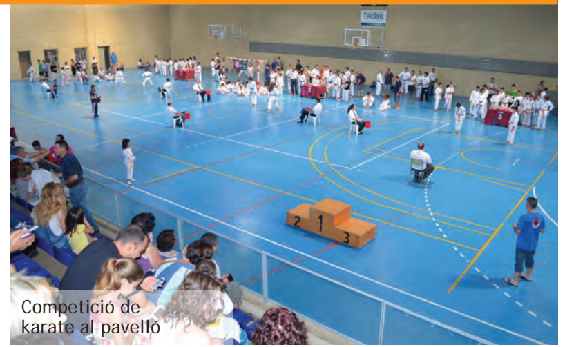
Competició de karate al pavelló