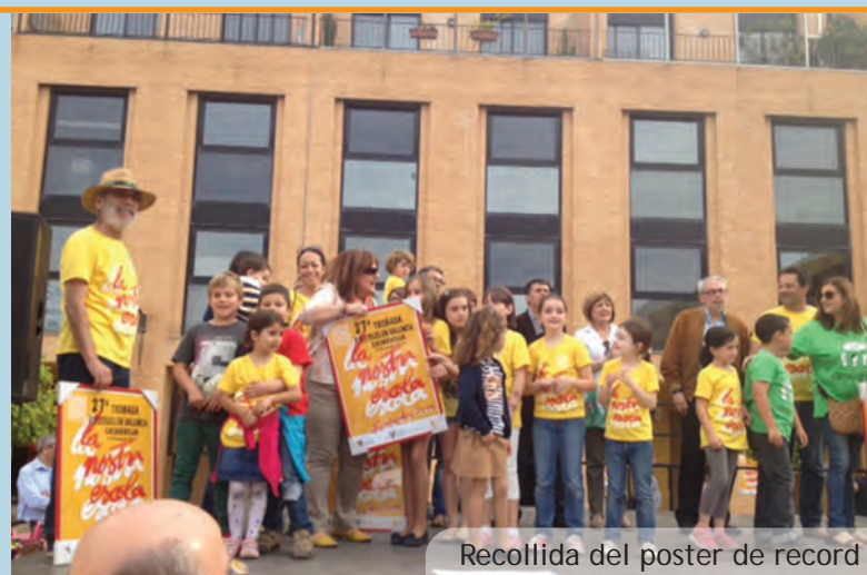
Recollida del poster de record

Con los alumnos y alumnas de sexto curso la Policía Local realiza una excursión en bicicleta por la población de Picanya, participando del tráfico real de la población, descubriendo los lugares seguros para los desplazamientos en bicicleta donde se ponen en práctica lo aprendido en los cursos anteriores. Las salidas fueron el 8 de mayo para el alumnado del colegio Ausiàs March y el 10 de junio para los del colegio Baladre.