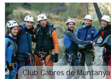
Club Cabres de Muntanya