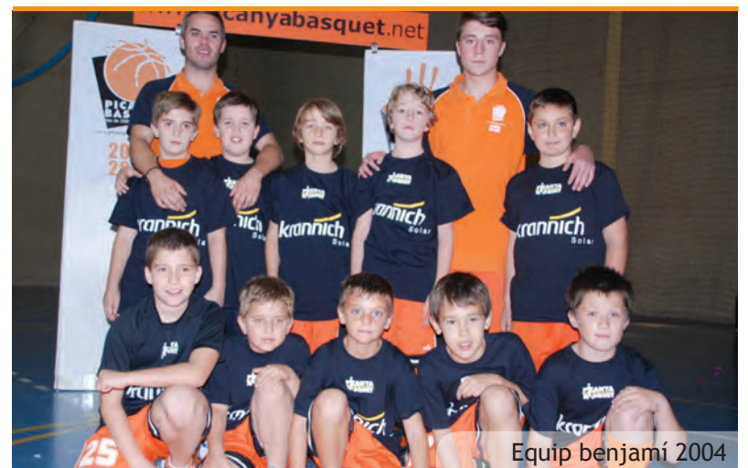
Equip benjamí 2004

Los alevines del CD Juventud Picanya disputaron en el mes de abril un torneo de futbol base en la Manga del Mar Menor (Murcia). Por otra parte 34 miembros de la Peña Ciclista Tarazona pedalearon hasta la catedral de Cuenca (215 km) en un divertido viaje que les anima a nuevos desafíos. Y en el lado más "extremo" de la afición de los deportistas picanyeros a viajar encontramos al club de espeleología y barranquismo Cabres de Muntanya que entre el 2 y el 14 de septiembre han decidido recorrer los barrancos más exigentes de los Alpes suizos. ¡Está claro que el deporte picanyero no tiene límites!