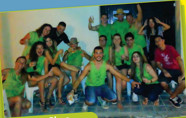
La mosca Ghao

Somos una peña de amigos jóvenes. Éste es nuestro segundo año. Somos divertidos, alegres, chacharacheros y lo más importante buenas personas y con un corazón enorme que nos gusta la fiesta y el buen rollito, estamos muy unidos todos los componentes de la peña y muy contentos y orgullosos de disfrutar de las fiestas de Picanya como se merecen: cada año más y mejor xD!!