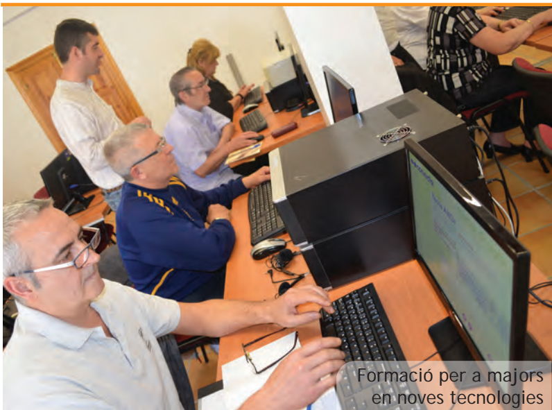
Formació per a majors en noves tecnologies

Els nous hortelans van aprendre aspectes com l'ús dels insectes per a controlar plagues, els moments adequats per a cada plantació, l'ús d'insecticides, el reg, la poda... en una jornada molt didàctica i completa.