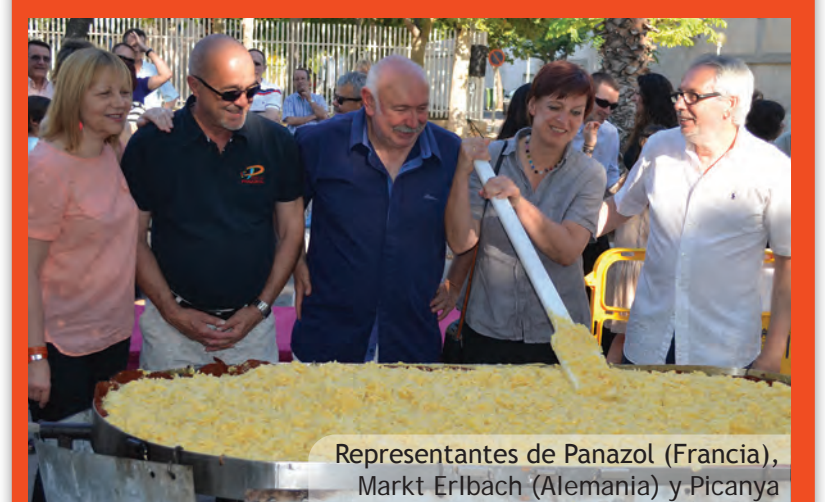
Representantes de Panazol (Francia), Markt Erlbach (Alemania) y Picanya