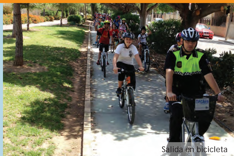
Salida en bicicleta

Para apreciar la otra mejora destacable hay que mojarse, concretamente hay que entrar en la piscina infantil donde se ha reducido la profundidad y se ha sustituido el alicatado interior. El objetivo de la intervención, realizada con recursos municipales, ha sido mejorar la seguridad.