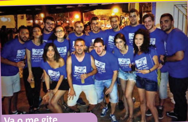
Va o me gite

Fa 5 anys que un grup de bons amics, vam decidir constituir una penya per a poder gaudir de les festes del poble, no sols com a picaners, també com a família. Dinars, sopars, nits de música, de rialles i també de debats, són el resum de les vivències compartides. La nostra caravana, encara que ja no està, és senya de la nostra identitat. PER TOTS ELS QUE VAN SER. PER TOTS ELS QUE SOM.