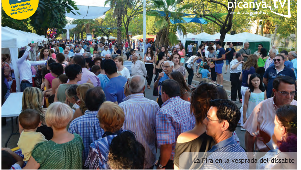
La Fira en la vesprada del dissabte

Està prevista l'organització tres tallers més que tractaran sobre iniciació al món de les xarxes socials, primers passos en fotografia digital i ús de telèfons intel·ligents (smarphones).