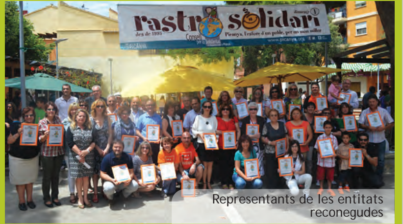
Representants de les entitats reconegudes