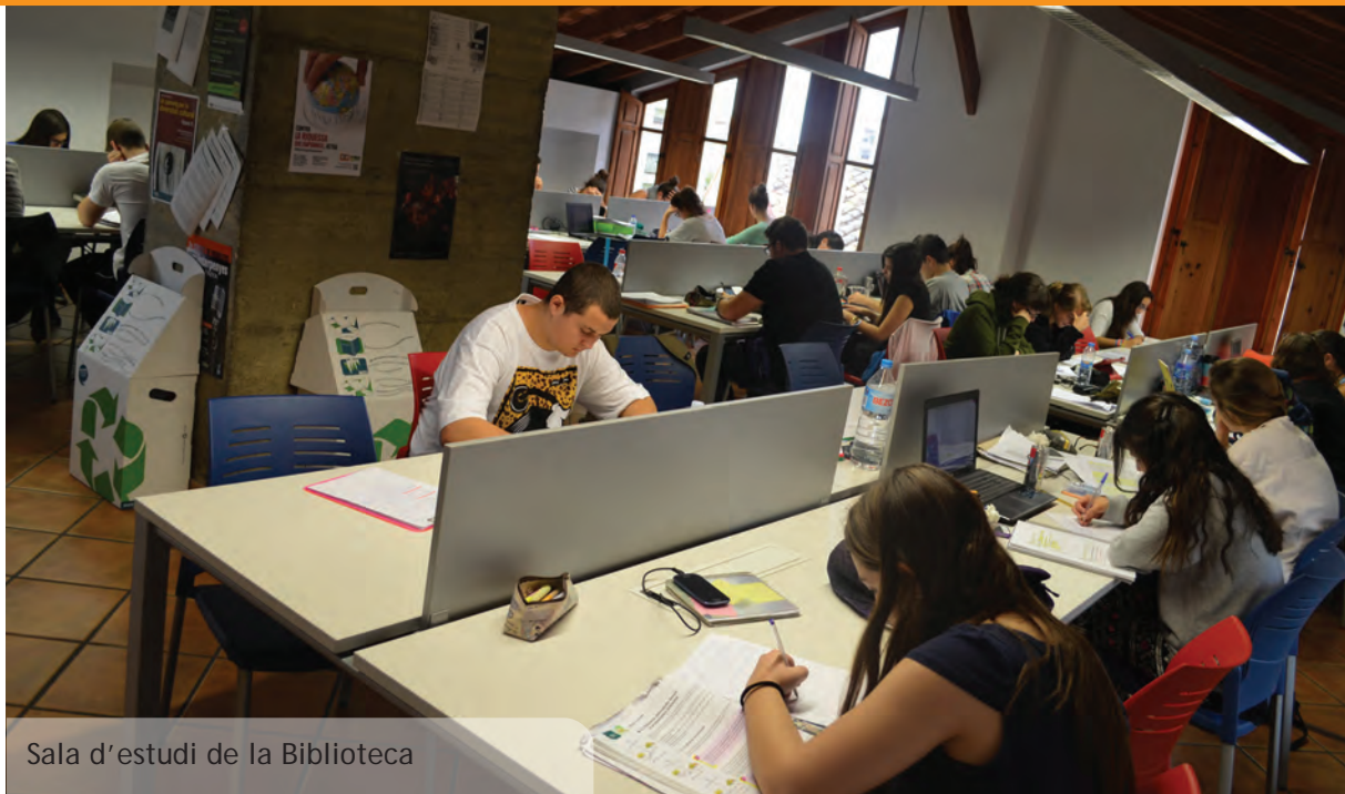
Sala d'estudi de la Biblioteca

El període de durada de les beques comença el 1 de juliol del 2014 i finalitzarà com a màxim el 31 d'Agost de 2014 i per tant, permet als joves estudiants aprofitar el període de les vacances d'estiu per a conèixer de primera mà un entorn de treball professional en àmbits tan variats com ara la informàtica, l'urbanisme, l'atenció al públic, el treball amb menuts, la comunicació pública... i, per tant adquirir una experiència laboral amb la que millorar el seu currículum.