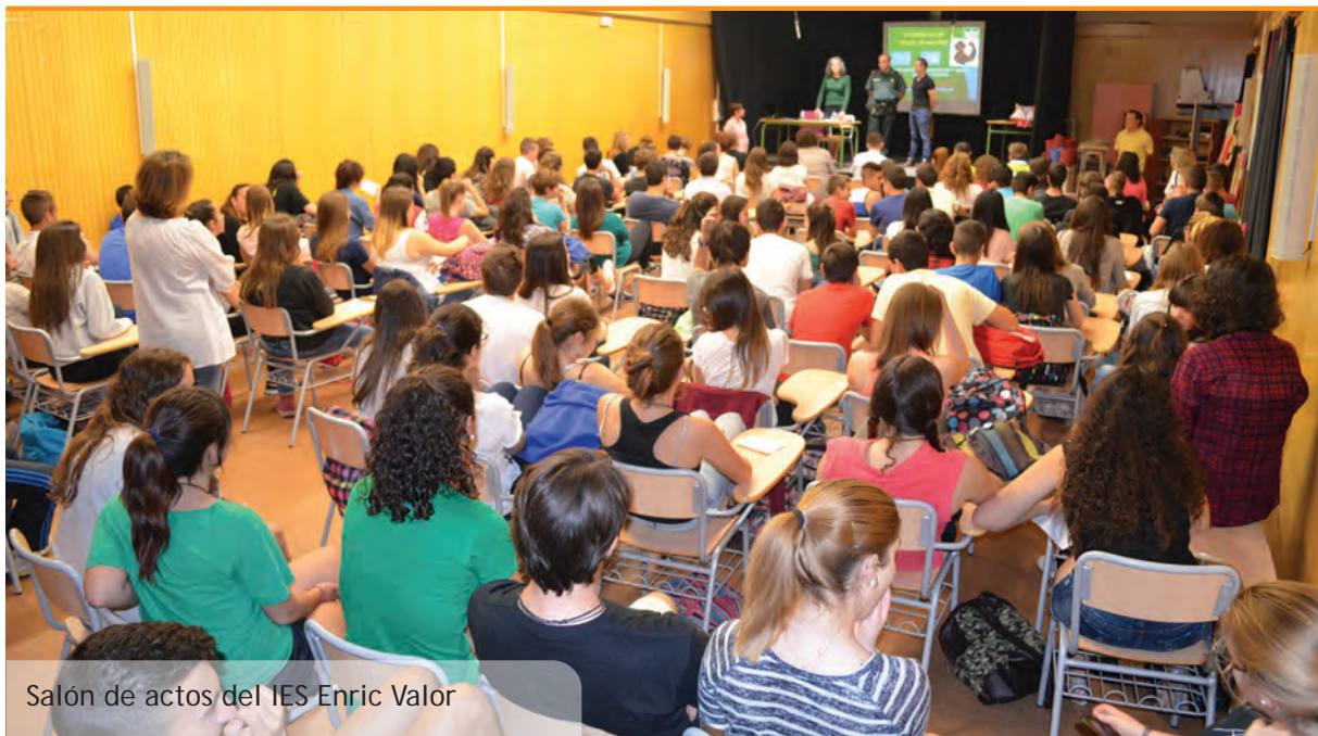
Salón de actos del IES Enric Valor

La jornada es va desenvolupar amb total normalitat i les 12 meses situades als col·legis Ausiàs March i CP Baladre van obrir a les 9.00h i es van tancar a les 20.00h després d'onze hores de votació sense cap incident. La participació al nostre poble va arribar al 55'91% clarament superior a la mitjana nacional (45'84%) i molt propera a l'autonòmica (50'04%).