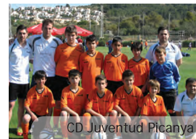
CD Juventud Picanya