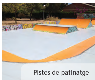
Pistes de patinatge

Tant en la pista de patinatge com en les pistes de bàsquet s'ha comptat amb l'opinió i col·laboració dels usuaris més habituals d'estes instal·lacions. De fet, en el cas de la pista de bàsquet el club Picanya Bàsquet