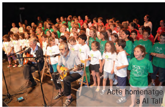
Acte homenatge a Al Tall