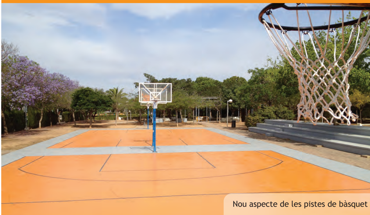
Nou aspecte de les pistes de bàsquet