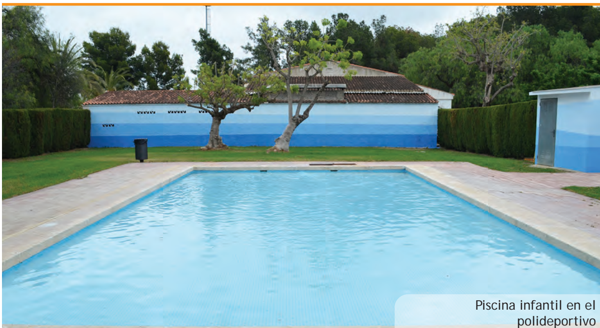
Piscina infantil en el polideportivo

va decidir les noves mesures de la pista (ara més ampla) i les noves línies, amb zones quadrades i la línia de tres a 6'75 com marca la nova normativa d'este esport. Este club, a més, ha aportat les noves anelles i les noves xarxes raó per la qual se'ls ha permès incorporar el seu logo a les pistes com a element decoratiu i de promoció d'este esport, tal com ja s'ha fet en altres instal·lacions municipals amb altres entitats.