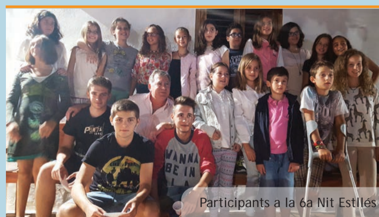
Participants a la 6a Nit Estellés