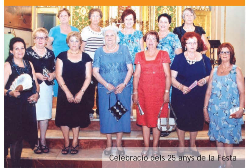
Celebració dels 25 anys de la Festa