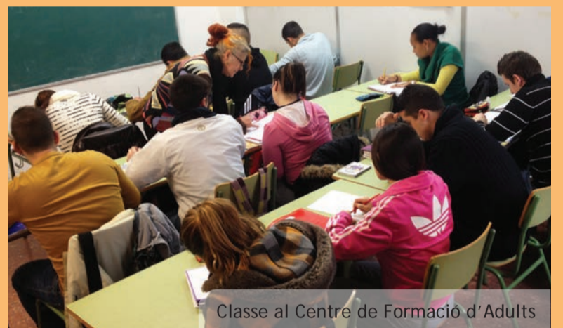
Classe al Centre de Formació d'Adults