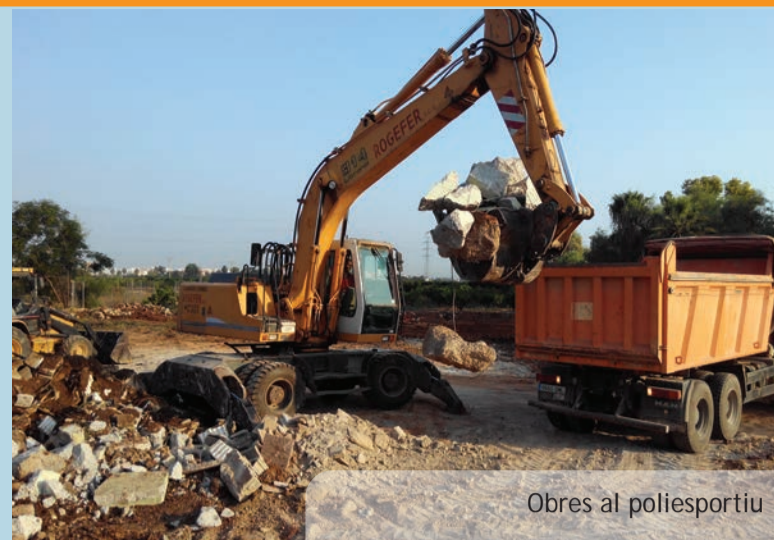
Obres al poliesportiu

A diferents indrets del nostre poble s'ha procedit a la renovació (allà on era necessari) i ampliació del mobiliari urbà. En els dos casos s'ha optat per un mobiliari d'acabat en fusta per aconseguir la màxima harmonia amb el nostre entorn urbà.