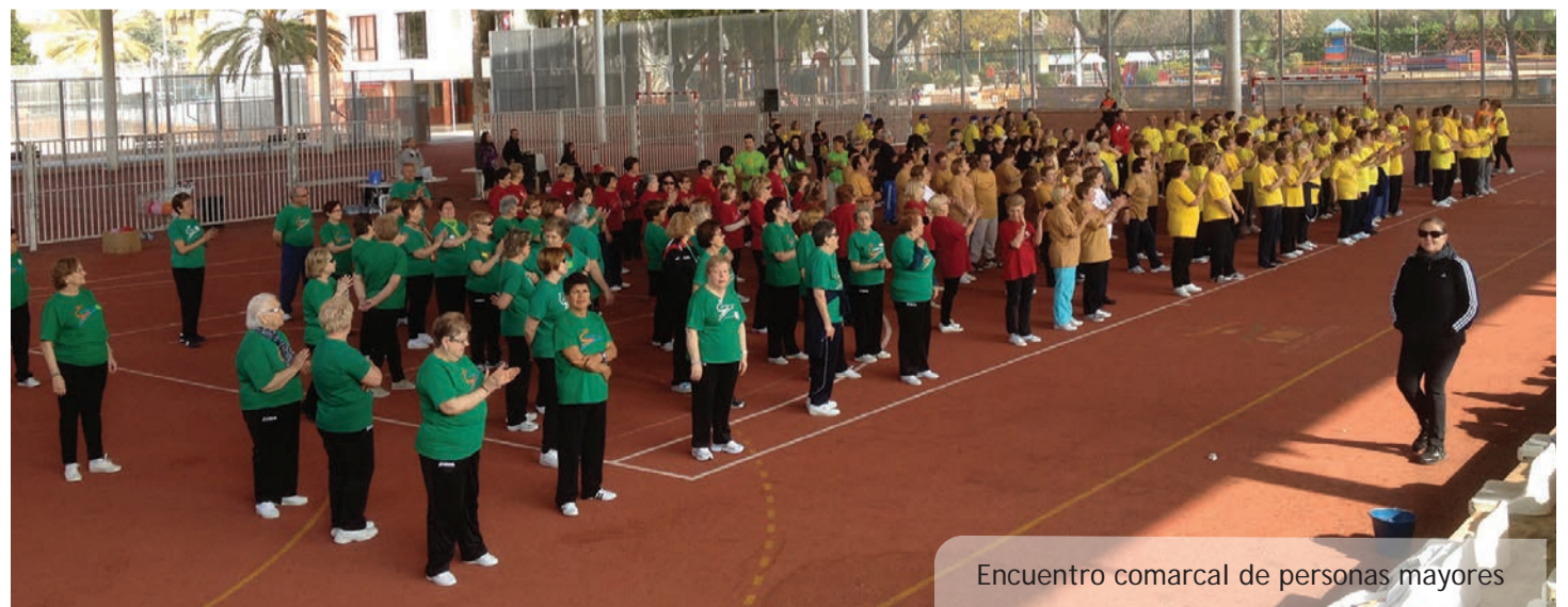
Encuentro comarcal de personas mayores

Ara, 25 anys després, s'han tornat a reunir per a celebrar-ho.