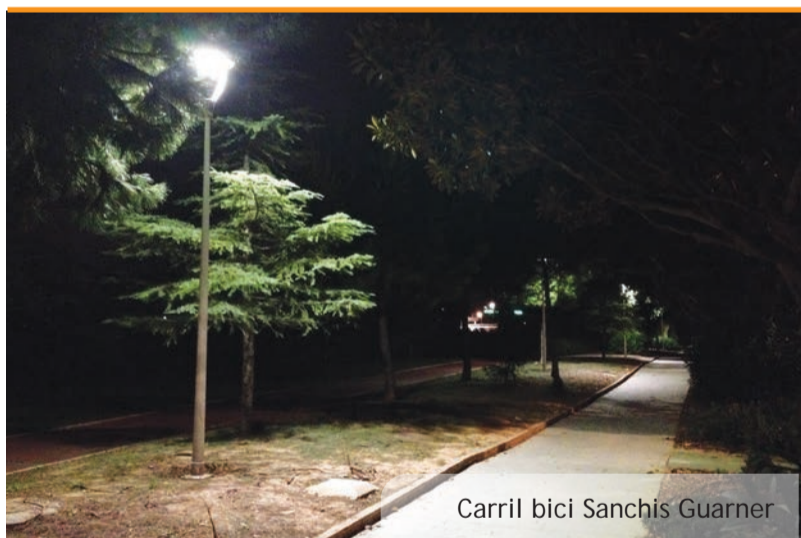
Carril bici Sanchis Guarner