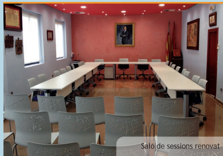
Saló de sessions renovat

Ja s'ha completat la primera fase d'un nou conjunt d'actuacions per a la millora del Poliesportiu Municipal. En concret s'està treballant sobre la zona de la piscina infantil i el parc adjacent. La intenció és renovar per complet tota esta part de la instal·lació que ja havia quedat antiga i que puga esdevindre una veritable opció d'oci i diversió especialment adreçada a les famílies que habitualment visiten el poliesportiu i fan ús d'estes instal·lacions.