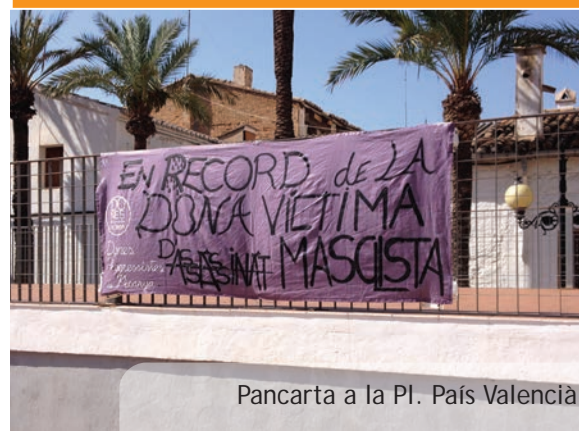
Pancarta a la Pl. País Valencià