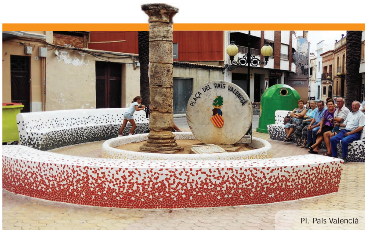
Pl. País Valencià