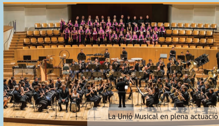
La Unió Musical en plena actuació