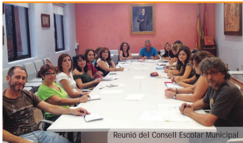
Reunió del Consell Escolar Municipal

Visto lo anterior lo que debemos hacer es (importante) conservar los justificantes de compra originales y esperar al desarrollo de la normativa. El Ayuntamiento de Picanya y los centros educativos informarán puntualmente del proceso a seguir una vez éste queda fijado por parte de la Conselleria de Educación.