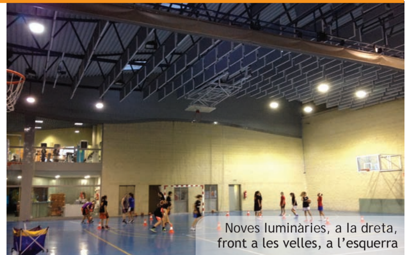
Noves luminàries, a la dreta, front a les velles, a l'esquerra

El grup E està destinat a persones amb major necessitat de gimnàstica adaptada