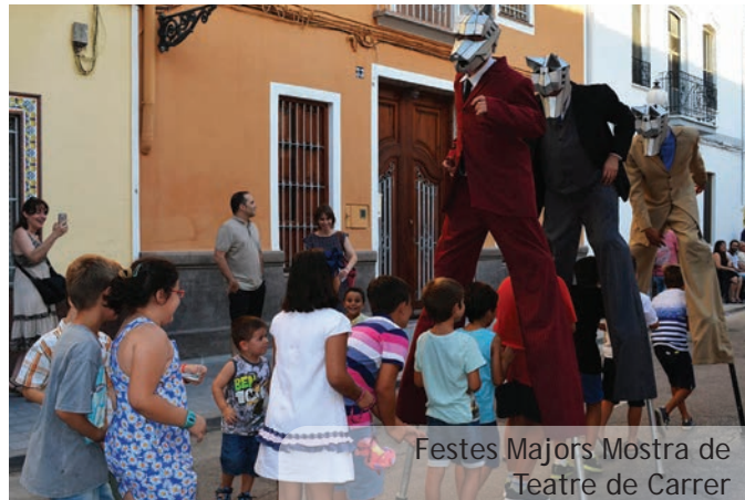
Festes Majors Mostra de Teatre de Carrer