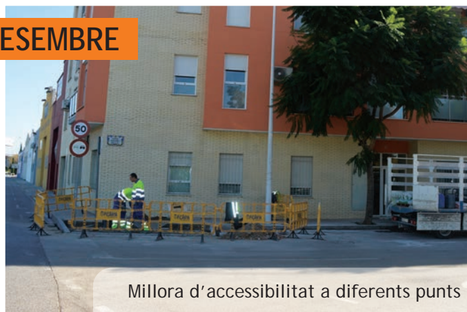
Millora d'accessibilitat a diferents punts