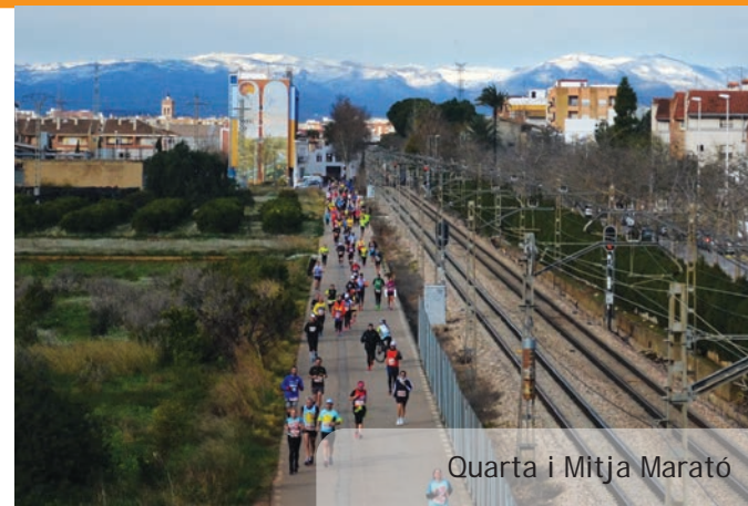
Quarta i Mitja Marató