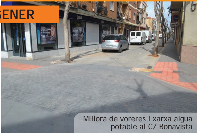
Millora de voreres i xarxa aigua potable al C/ Bonavista