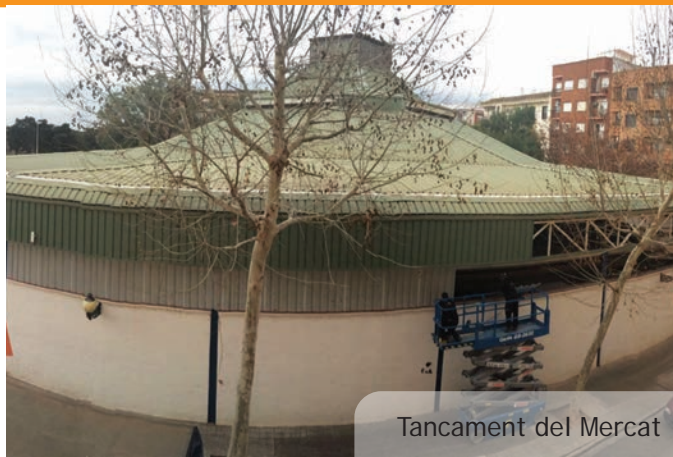
Tancament del Mercat