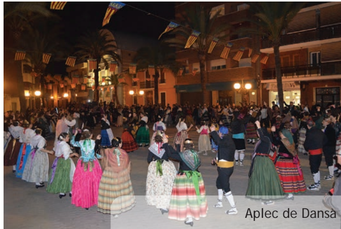
Aplec de Dansa