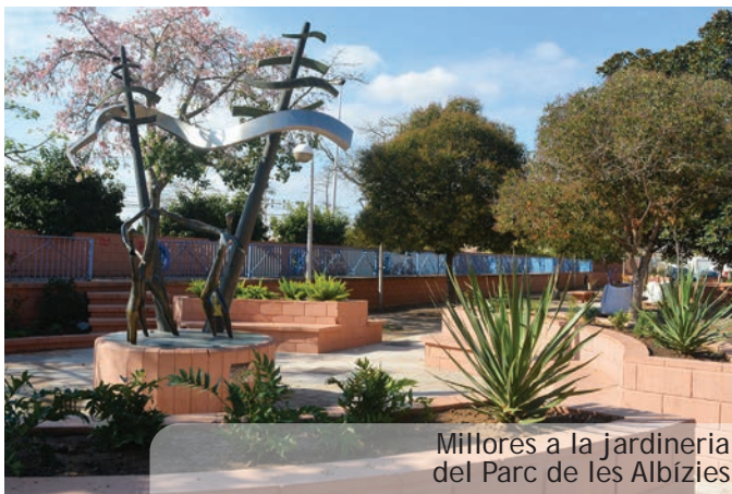
Millores a la jardineria del Parc de les Albízie