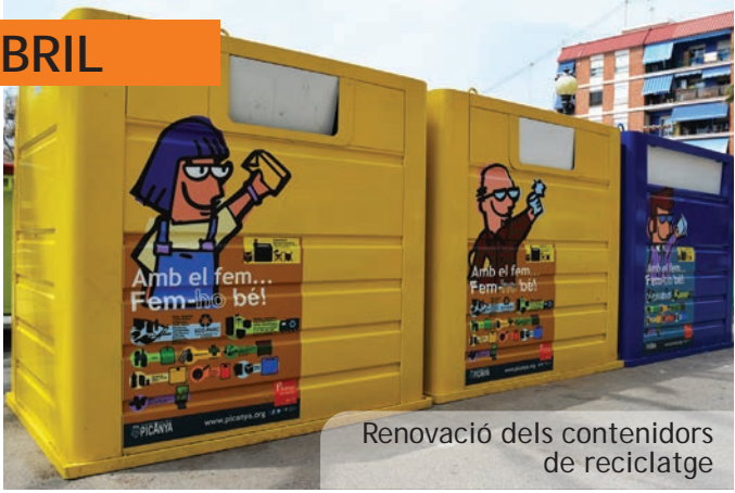
Renovació dels contenidors de reciclatge