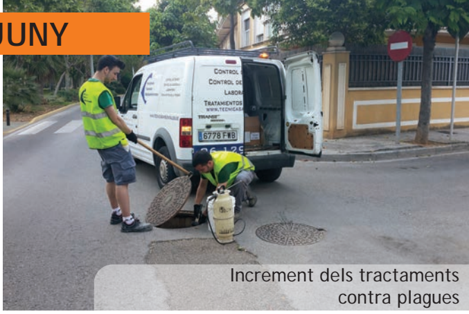
Increment dels tractaments contra plagues