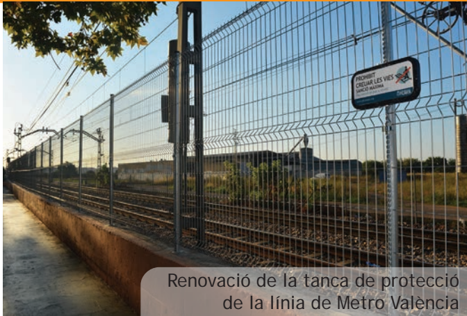
Renovació de la tanca de protecció de la línia de Metro València