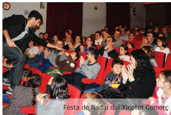
Festa de Nadal del Xicotet Comerç