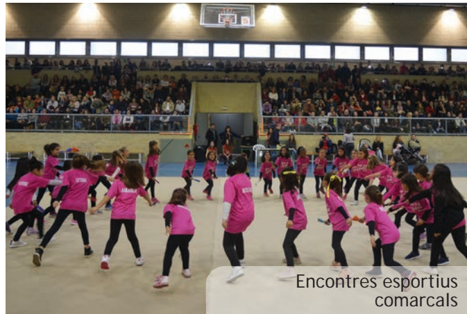
Encontres esportius comarcals