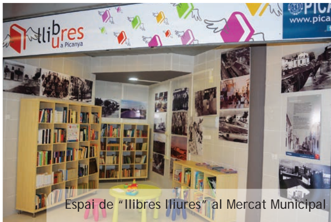
Espai de "llibres lliures" al Mercat Municipal