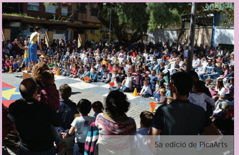
5a edició de PicaArts