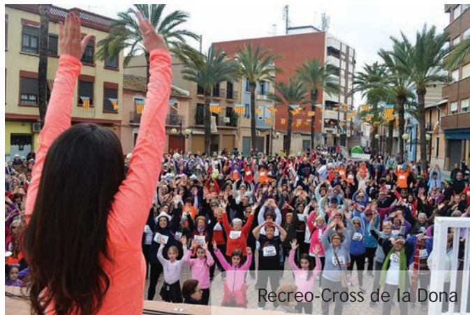
Recreo-Cross de la Dona