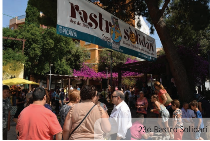
23é Rastro Solidari