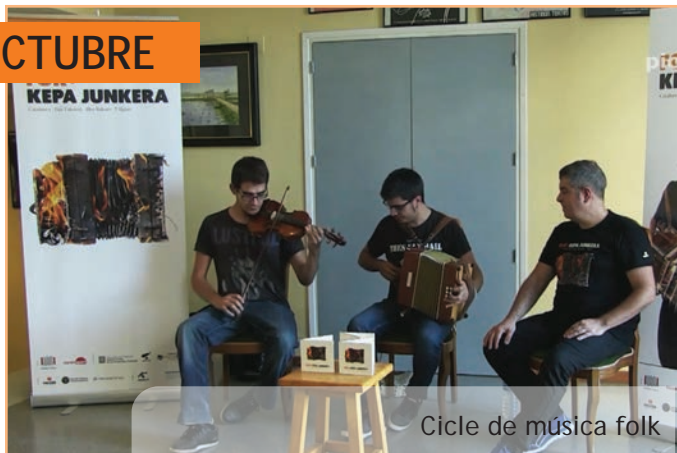
Cicle de música folk