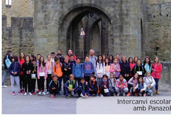
Intercanvi escolar amb Panazol