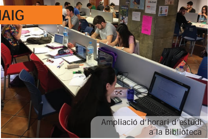
Ampliació d'horari d'estudi a la Biblioteca