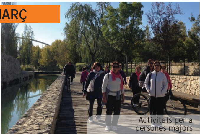
Activitats per a persones majors