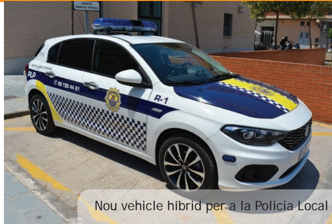
Nou vehicle híbrid per a la Policia Local