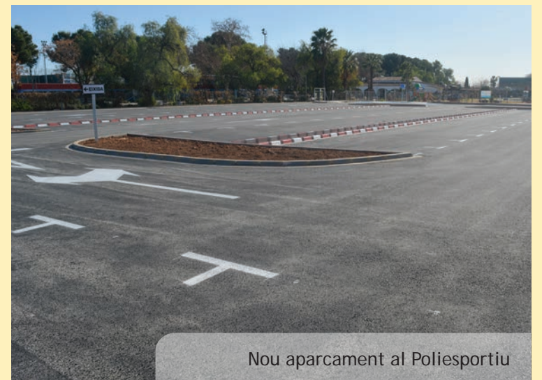
Nou aparcament al Poliesportiu

R. Efectivament estava previst intervenir la plaça una volta finalitzades les altres obres que he esmentat adés. Esta inicial reforma de la plaça estava previst que fóra finançada pels fons d'un projecte d'intervenció en el nucli urbà que depenia del govern de la Generalitat de fa uns anys. Malauradament, com tantes coses d'aquella època, el projecte caigué en l'oblit i els fons mai arribaren així que hem tingut que buscar altres opcions de finançament de les obres.