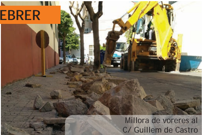
Millora de voreres al C/ Guillem de Castro