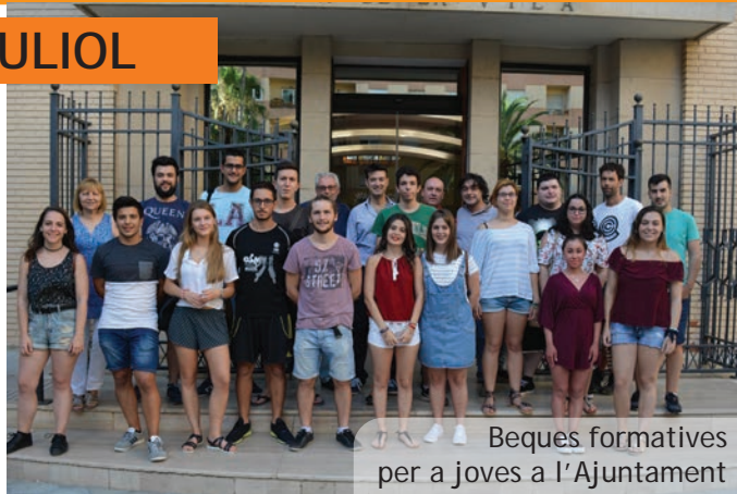
Beques formatives per a joves a l'Ajuntament