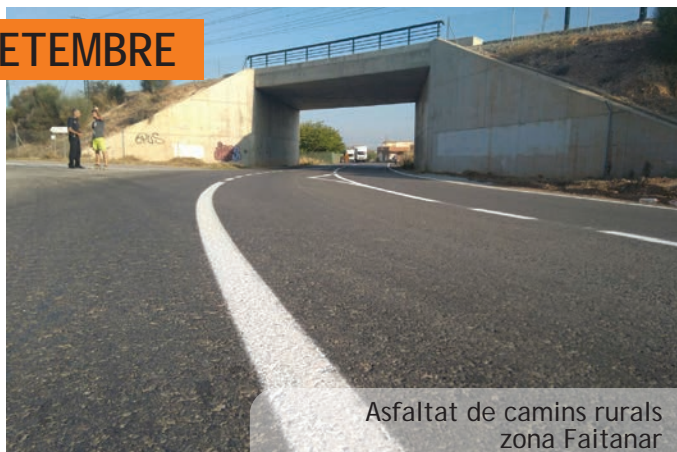
Asfaltat de camins rurals zona Faitanar