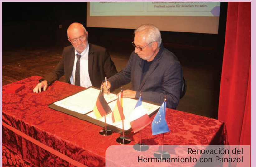
Renovación del Hermanamiento con Panazol