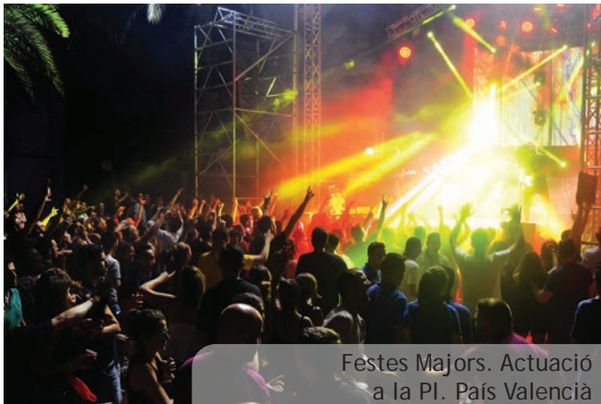
Festes Majors. Actuació a la Pl. País Valencià