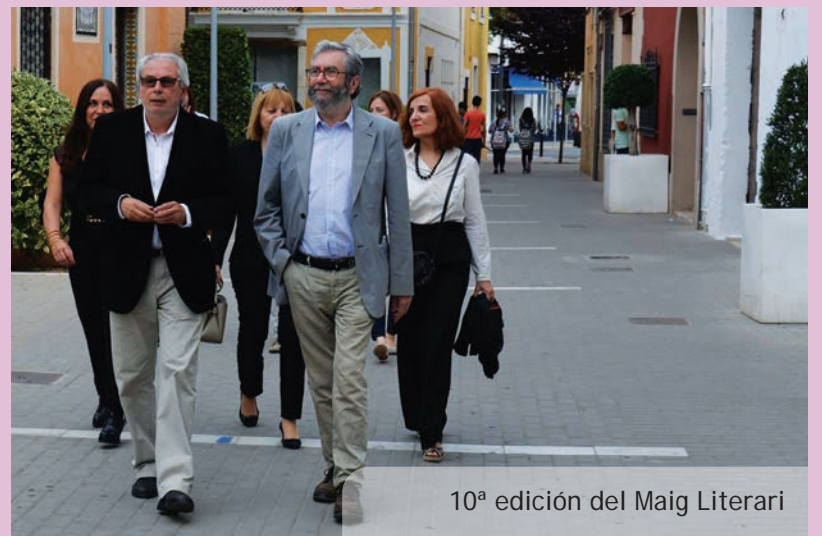
10ª edición del Maig Literari