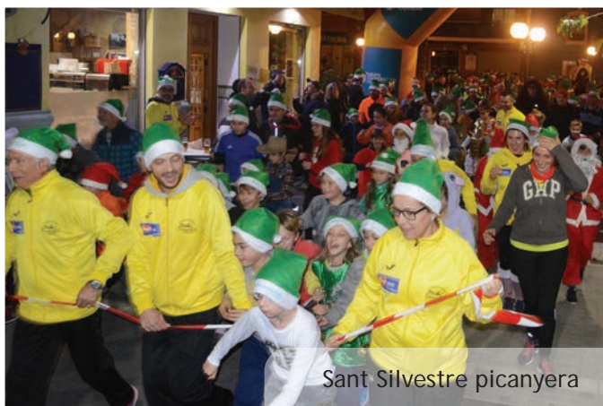
Sant Silvestre picanyera