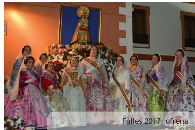
Falles 2017, ofrena