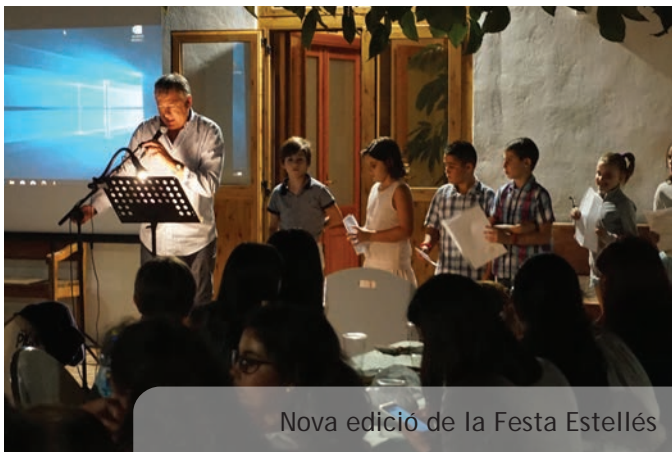
Nova edició de la Festa Estellés