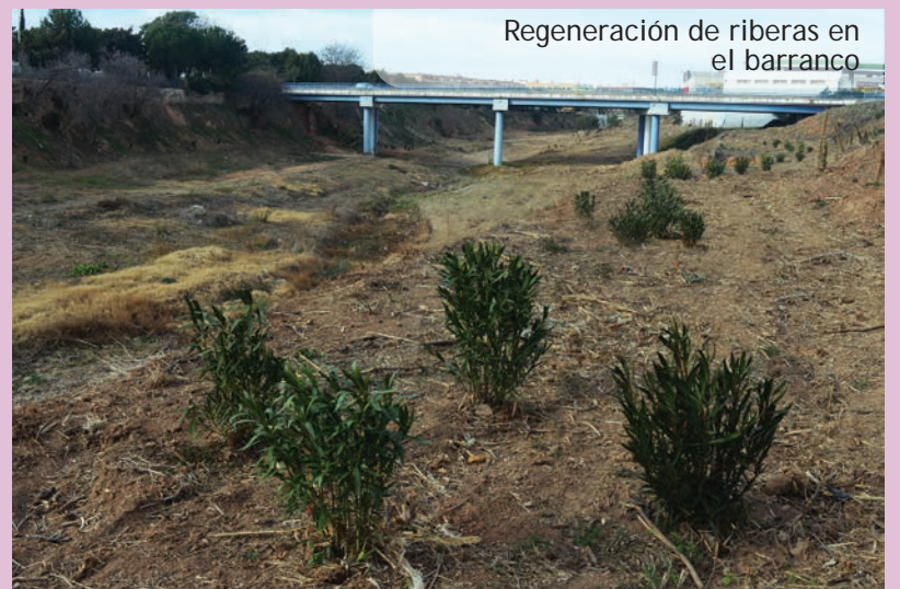
Regeneración de riberas en el barranco