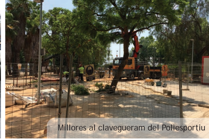
Millores al clavegueram del Poliesportiu