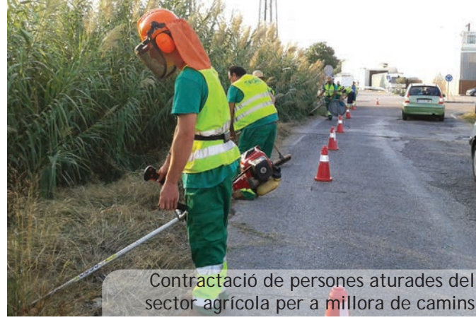
Contractació de persones aturades del sector agrícola per a millora de camins