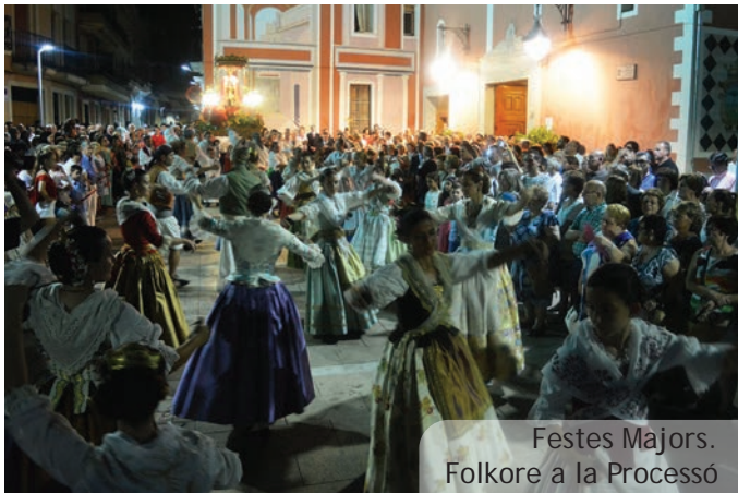
Festes Majors. Folklore a la Processó