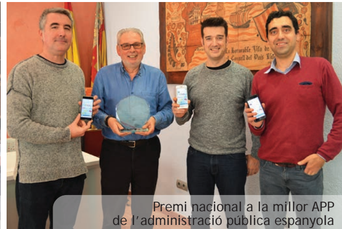
Premi nacional a la millor APP de l'administració pública espanyola