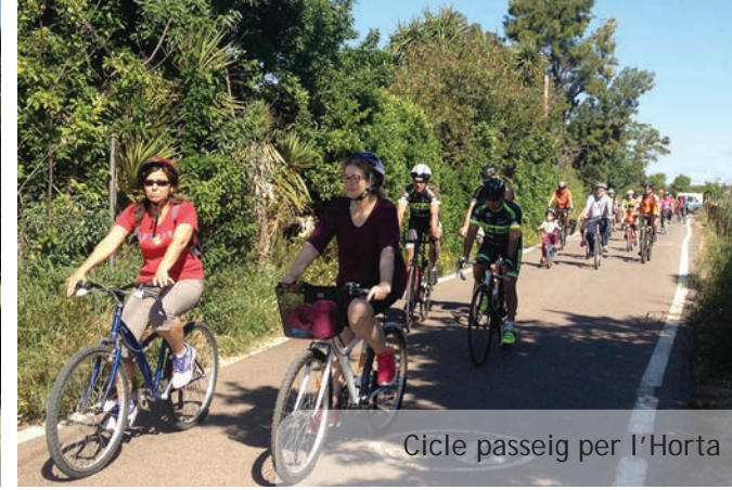
Cicle passeig per l'Horta