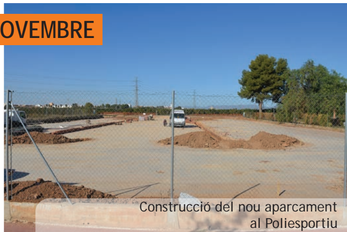
Construcció del nou aparcament al Poliesportiu