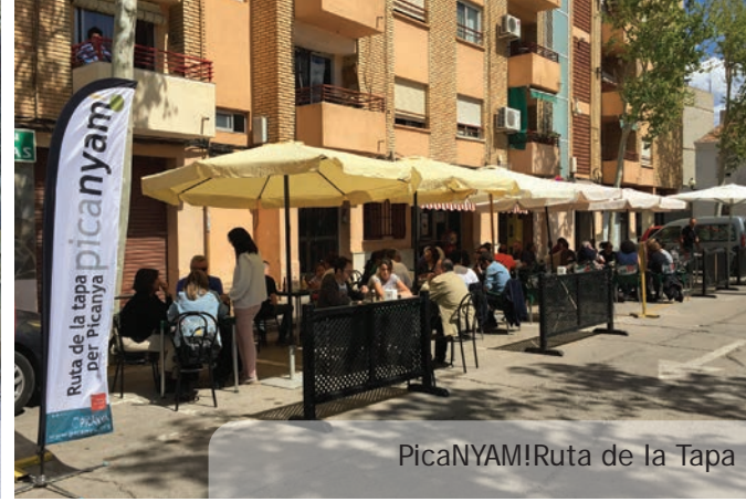
PicanYAM! Ruta de la Tapa