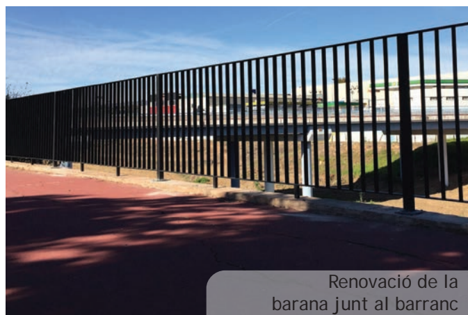
Renovació de la barana junt al barranc