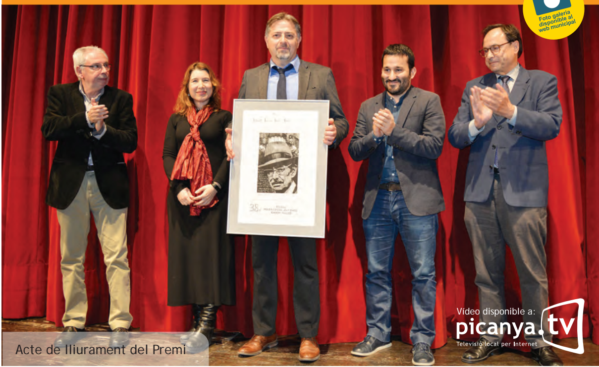
Acte de lliurament del Premi

Vídeo disponible a: picanya.tv Televisió local per Internet