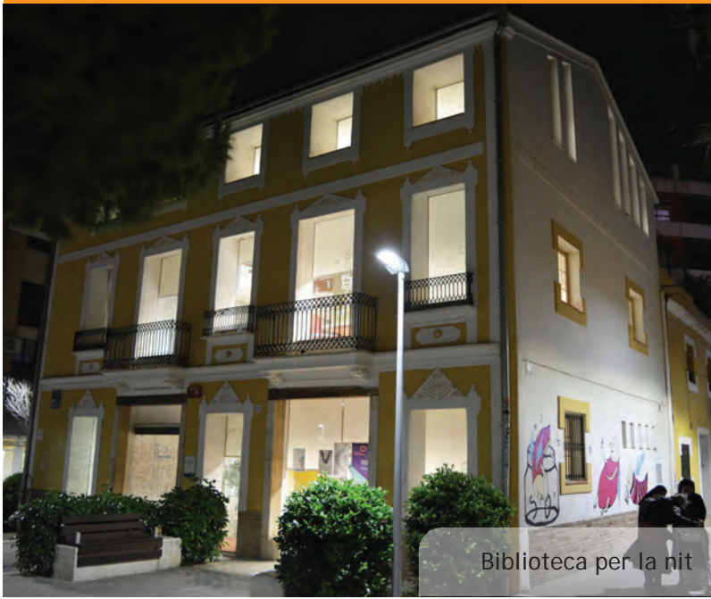
Biblioteca per la nit