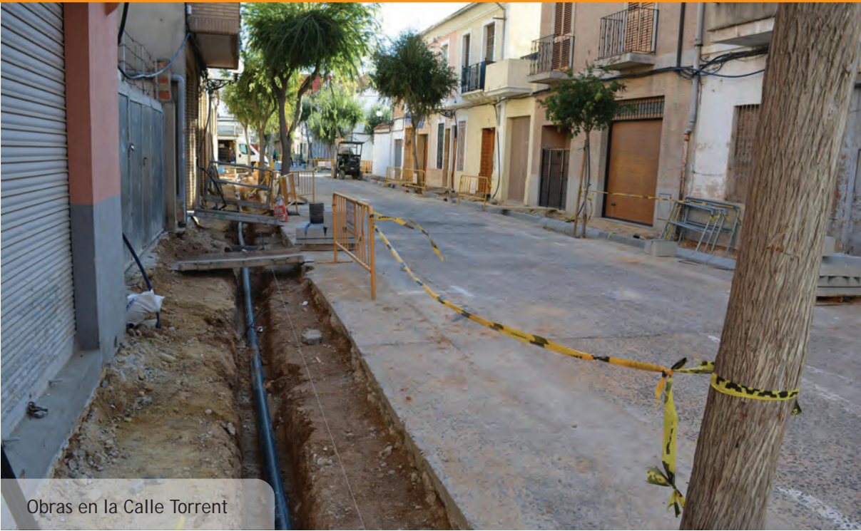
Obras en la Calle Torrent