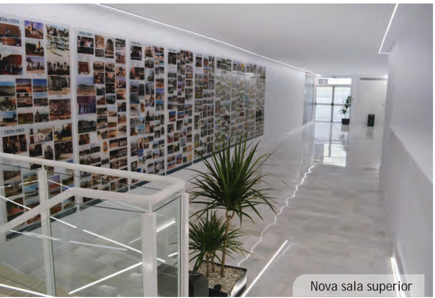
Nova sala superior

S'ha creat una sala superior, millorat l'accessibilitat amb la instal·lació d'un ascensor i s'han construït un lavabo i un nou magatzem