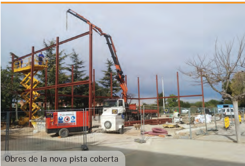
Obres de la nova pista coberta

Los dos puntos son del tipo semirápido con una potencia de 22 kilovatios.