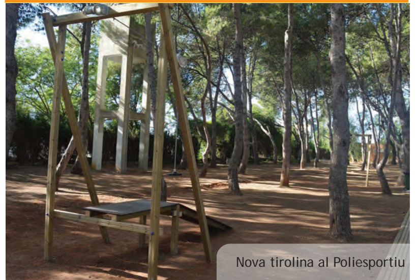
Nova tirolina al Poliesportiu

Està en construcció un nou tram de carril bici i per a vianants. En concret s'està fent un tram que permetrà connectar el traçat ja existent a la zona de la séquia de Faitanar (finalitzat este estiu passat) amb el terme municipal de Xirivella tot i enllaçant amb la zona de naus industrials situades en este punt en passar el pont de l'AVE. Estes obres compten amb els finançament de l'IVACE.