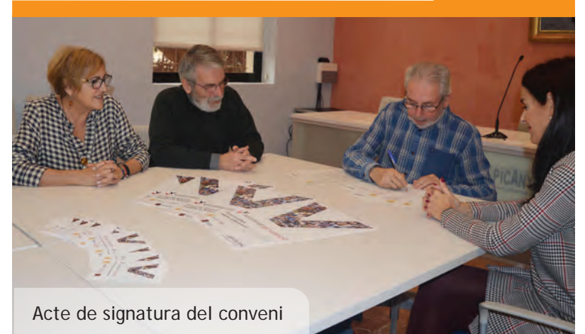
Acte de signatura del conveni