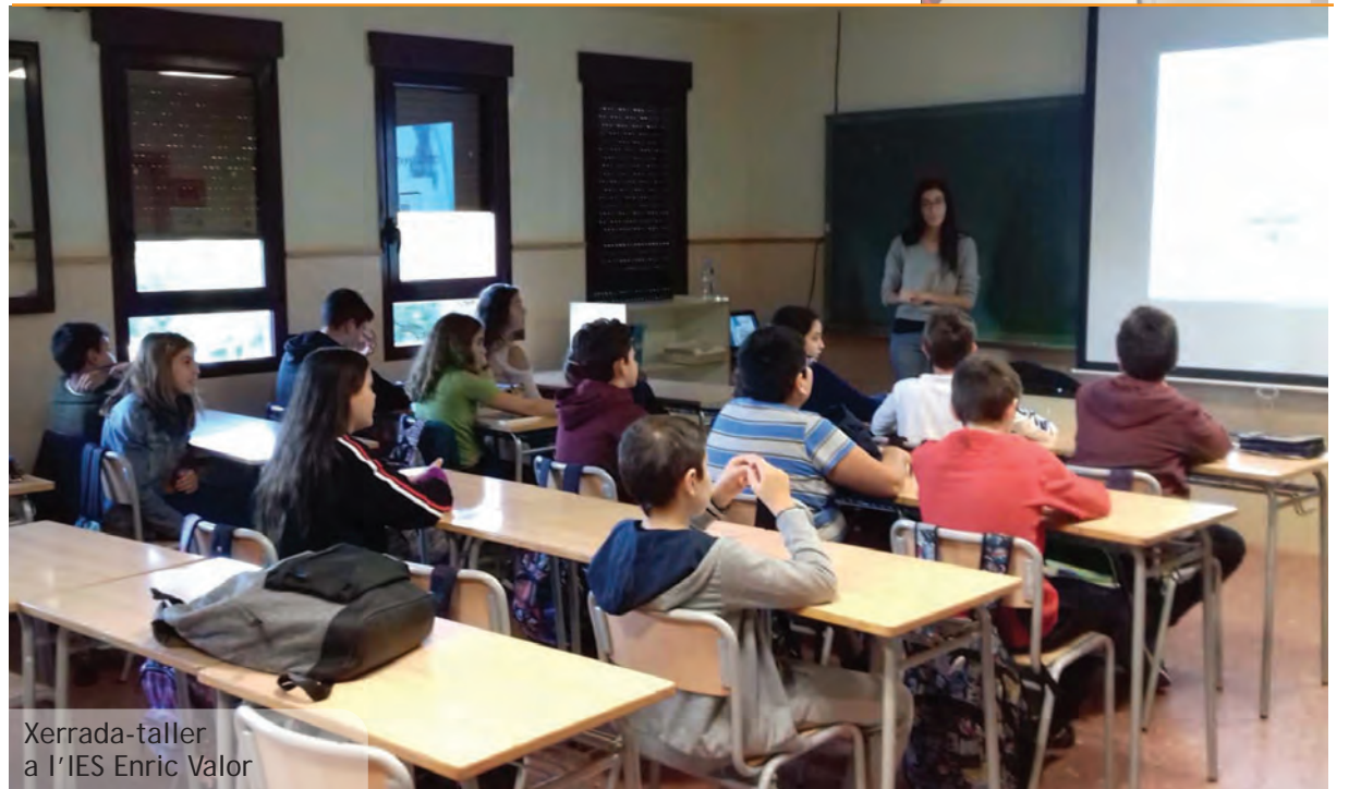
Xerrada-taller a l'IES Enric Valor