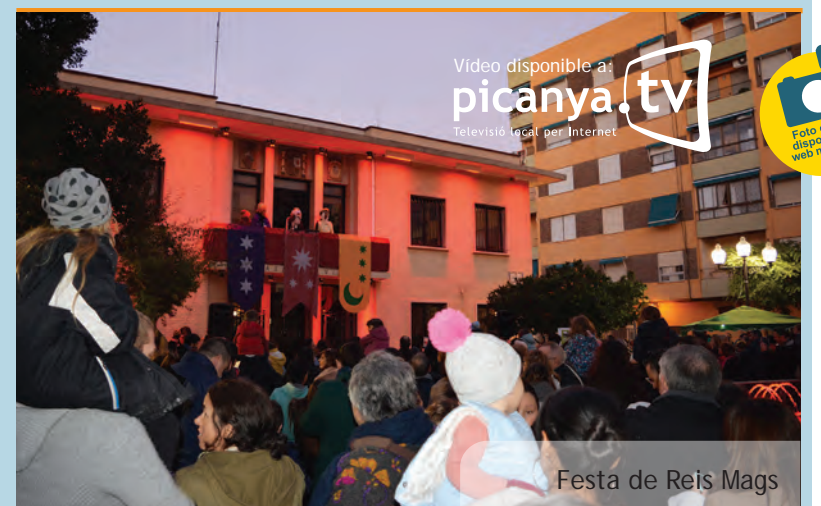
Festa de Reis Mags

L'himne de la Comunitat Valenciana posà el punt i final a esta Exaltació marcada per l'emoció i la intensitat pròpies dels actes fallers i que obri la porta a les Falles de Picanya 2019.