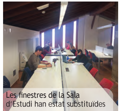
Les finestres de la Sala d'Estudi han estat substituïdes

Els treballs de millora han continuat amb la substitució de les antigues finestres de la façana sud de la sala d'estudi (de fusta i vidres normals) per altres d'alumini i vidres aïllants que han permès reduir de forma molt significativa el nivell del soroll que arriba des del carrer a la sala d'estudi en el pis superior.