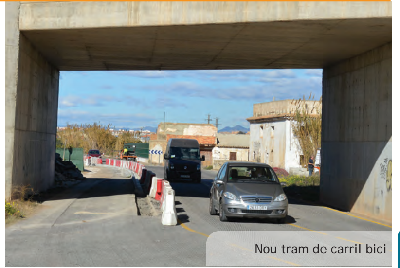
Nou tram de carril bici

Al 2016 la passarel·la entre C/ Ricardo Capella i C/ del Sol fou batejada amb el nom de Maria Cambrils en reconeixement a la importància d'esta pionera del moviment feminista al nostre país. Ara, quan ja tocava renovació de pintura, esta passarel·la ha estat pintada de color violeta en homenatge a Maria Cambrils, feminista.