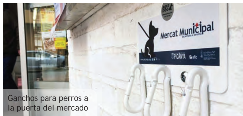
Ganchos para perros a la puerta del mercado