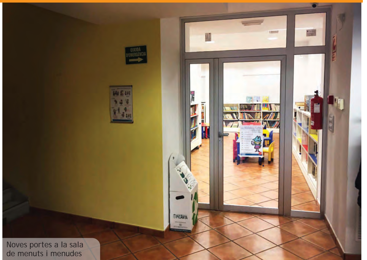
Noves portes a la sala de menuts i menudes