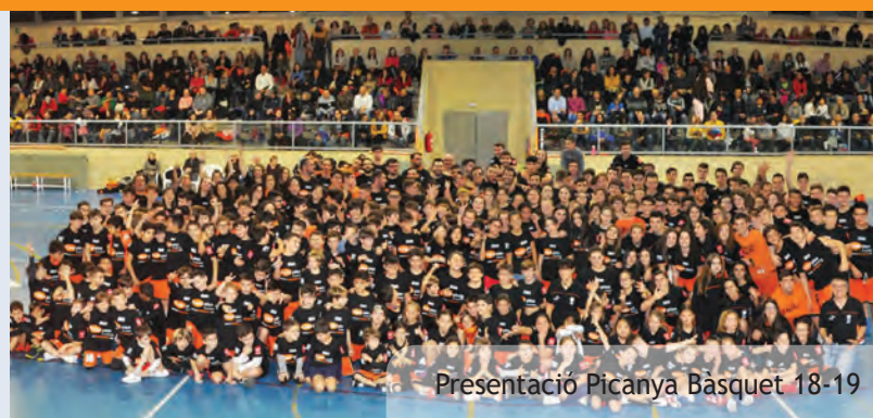
Presentació Picanya Bàsquet 18-19