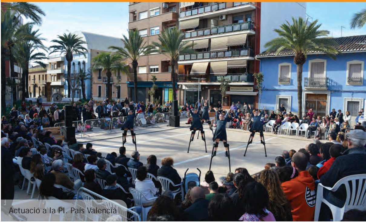
Actuació a la Pl. País Valencià