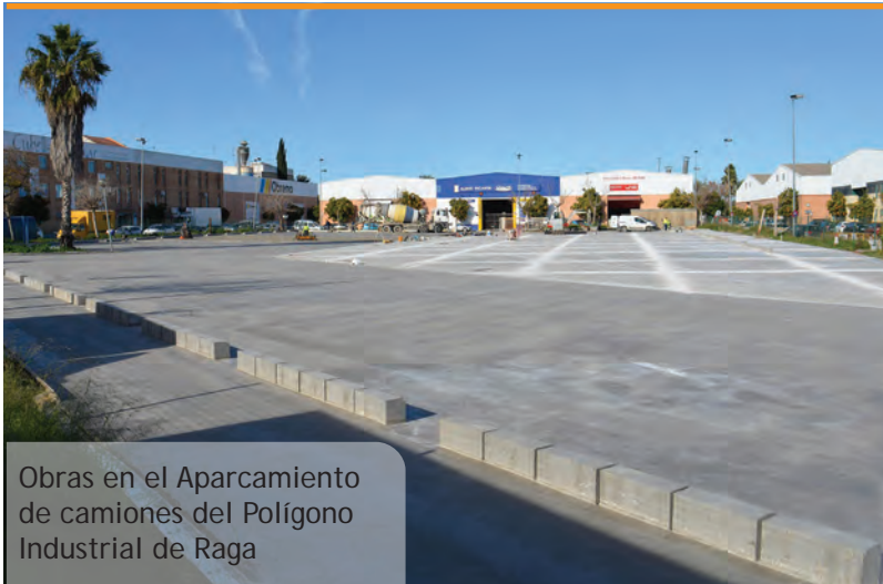
Obras en el Aparcamiento de camiones del Polígono Industrial de Raga

Des del passat mes de novembre el Poliesportiu de Picanya ha ampliat el seu ventall d'opcions de joc amb una tirolina. Instal·lada al Poliesportiu permet a menudes i menuts recórrer uns vuit metres en un vol (sense cap perill) entre dues torretes de fusta. Donada la bona acollida (amb cues de xiquets i xiquetes cada cap de setmana) l'Ajuntament de Picanya està estudiant la instal·lació d'este tipus de joc d'aventura a altres indrets del poble.