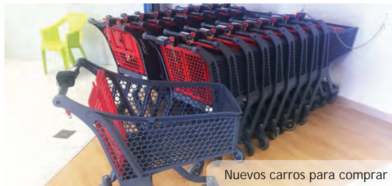
Nuevos carros para comprar

Tal y cómo marca la normativa vigente no se puede acceder con perros al interior del Mercado Municipal pero esto no quiere decir que no podamos pasear hasta allá con nuestra mascota. Se han instalado a las dos puertas del Mercado Municipal unos pequeños dispositivos que permiten enganchar fácilmente al perro y dejarlo allí mientras hacemos la compra.