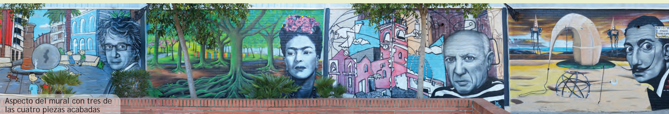
Aspecto del mural con tres de las cuatro piezas acabadas

Javier Mariscal La última pieza en pintarse rinde homenaje al creador valenciano Javier Mariscal. En ella vemos la columna y la piedra de molino de la Plaza del País Valencià (hoy convertidas en fuente) y la fachada del Centro Cultural, interpretadas a través del particular lenguaje plástico de Mariscal. Diferentes personajes de su universo completan la obra. Con esta última pieza queda completado el cuadríptico "Amb altra mirada" que ya podemos disfrutar en la Av. Sanchis Guarner.