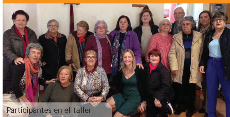
Participantes en el taller