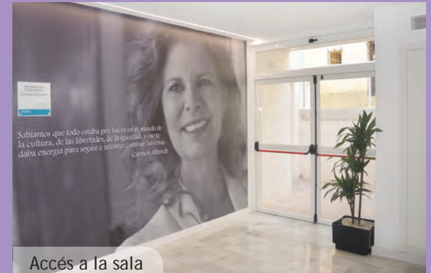
Accés a la sala

La neboda de Carmen Alborch, va cloure la seua intervenció a l'acte d'inauguració de la nova Sala d'Exposicions amb la frase, referida a Carmen Alborch "No nos olvidemos nunca de su sonrisa. Era su forma de afrontar la vida". Ara, a la renovada Sala d'Exposicions de Picanya el primer que veiem quan hi accedim és el somriure de Carmen Alborch i una frase seua, pronunciada en una de les darreres entrevistes que va concedir: "Sabíamos que todo estaba por hacer en el mundo de la cultura, de las libertades, de la igualdad, y eso te daba energía para seguir e intentar cambiar las cosas."