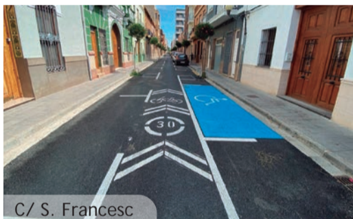
C/ S. Francesc

En estas obras también se ha trabajado en la mejora de cruces y en la eliminación de barreras arquitectónicas. Como en otros puntos del pueblo se han elevado los pasos para peatones en los cruces para priorizar el tráfico de personas y reducir la velocidad de los coches. Con estos pasos elevados también se evitan las dificultades que los bordillos suponen no solo para personas con movilidad reducida (silla de ruedas, andadores, muletas...) sino también para el tráfico de carritos de bebé, carros de compra etc... abundando en la idea de un pueblo con un espacio urbano a la medida de las personas.