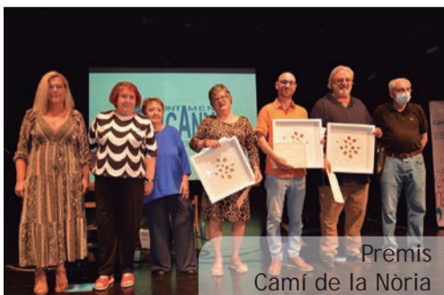
Premis Camí de la Nòria