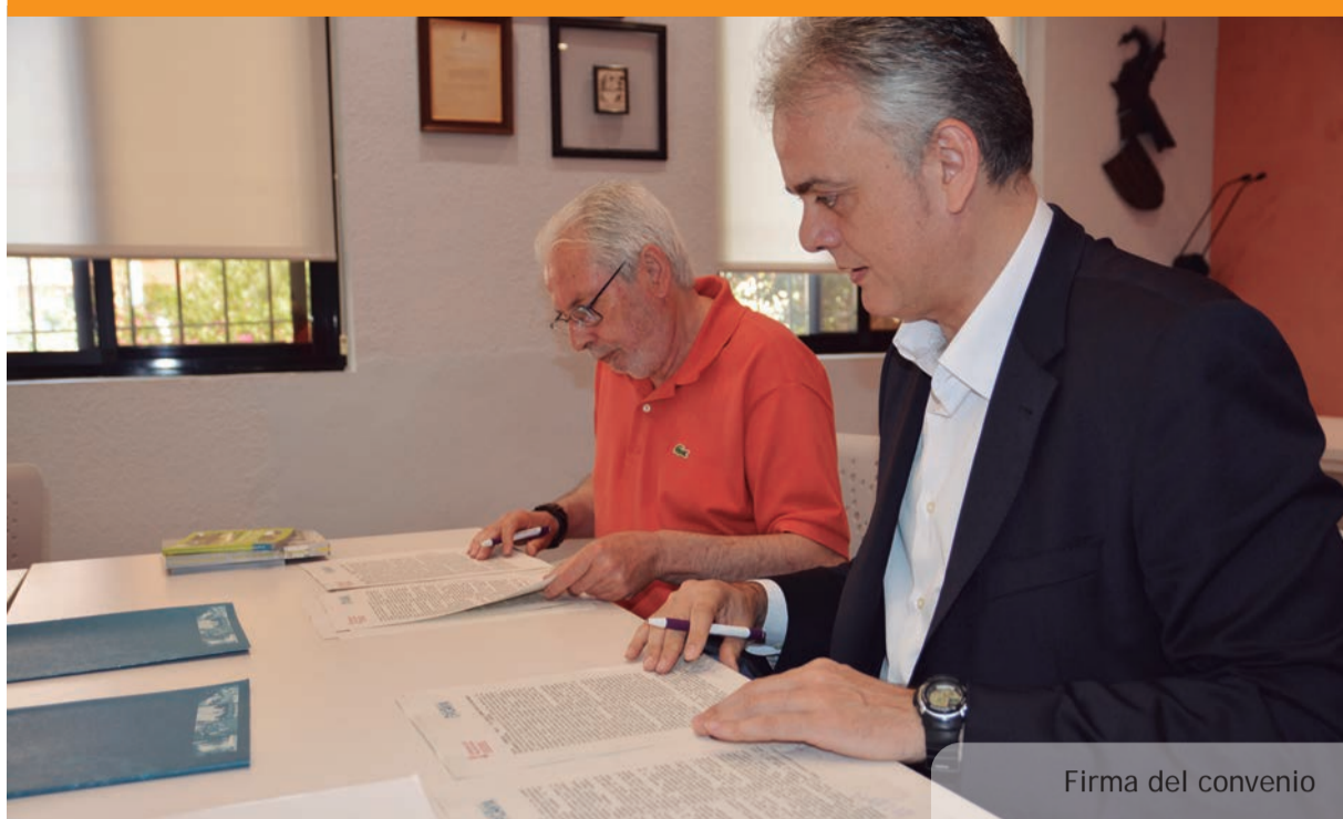
Firma del convenio