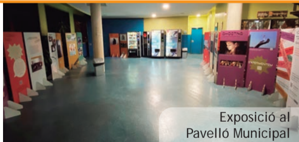
Exposició al Pavelló Municipal

L'oficina municipal d'habitatge de l'Ajuntament de Picanya ofereix informació i complet assessorament per a la tramitació d'estes ajudes.