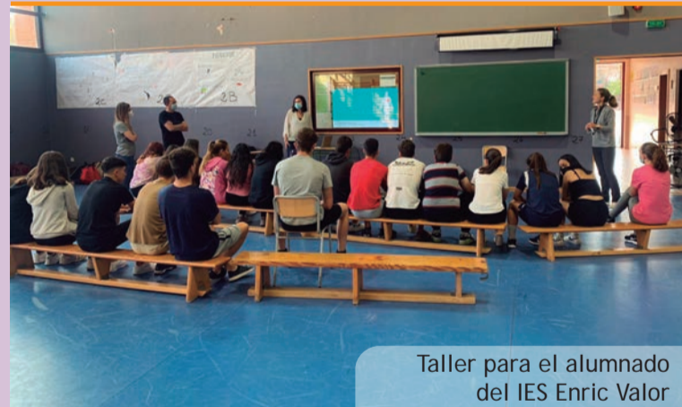
Taller para el alumnado del IES Enric Valor

Hará falta, en todo caso, mantener la máxima atención a la evolución de esta pandemia que, desgraciadamente, todavía continúa entre nosotros y nosotras.