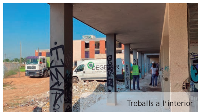
Treballs a l'interior