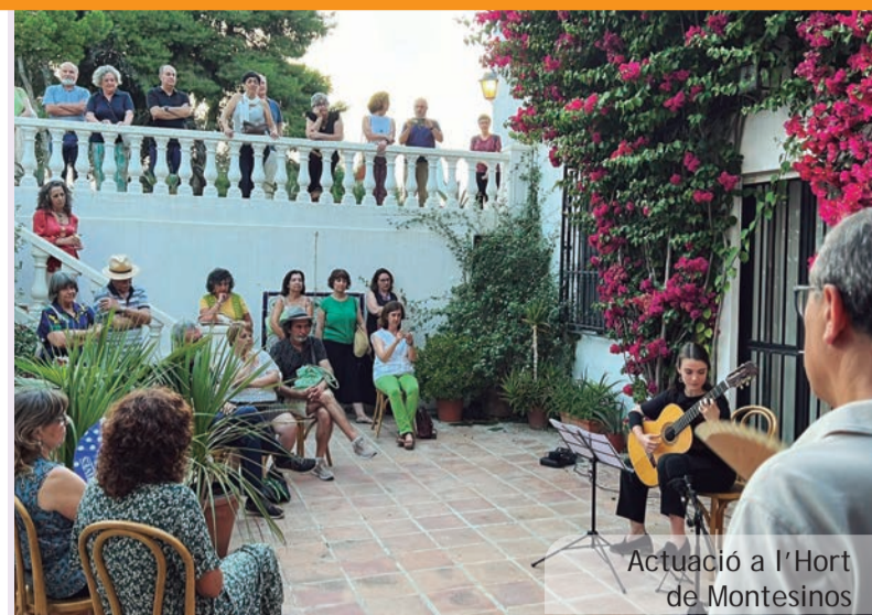
Actuació a l'Hort de Montesinos