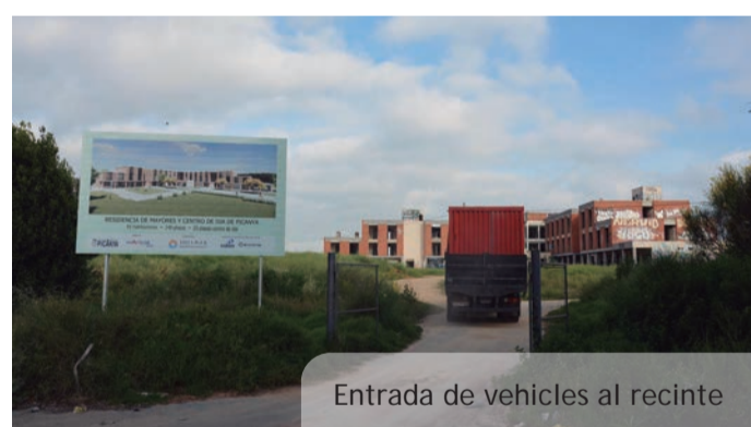
Entrada de vehicles al recinte

com de l'empresa proposada per l'Ajuntament de Picanya que, amb nova llicència d'activitat i nova llicència d'obres ja concedides, té prevista la finalització del projecte i la seua posada en marxa a finals d'este mateix any 2022. Una solució que ha arribat després d'una infinitat de complicacions que han anat des de la fallida i desaparició de l'empresa gestora del projecte, els problemes generats pels canvis normatius i, finalment, la judicialització de tot el procés per part dels diferents creditors de la desapareguda empresa concessionària. Una trajectòria de dificultats administratives, legislatives, judicials... que els serveis municipals han aconseguit resoldre gràcies a un treball permanent des de la fallida de l'empresa gestora designada inicialment. A partir d'eixe moment el personal tècnic municipal de diferents àrees es va centrar en la cerca d'una solució que passava per, d'una banda, trobar una nova empresa gestora i, d'altra banda, aconseguir el tancament dels diferents processos judicials oberts. Tot este important treball finalment ha donat els seus fruits i després d'una aturada realment molt llarga, el projecte, veu ara, el camí final per a la seua posada en marxa al servei de la nostra ciutadania.