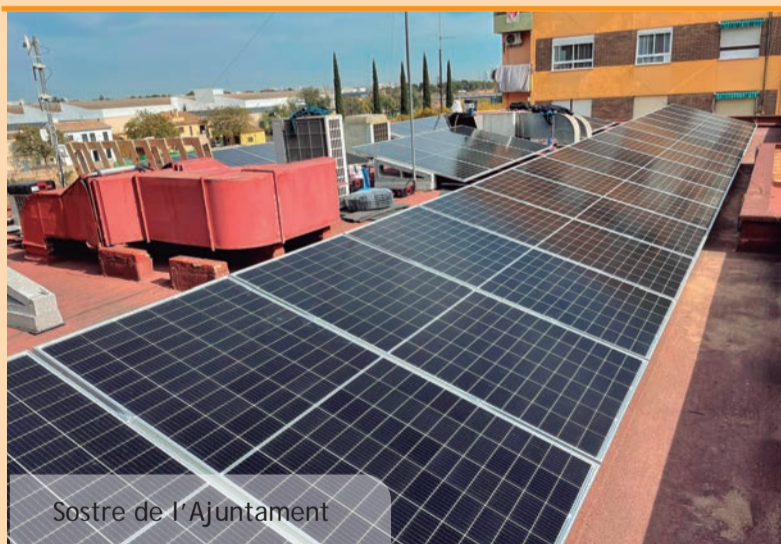
Sostre de l'Ajuntament

Es necesario seguir insistiendo en que la cooperación por parte de vecinos y vecinas (especial atención al agua encharcada) resulta fundamental para garantizar un mínimo éxito en el control de plagas. En caso de detectar presencia de mosquitos-tigre (cuya cría se produce en más de un 95% en jardines, balcones, picinas... de domicilios particulares) o presencia anómala de otros insectos u otras plagas (roedores) se debe telefonar al Ayuntamiento (tel. 961 594 460) para que se pueda realizar la evaluación del problema.