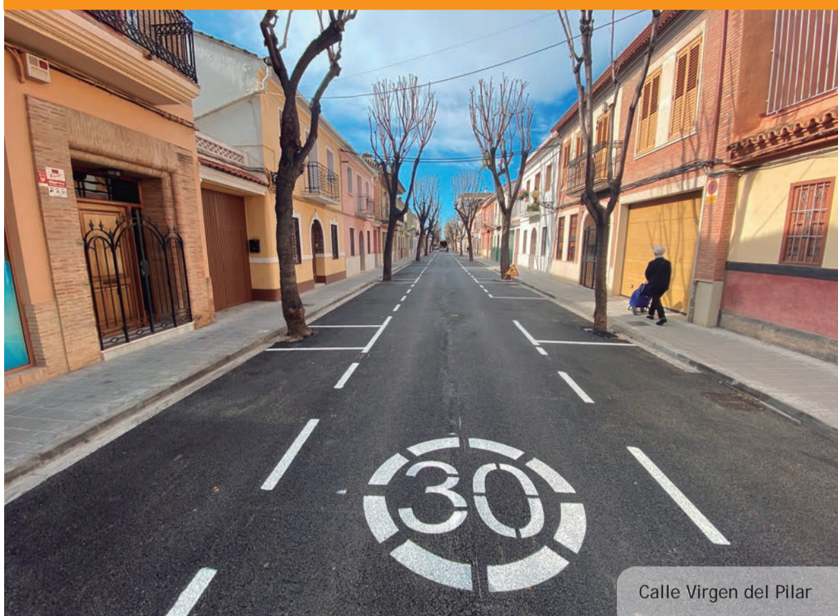
Calle Virgen del Pilar