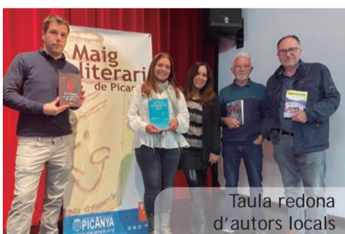
Taula redona d'autors locals

Videos disponibles a: picanya.tv Televisió local per Internet