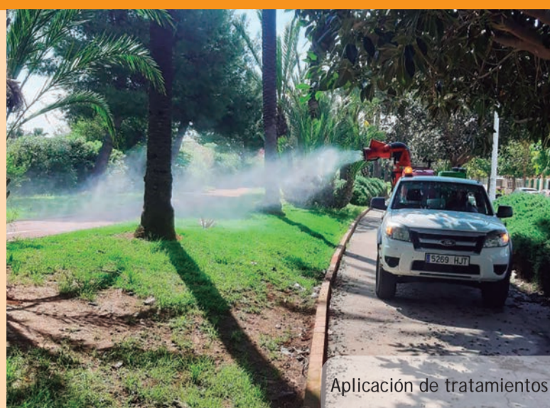
Aplicación de tratamientos

Tot i que els darrers episodis de pluja del mes de maig van obligar a allargar el període d'obres, ja estan en marxa els treballs de reparació dels trams de carril bici vianants als carrers en l'Av. 9 d'octubre, C/ Zenobia Camprubí, Av. Primavera, Av. Blasco Ibáñez i Av. Sanchis Guarnier. S'han realitzat treballs de millora del ferm, eliminació de clots i esclotxes aparegudes amb el pas del temps i finalment, es realitza el repintat i el traçat de nova senyalització horitzontal.