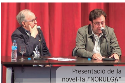
Presentació de la novel·la "NORUEGA"

Amb el parentesi de dos anys ja tancat, el Maig Literari de Picanya ha tornat a celebrar una nova edició, la tretzena, que, de nou, ha complert amb l'objectiu fonamental d'esta iniciativa cultural: unir els dos vessants fonamentals del món de la literatura: autores i autors, per una banda i lectores i lectors d'altra. Així presentacions de llibres, exposicions, taules redones... van tornar a plenar el nostre poble fins i tot a l'Ateneu del nostre poble que també va voler sumar-se amb la celebració del seu 1r "Ateneu literari" amb tertúlies i presentacions de llibres.