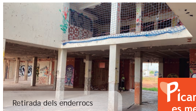
Retirada dels enderrocs