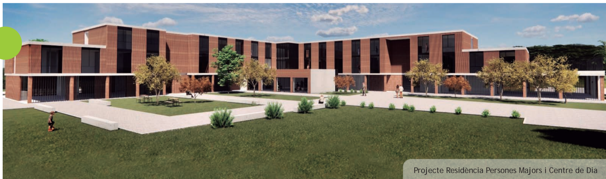
Projecte Residència Persones Majors i Centre de Dia

La solució als processos judicials i dificultats administratives per part del serveis municipals permet abordar la posada en funcionament de la instal·lació