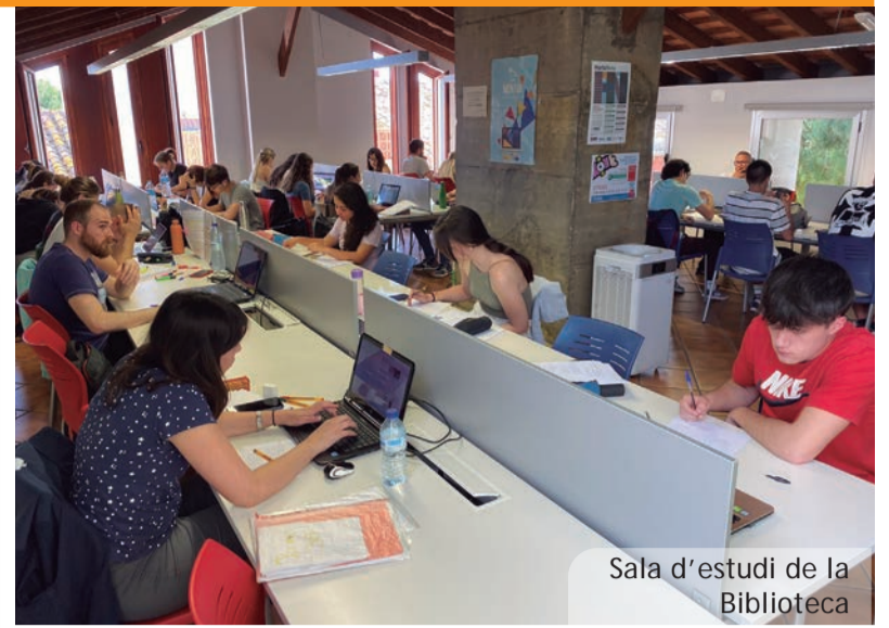
Sala d'estudi de la Biblioteca

Amb l'ús de disfresses i accessoris crearem representacions dels nostres personatges favorits de fantasia.