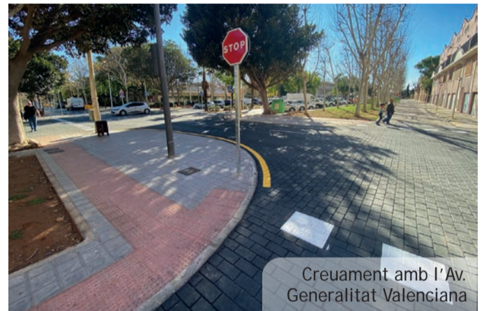
Creuament amb l'Av. Generalitat Valenciana

H i ha millores que sols s'aprecien en gestos tan bàsics, necessaris i habituals com obrir una aixeta i disposar d'aigua potable en les millors condicions de subministrament. Millores que no són visibles però que resulten absolutament imprescindibles. Al nostre poble la renovació de la xarxa hidràulica està pràcticament finalitzada al centre històric i, amb estes obres d'adequació de la CV-406, també s'ha completat als carrers Senyera i Ricard Capella. La xarxa d'abastiment d'aigua potable ha dit adeu al fibrociment i fins i tot el PVC i s'ha renovat amb materials moderns i que ofereixen les màximes garanties de durabilitat i seguretat (evitant contaminació i avaries). De la mateixa forma s'ha renovat la xarxa de clavegueram.