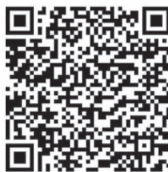
Accedeix al vídeo de l'acte amb el teu mòbil