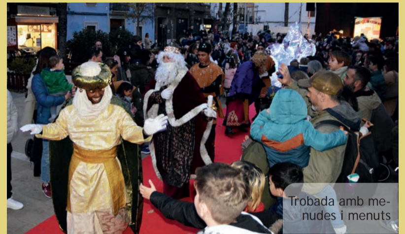
Trobada amb menudes i menuts