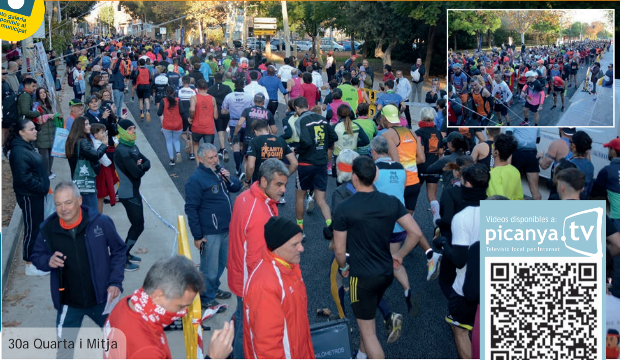
30a Quarta i Mitja

Foto galeria disponible en web municipal