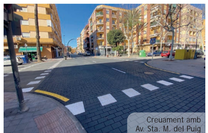
Creuament amb Av. Sta. M. del Puig