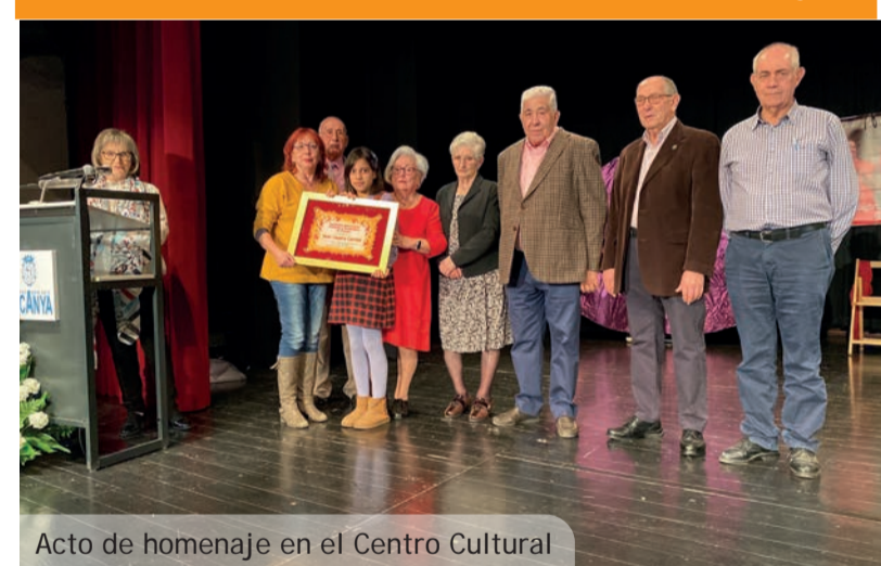
Acto de homenaje en el Centro Cultural

Cada día es más evidente la necesidad de una gestión responsable de los residuos. En esta gestión, el primer paso está en manos de la ciudadanía. Una vez producido el residuo somos la ciudadanía los responsables de depositar ese residuo en el lugar adecuado para garantizar su óptimo tratamiento. En este sentido, la extensa red de contenedores, el Eco-Parc junto al cementerio viejo de Paiporta, estos Eco-Parc móviles, e incluso el Servicio Gratuito de Recogida de Voluminosos ofrecido por el Ayuntamiento (solo hay que telefonar al 961 591 448) son opciones suficientes como para evitar, por ejemplo, el abandono de trastos a la vía pública.