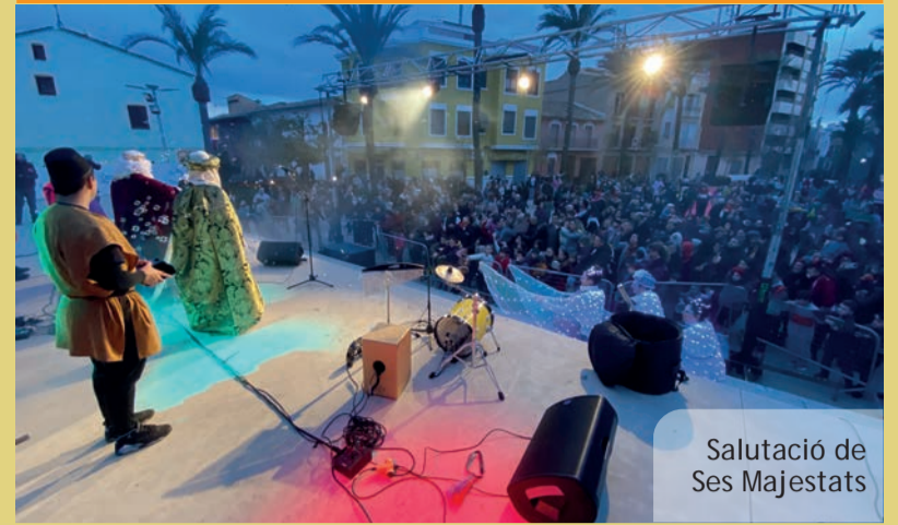
Salutació de Ses Majestats

Accedeix al vídeo de la prova amb el teu mòbil