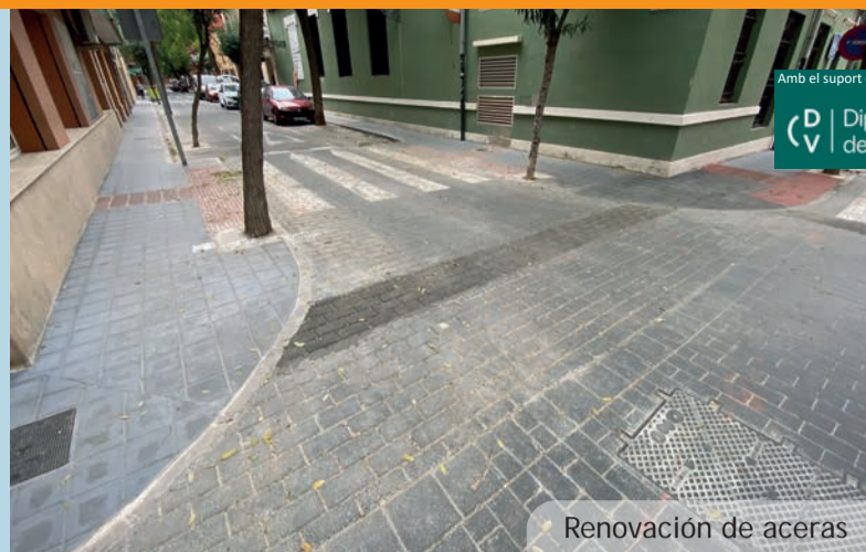
Renovación de aceras

usuarios del servicio de metro podrán acceder a los andenes. Uno de estos pasos estará situado junto al edificio de la estación para permitir el acceso de Personas de Movilidad Reducida (PMR). El otro estará situado en el andén dirección València.