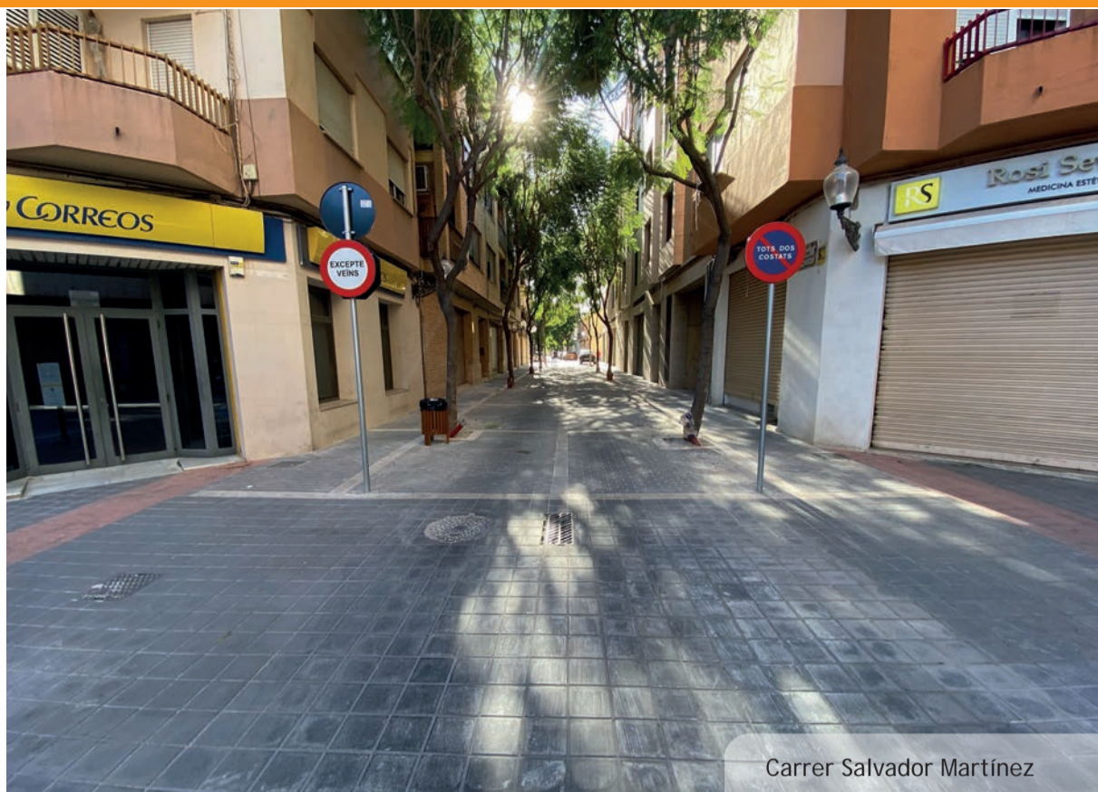
Carrer Salvador Martínez