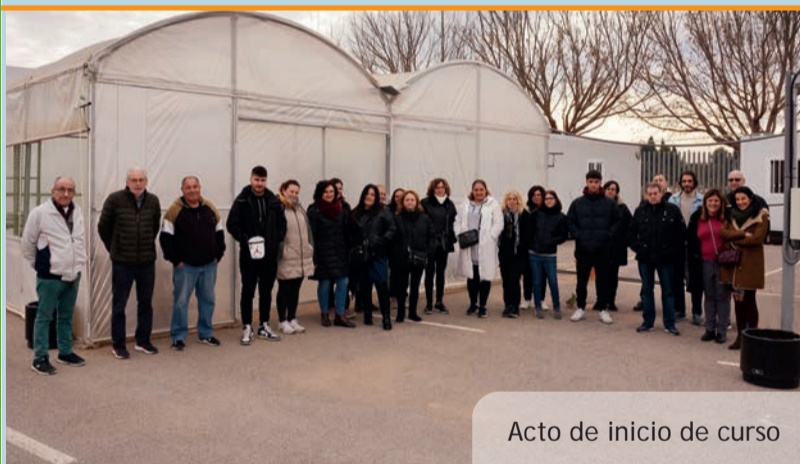
Acto de inicio de curso

En esta 6a edició han estat prop de 50 les poblacions que aspiren a obtenir les prestigioses "Flors d'Honor".