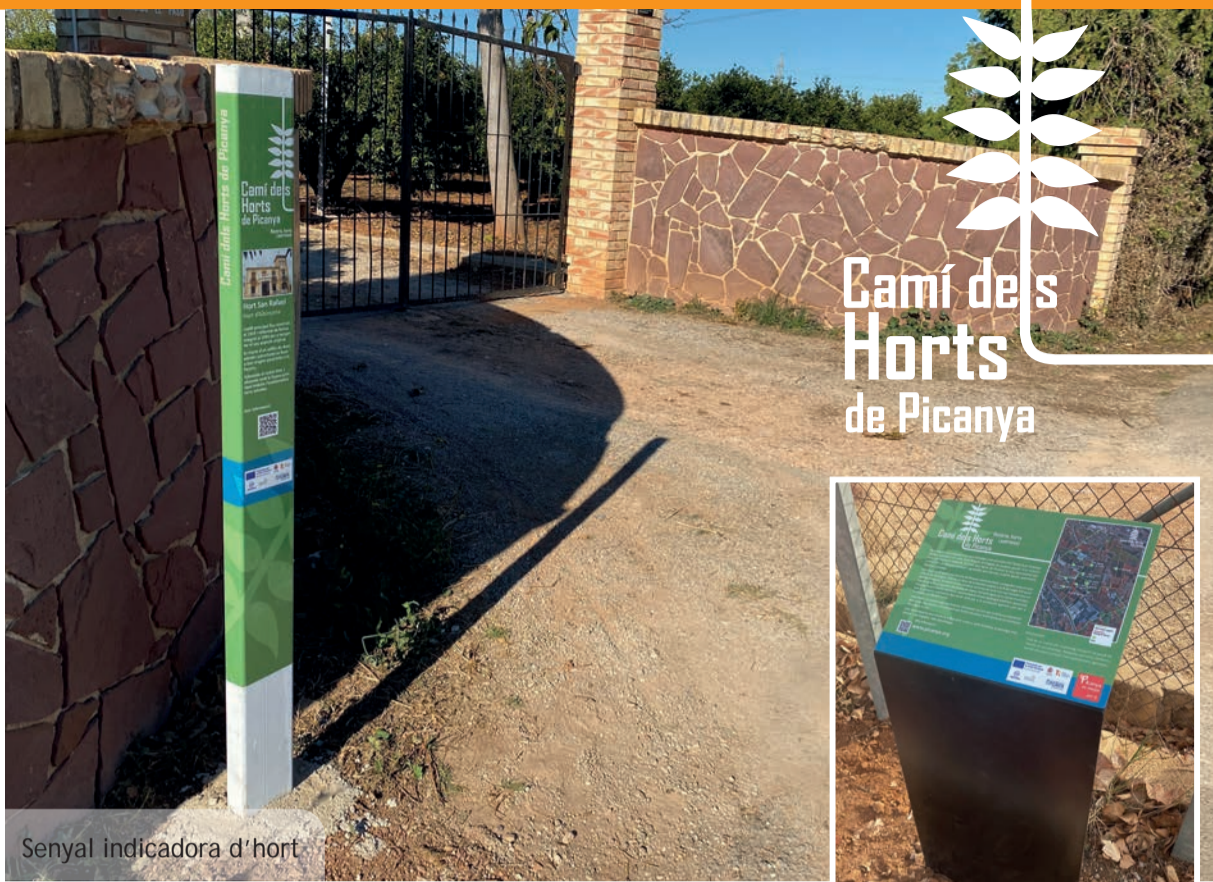
Senyal indicadora d'hort