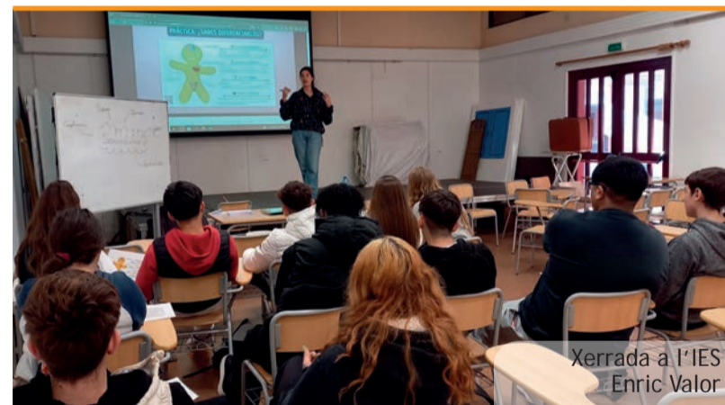
Xerrada a l'IES Enric Valor

D'esta manera la biblioteca ha disposat d'un dels horaris més extensos dels oferits per les biblioteques públiques del nostre entorn i el més extens si el comparem amb poblacions similars al nostre poble.