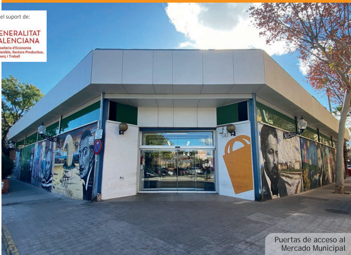
Puertas de acceso al Mercado Municipal