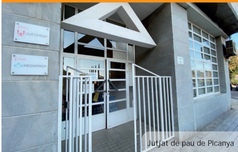
Jutjat de pau de Picanya

En una segunda fase se procederá a realizar otra serie de mejoras tanto en el exterior (placas solares) como en el interior (nuevos pavimentos, mejora seguridad...) del edificio.