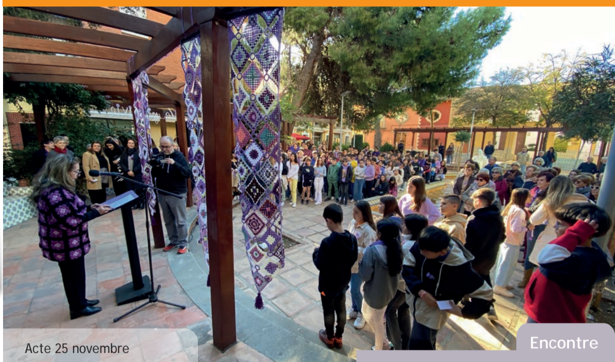
Acte 25 novembre