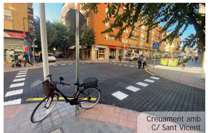
Creuament amb C/ Sant Vicent