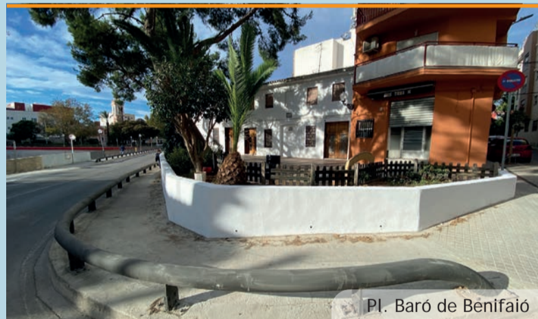
Pl. Baró de Benifaió

Para esta intervención los servicios técnicos municipales han conseguido una subvención por parte de la Diputación de València. una subvención por part de la Diputació de València.