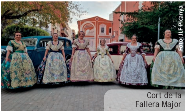
Cort de la Fallera Major