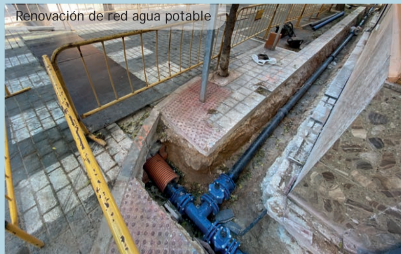
Renovación de red agua potable