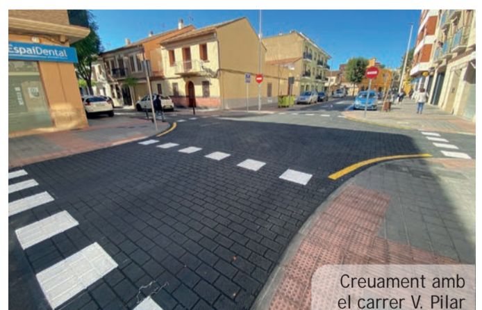
Creuament amb el carrer V. Pilar