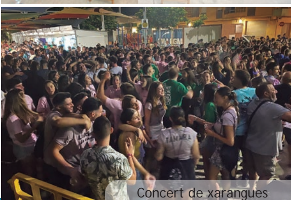
Concert de xaràngues