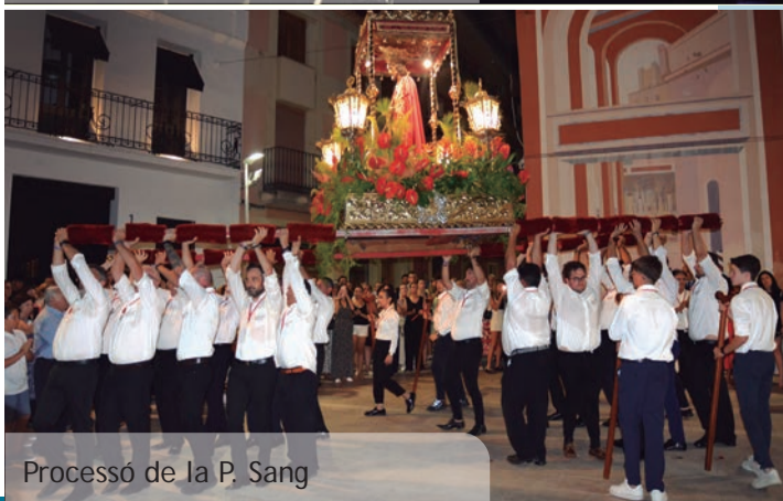
Processó de la P. Sang