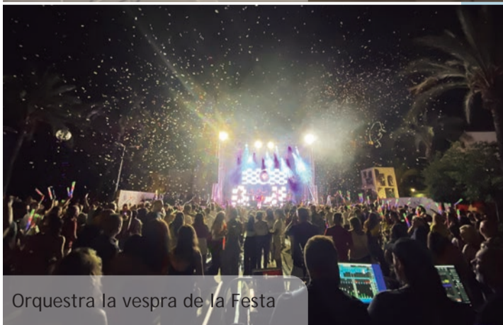
Orquestra la vespra de la Festa