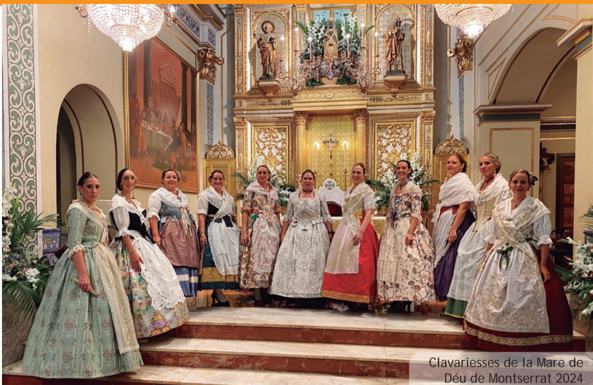
Clavariesses de la Mare de Déu de Montserrat 2024

El dijous 19 de setembre tingué lloc, a l'Ajuntament, la reunió d'avaluació final de tot el que ha suposat esta Trobada i tant des d'Escola Valenciana com des de Guaix (coordinador comarcal) es va voler destacar molt especialment el gran treball realitzat des del nostre poble, tant a nivell d'Ajuntament com, molt especialment, des del món educatiu i des del teixit associatiu. Una implicació col·lectiva, que fou clau per a fer d'esta 36a Trobada d'Escoles en valencià tot un èxit que ha de servir, fonamentalment, per a continuar esponent el valencià en el seu camí de normalització i ús habitual a tots els àmbits.