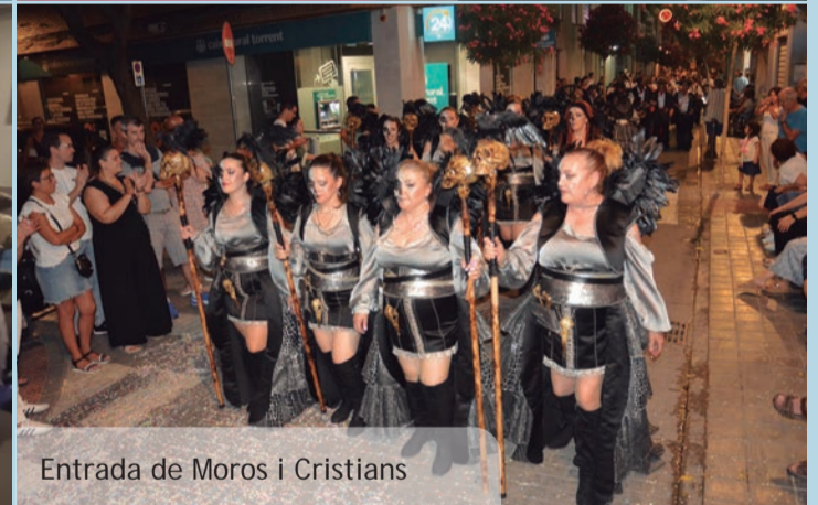
Entrada de Moros i Cristians