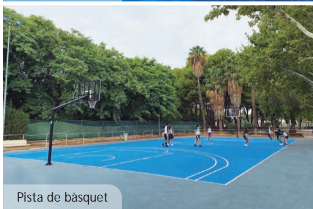
Pista de bàsquet

En la línia de treballs anteriors, i altres previstos, s'han renovat la segona pista de tennis i la pista de bàsquet