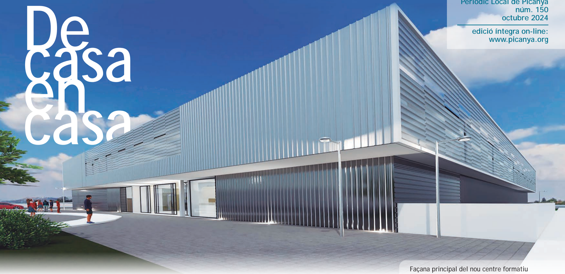
Façana principal del nou centre formatiu