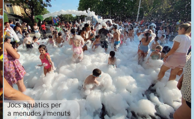
Jocs aquàtics per a menudes i menuts