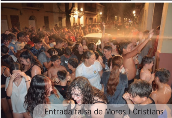
Entrada falsa de Moros i Cristians