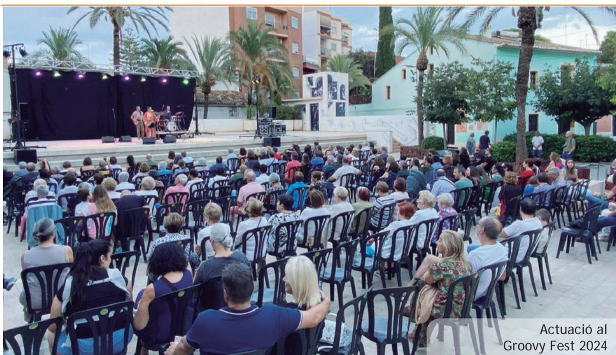
Actuació al Groovy Fest 2024

Organitzada per la Junta Local Fallera, amb la col·laboració de les quatre comissions i l'Ajuntament de Picanya, esta trobada multitudinària, té com a objectiu estretar llaços entre els diferents col·lectius implicats en les activitats falleres i celebrar que ja estem a menys de 6 mesos (mig any) de tornar a celebrar als nostres carrers i places les millors festes del món.