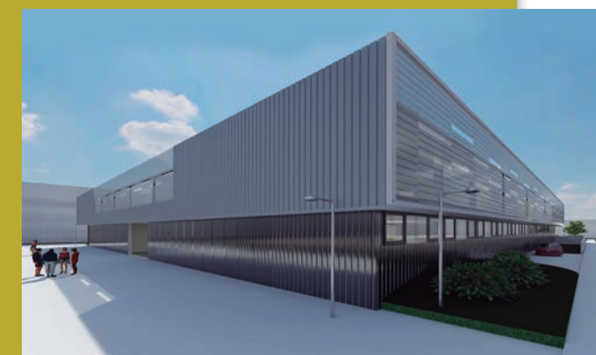
Fachada posterior del edificio

En concreto el nuevo edificio supone la construcción de un nuevo aparcamiento subterráneo con plazas de uso público. La gestión de este nuevo aparcamiento está previsto que se desarrolle en la misma línea del aparcamiento municipal situado en la Av. Sanchis Guarner. Un modelo que ya ha demostrado su eficacia dado que el aparcamiento de la avenida Sanchis Guarner se encuentra prácticamente al 100% de su capacidad.