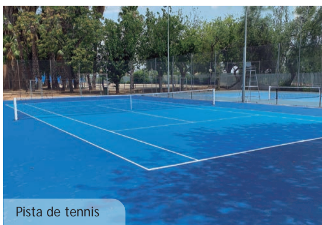
Pista de tennis