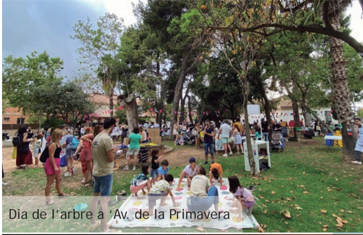
Dia de l'arbre a 'Av. de la Primavera

Com en anys anteriors, la resposta del públic, en totes les activitats, fou extraordinària i activitats com ara la Mostra de Teatre i Música de Cercavila, les Orquestres, l'entrada falsa, la Discomòbil, les actuacions de l'Associació de Ballet o la Unió Musical, els sopars a la fresca... van plenar carrers i, molt especialment, la Plaça del País Valencià que junt al Passeig de les Lletres (seu de bona part de les penyes festives més joves) formen l'autèntic epicentre de la vida cultural i festiva del nostre poble.