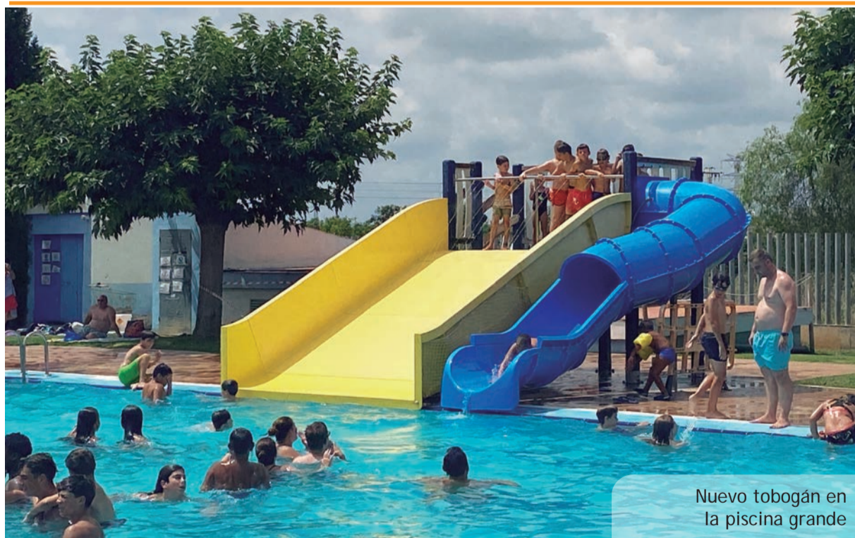
Nuevo tobogán en la piscina grande