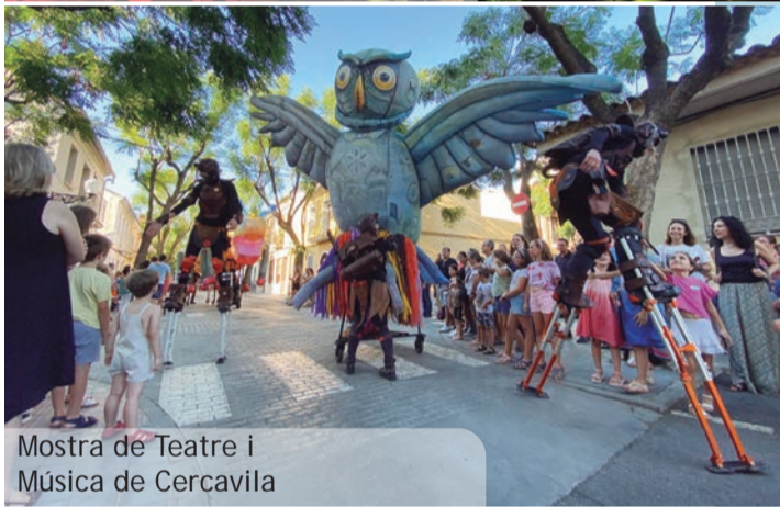
Mostra de Teatre i Música de Cercavila