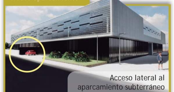
Acceso lateral al aparcamiento subterráneo