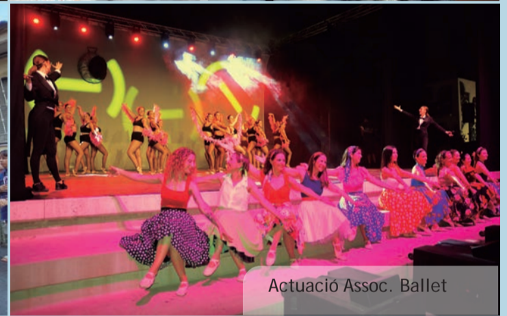
Actuació Assoc. Ballet