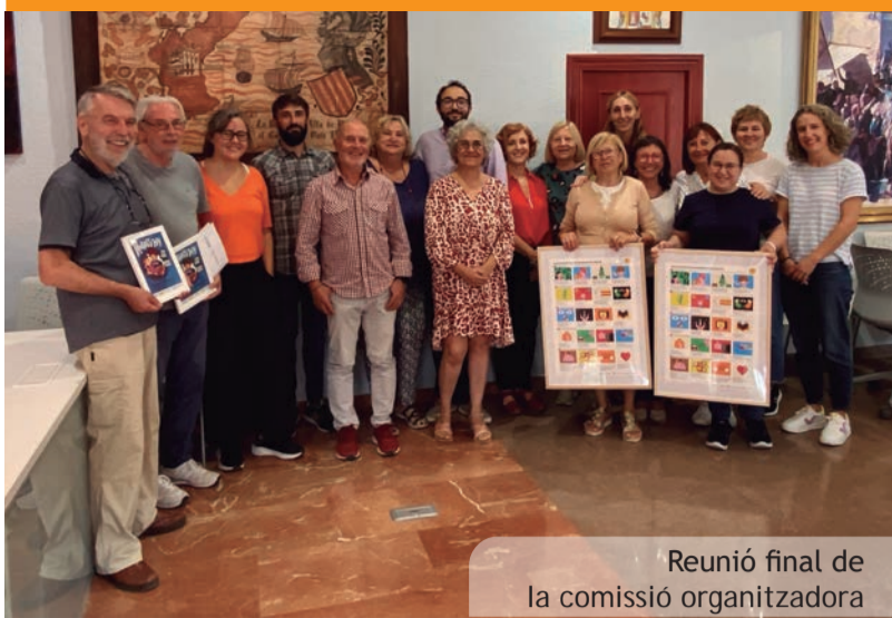
Reunió final de la comissió organitzadora