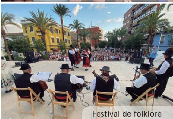
Festival de folklore