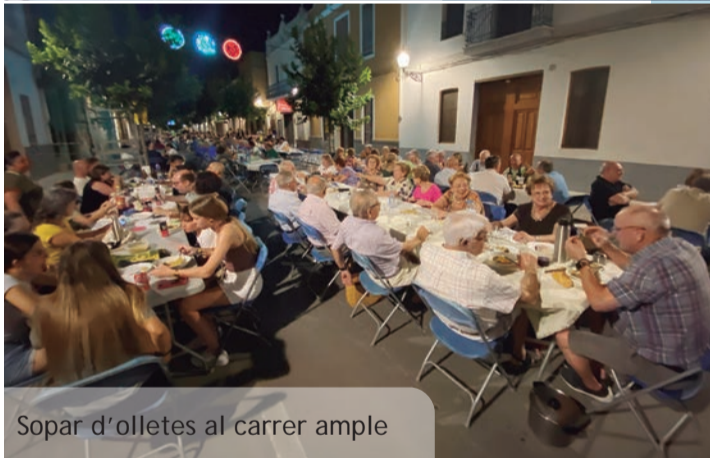
Sopar d'olletes al carrer ample