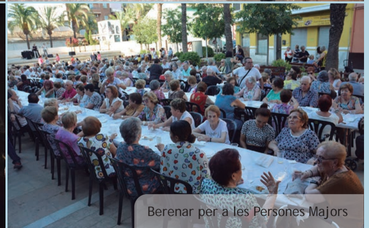
Berengar per a les Persones Majors