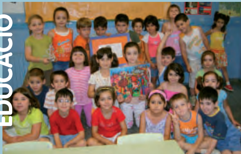
La classe autora del conte