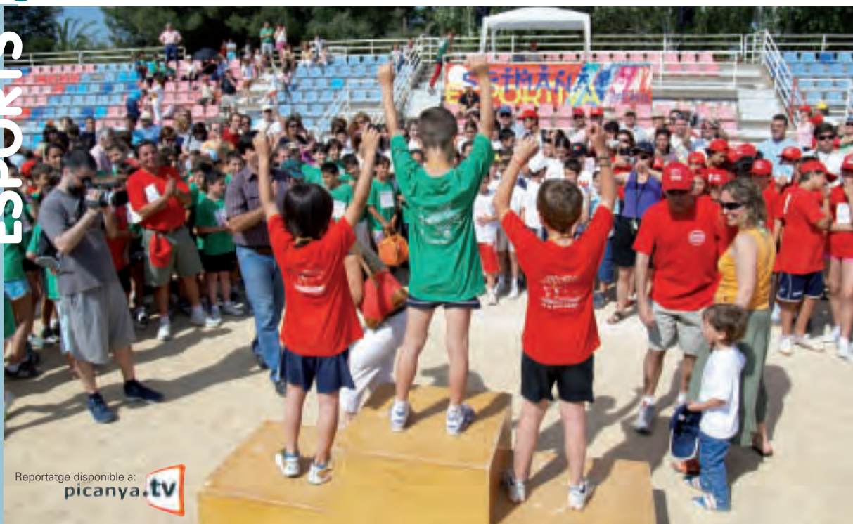
Reportatge disponible a: picanya.tv