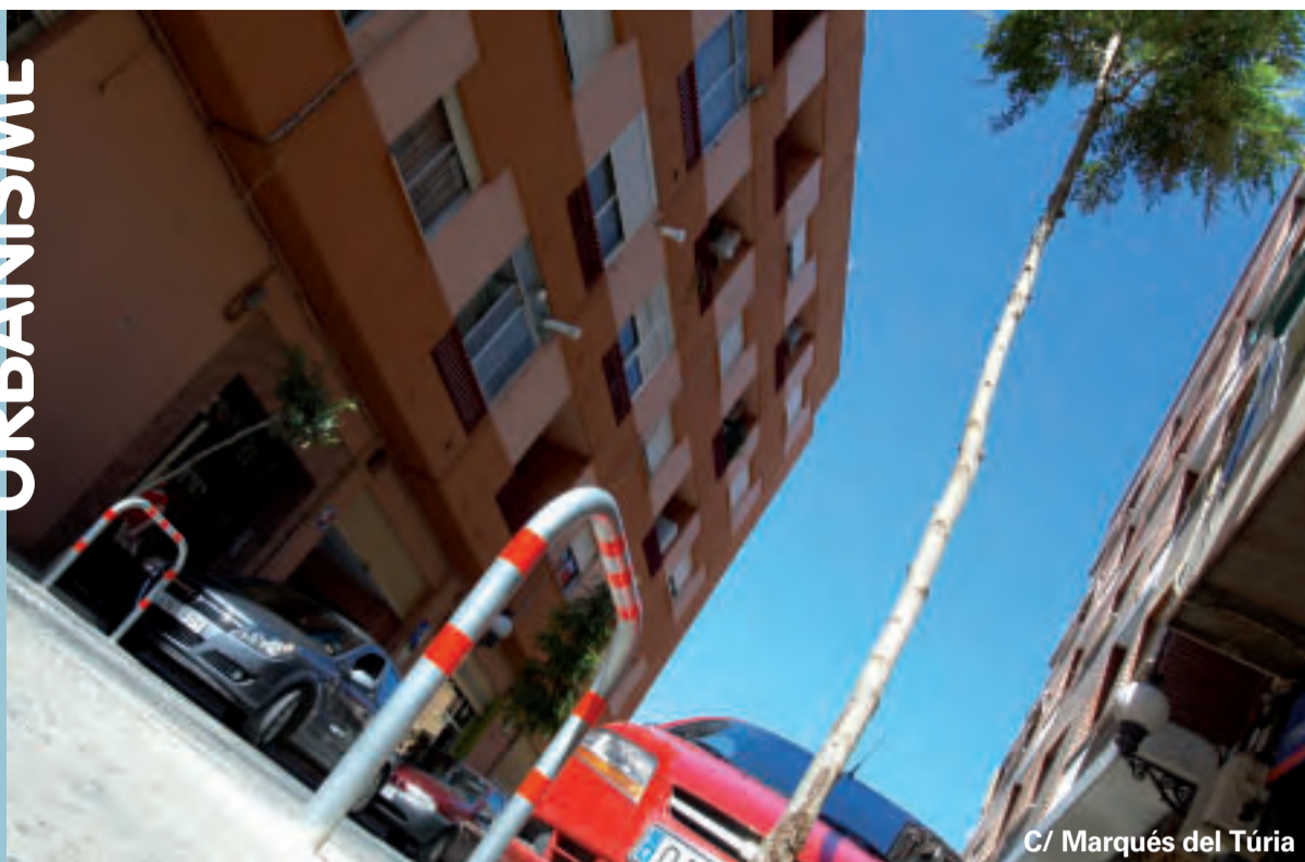
C/ Marqués del Túria