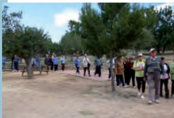
El grup durant el passeig

El passat 7 de març milers de dones arribades de diferents pobles de la nostra comarca van plenar de color i alegria els carrers de Picanya. El 18é Recreo-Cross de la Dona tornà a convertir-se en una gran festa de diversió, esport i reivindicació dels drets "esportius" de les dones, especialment, de les mestresses de casa.