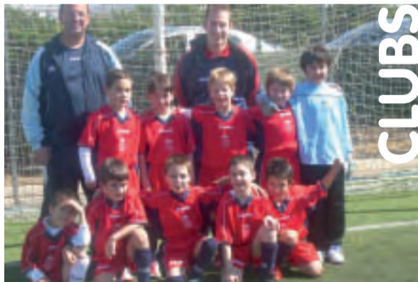
Els menuts de l'escola de futbol

Els i les participants gaudiren d'un agradable passeig per l'entorn natural de Sant Vicent de Lliria. Aquesta zona natural, situada entre les localitats de Lliria i Olocau a la comarca del Camp de Túria conforma un entorn perfecte per a realitzar exercici físic de baixa intensitat, el més recomanable per a les persones majors que, a més, d'aquesta manera poden gaudir de l'aire lliure durant un matí d'activitat compartida.