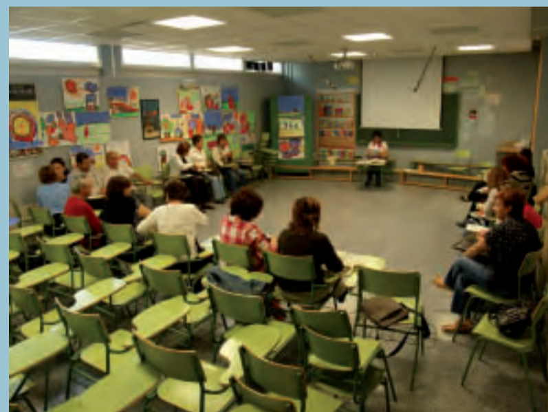
Un moment del curs

En aquests moments més de 60 peces formen la graella de PicanyaTV. Festes, aniversaris, música, premis, esports, escoles, persones majors, inauguracions, activitats, personatges... formen part d'aquest arxiu audiovisual en permanent actualització i creixement. En conjunt, aquests vídeos han estat descarregats en més de 16.000 ocasions pels internautes en una xifra que continua creixent a un ritme superior a les 1.000 descàrregues mensuals.