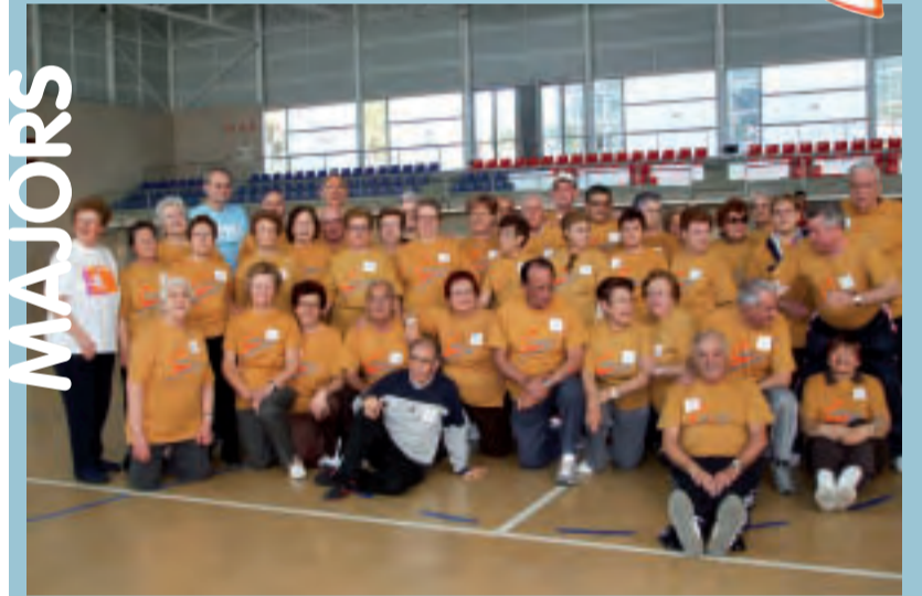
Participants en unencontre esportiu