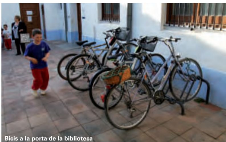
Bicis a la porta de la biblioteca

Picanya ha adquirit prop de 60 bicicletes per a prestar-les als edificis públics i empreses per tal de fomentar l'ús d'aquest mitjà de transport als desplaçaments curts. Aquesta mesura vé a complementar altres que ja s'han pres els darrers anys per tal d'animar els veïns i veïnes de Picanya a deixar el cotxe a casa i usar la bicicleta o, simplement, caminar pel poble.