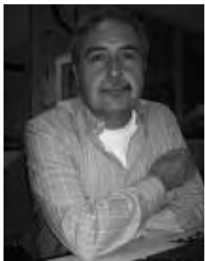
Vicente Molina Foix