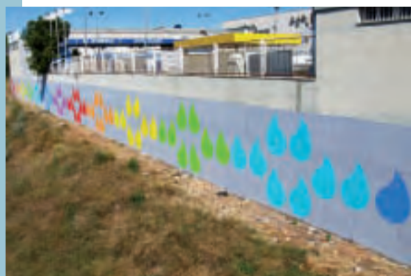
Nova pintura junt al barranc

A les darreres setmanes s'ha començat a aplicar tractaments fitosanitaris als arbres dels carrers i parcs. Allò que es pretén és protegir-los de les plagues més perilloses, les que podrien matar l'arbre. Els productes que s'estan emprant no són tòxics, ja que s'ha optat pels tractaments més suaus i respectuosos amb el medi. A més a més, per tal d'evitar molèsties als veïns s'està emprant el mètode d'endoteràpia vegetal, és a dir, la injecció directa del producte al tronc de l'arbre. Amb aquesta tècnica s'estalvia l'ús de productes fitosanitaris, ja que la dosi va directament a l'arbre, s'evita la fumigació i l'alliberament de productes químics a l'atmosfera.