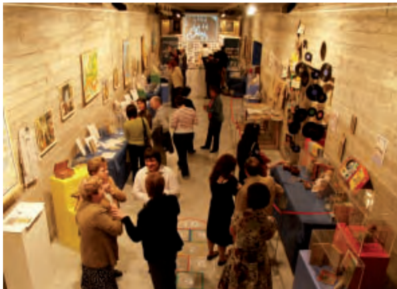
Exposició "Picanya en el record"

Per a finalitzar, el dia 8 de juny, el Grup de Danses Carrasca i l'Escola Municipal de Danses celebren també el seu festival que, de ben segur, plenarà el Centre Cultural.