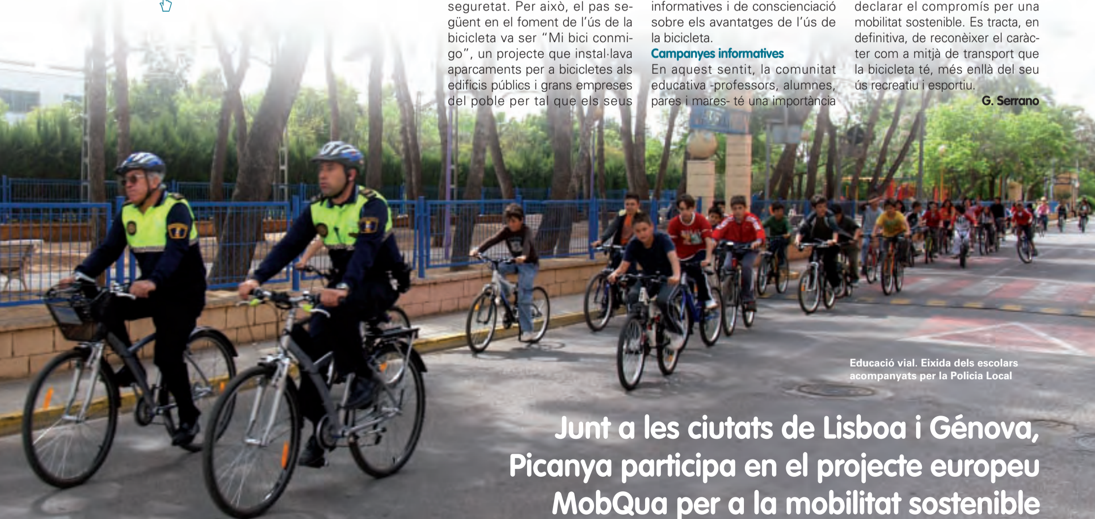
Educació vial. Eixida dels escolars acompanyats per la Policia Local

Un dels problemes amb què es trobaven els usuaris de la bicicleta era la manca d'aparcaments on deixar la seua bici amb seguretat. Per això, el pas següent en el foment de l'ús de la bicicleta va ser "Mi bici conmigo", un projecte que instal·lava aparcaments per a bicicletes als edificis públics i grans empreses del poble per tal que els seus