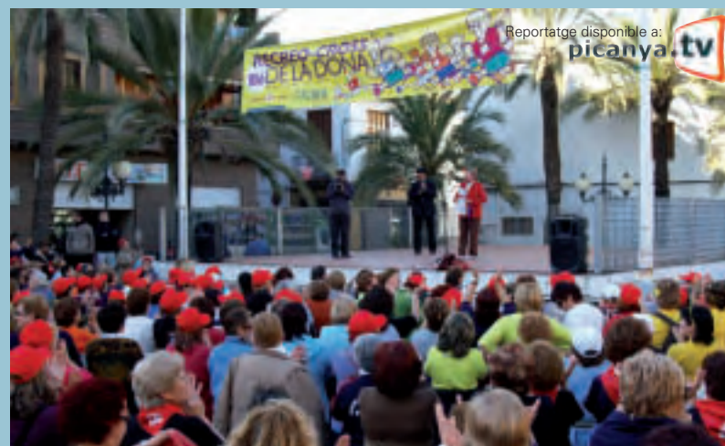
Reportatge disponible a: picanya.tv