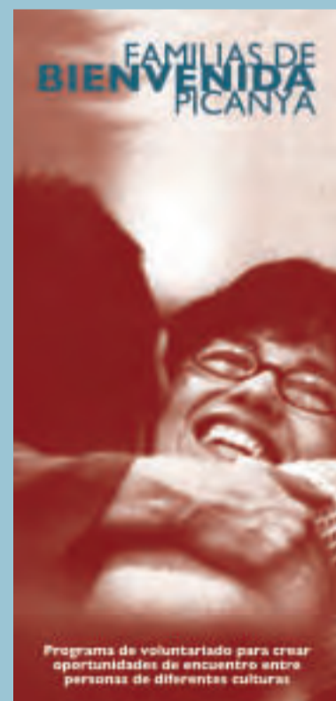
Folleto anunciador del programa

Este programa utiliza la metáfora de "puentes interculturales", su tendido es nuestra iniciativa. Pero emprender el camino, cruzar el puente, encontrarse y descubrirse depende de todos y todas. Es una oportunidad de diálogo, de ejercicio ciudadano de la solidaridad, en la realidad más próxima que tenemos, que es nuestro municipio, que está creciendo demográficamente, pero que queremos conservar como pueblo, como espacio donde las demás personas nos sean conocidas, cercanas, amigas.