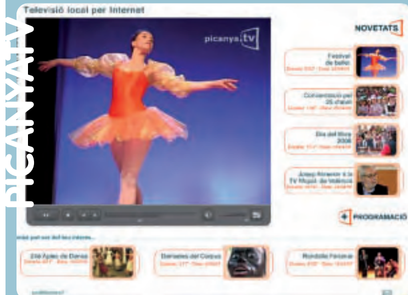
Reportatge sobre el festival de ballet

Una vegada finalitzades les obres de millora de la vorera del carrer València, s'han fet unes altres obres a la vorera de l'altre costat. El que s'ha fet és donar prou amplària a la vorera existent, que era molt estreta. A més a més, s'ha millorat el pas per als vianants, amb una superfície més regular i segura. També s'han col·locat bol·lards per tal d'evitar que els cotxes puguin envair la vorera. Amb aquestes obres s'ha aconseguit millorar el pas dels vianants.