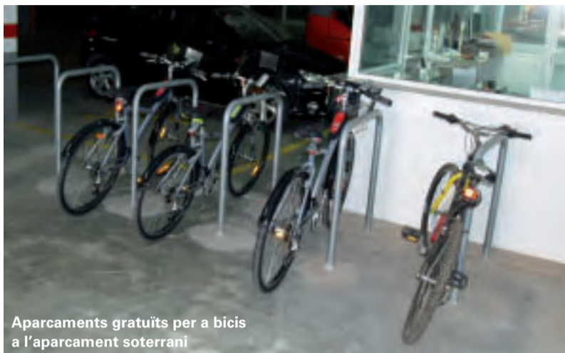
Aparcaments gratuïts per a bicis a l'aparcament soterrani