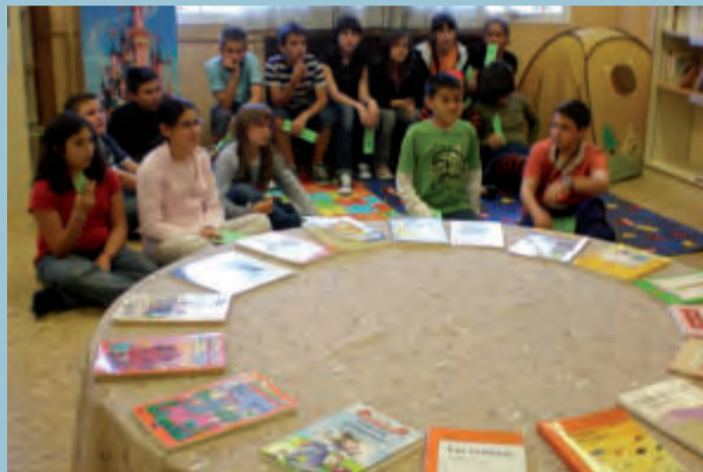
Fira de llibres a l'Ausiàs March