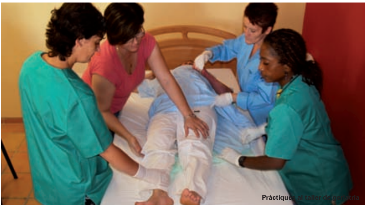
Pràctiques al taller de geriatria

Al nostre poble, en el Centre Cultural de Picanya, s'acollirà, en sessió oberta al públic, una projecció d'aquest documental el 18 d'octubre. Una gran oportunitat per conèixer de forma detallada i documentada la realitat d'un esdeveniment històric al nostre municipi.