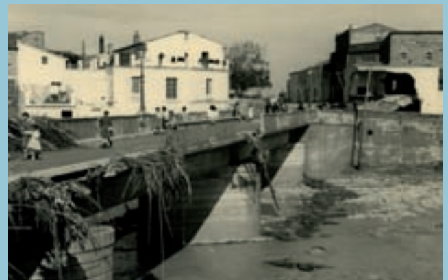
Dues imatges de Picanya després del pas de l'aigua