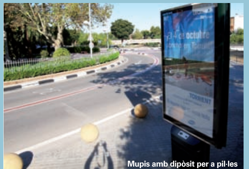
Mupis amb dipòsit per a pil·les

Recentment s'ha realitzat una plantació d'arbres i arbusts a la jardineria que separa el carril bici del camí que va cap al Poliesportiu de Picanya. S'ha plantat una alineació de pittosporum tobira , un arbust molt resistent a la sequera i al fred que es pot retallar per a fer una tanca lineal. També s'han plantat arbres de l'espècie plàtan d'ombra, que serviran per a fer més agradable el passeig fins el Poliesportiu. En tota la zona que ha estat plantada s'ha instal·lat també el reg per degoteig per tal d'aprofitar al màxim els recursos, a l'hora que es conserva la vegetació i racionalitzar el consum d'aigua.