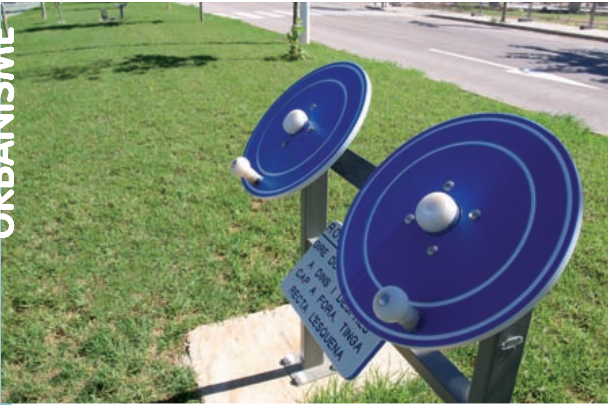
Nou conjunt d'aparells