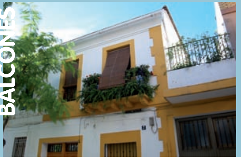
Balcón ajardinado en la C/ Vicent Serrador

Des de ací animar-vos per què cada dia siguem més els comerços associats, per unir esforços i per a aconseguir una bona promoció a través de la imatge corporativa que ens identifique i possibilita que, cada dia més, la gent del poble compre al poble. Per a més informació cal contactar amb l'Agència de Desenvolupament Local a l'Alqueria de Moret, tel·lèfon 961295400.