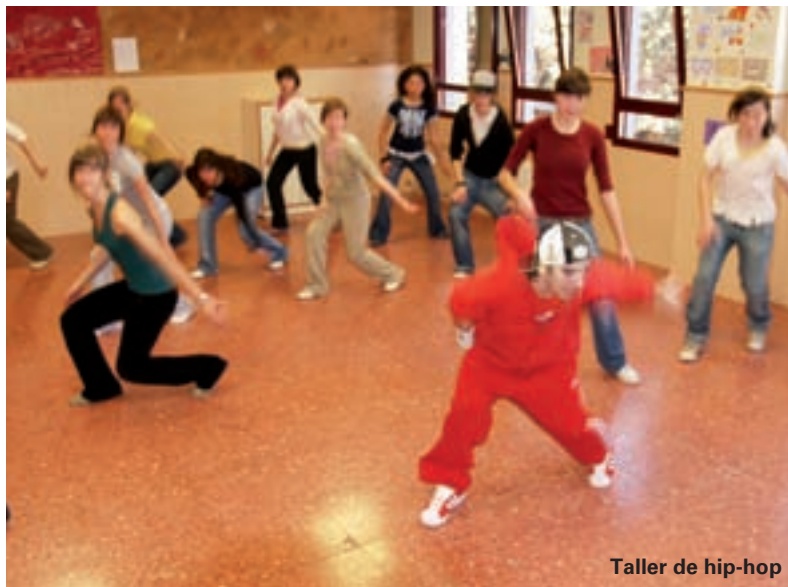
Taller de hip-hop

poblacions que hi formen part d'ella. Aquesta nova Agenda Jove es repartirà entre el jovent de la nostra població i es pot demanar al Centre d'Informació i Gestió de l'Ajuntament de Picanya.