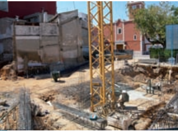
Obres del Centre de Salut

serveix per a enfortir el canell i l'avantbraç. També per a exercitar el gir del canell, hi ha un aparell que disposa d'un disc giratori i d'una hèlix. L'última és un gran roda, serveix per a exercitar el gir dels braços i millorar les articulacions dels múscles. Per tal d'exercitar les cames, també s'hi ha instal·lat un banc amb pedals amb capacitat per a dues persones.