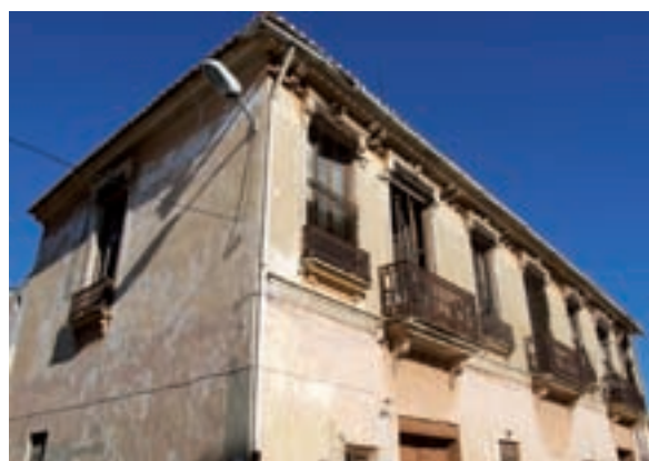
La "Casa Emiliot" serà rehabilitada

A més, en relació al curs 2006/2007 són destacables dades com que quasi el 100% de l'alumnat de primària ha promocionat a secundària, cosa que ens parla ben a les clares del bon nivell acadèmic de les nostres escoles.