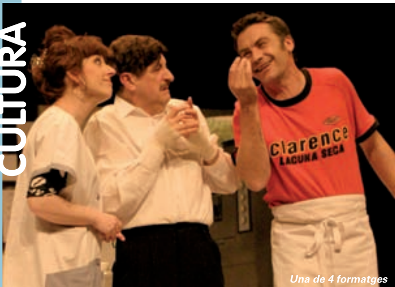
Una de 4 formatges