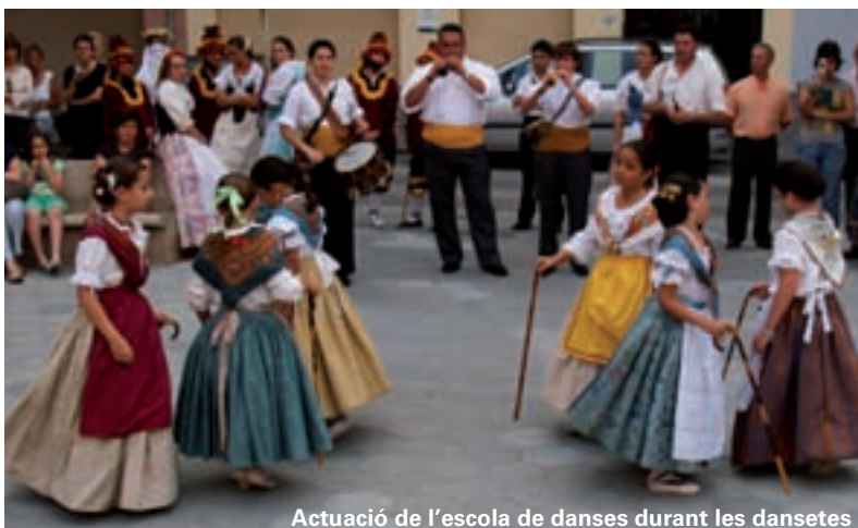
Actuació de l'escola de danses durant les dansetes

Una altra proposta és el taller de sevillanes, que començarà el proper 20 d'octubre. L'objectiu és conèixer els moviments essencials que conformen cadascuna de les parts d'aquest ball. I per finalitzar, el més actual dels balls: el hip hop. Aquest taller mostrarà els moviments d'aquest ritme nascut als carrers de les grans ciutats dels Estats Units i que ha esdevingut en un autèntic estil de vida. Tres tallers per a joves que ja estan en marxa amb una gran acollida.