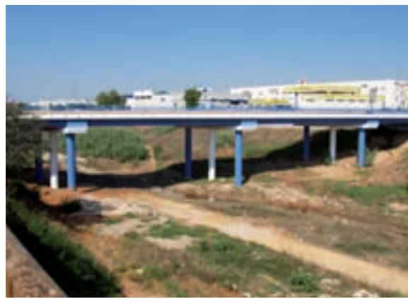
Nova pintura per al pont

Una vegada finalitzen les obres, Picanya disposarà d'un modern Centre de Salut de vora mil metres quadrats, dotat de nou consultes de medicina general, de tres de pediatria, de quatre sales d'infermeria, i d'una sala d'extraccions. A més a més, hi haurà una consulta i un gimnàs per al treball de la matrona.