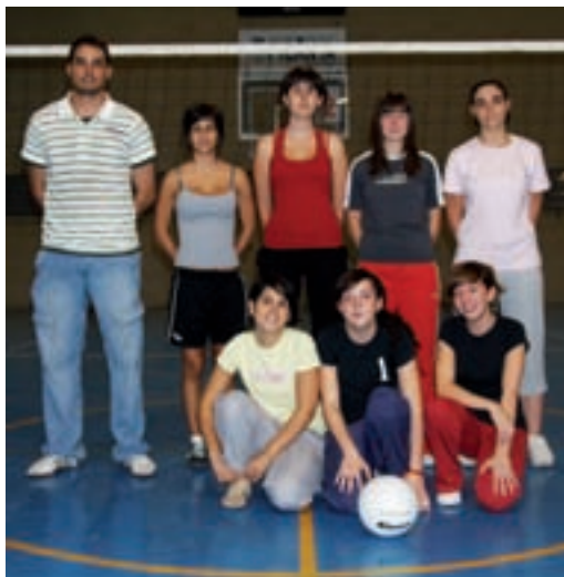
Equip de voleibol de l'IES Enric Valor

Al llarg de tot l'any, el Pavelló Esportiu Municipal acull els partits d'aquesta competició, que es caracteritzen per un ambient d'esportivitat.