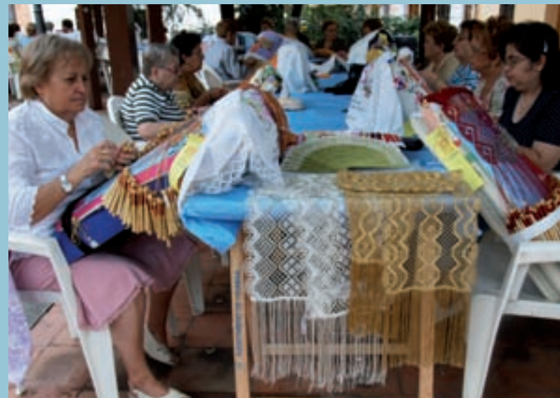
Boixeteres a la plaça Major

El Centre té previst enguany la matriculació de més de 500 alumnes entre cursos i tallers. Una xifra que situa l'EPA de Picanya entre les de major nombre d'alumnes a la nostra comarca.