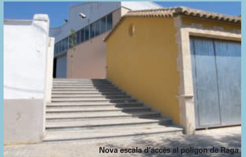
Nova escala d'accés al polígon de Raga

Amb aquestes dues intervencions es continua el procés de restauració i pintura dels tres ponts i dues passarel·les que creuen el barranc en un procés que, a més de les qüestions de manteniment, ha valorat l'embelliment d'aquestes infraestructures com a una forma de millora de l'entorn i on l'habitual gris-formigó ha donat pas a tot un ventall de colors.