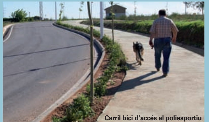
Carril bici d'accés al poliesportiu

L'Ajuntament de Picanya ha expropiat una casa al carrer Almassereta per a millorar l'accés de les persones al Polígon de Raga. Als terrenys que ara ocupa aquesta casa s'ha construït una escala que connecta els carrers Almassereta i Azorín. D'aquesta manera, s'obri l'accés directe des de la passarel·la que hi ha darrere del Mercat Municipal fins al polígon. Això facilitarà l'accés al seu lloc de treball a tots aquells veïns de Picanya que hi treballen al Polígon de Raga amb un especial aprofitament per a les dones que treballen als magatzems de taronja cosa que suposarà una important millora en el seu anar i tornar diari.