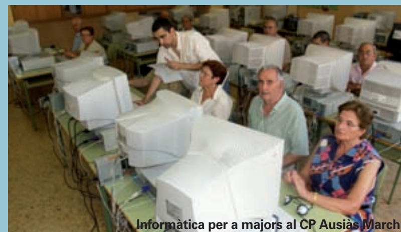
Informàtica per a majors al CP Ausiàs March