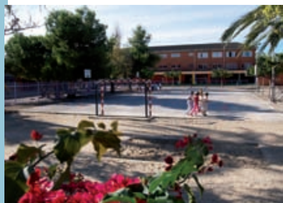
Torna l'activitat a les escoles

Els dies 16 i 23 d'octubre el departament de Serveis Socials de l'Ajuntament amb la col·laboració de l'IES Enric Valor i l'AMPA del mateix centre organitzen un curs destinat a pares i a mares en el qual s'abordarà el tema de dues noves adiccions socials de la màxima actualitat: els videojocs i l'ús excessiu d'internet. Dues patologies amb especial incidència sobre la població jove i que suposen un autèntic rept per a pares i mares a l'hora de previndre un ús excessiu. Aquest curs, que serà impartit a l'IES Enric Valor en horari de 18.00 a 21.00h permetrà a pares i mares comprendre el sentit del joc en edats infantil-juvenil, identificar les versemblances i diferències entre l'abús dels videojocs i les ludopaties i proposar estratègies educatives familiars de control en l'ús de les noves tecnologies.