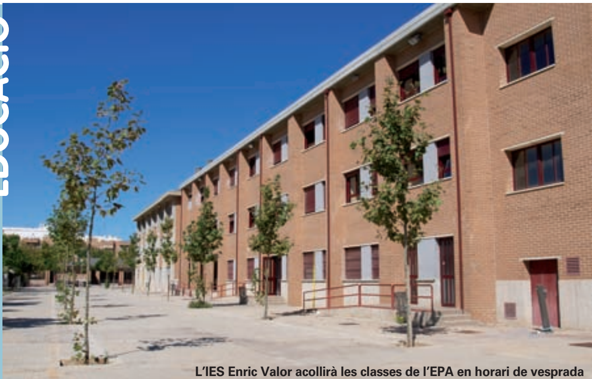
L'IES Enric Valor acollirà les classes de l'EPA en horari de vesprada