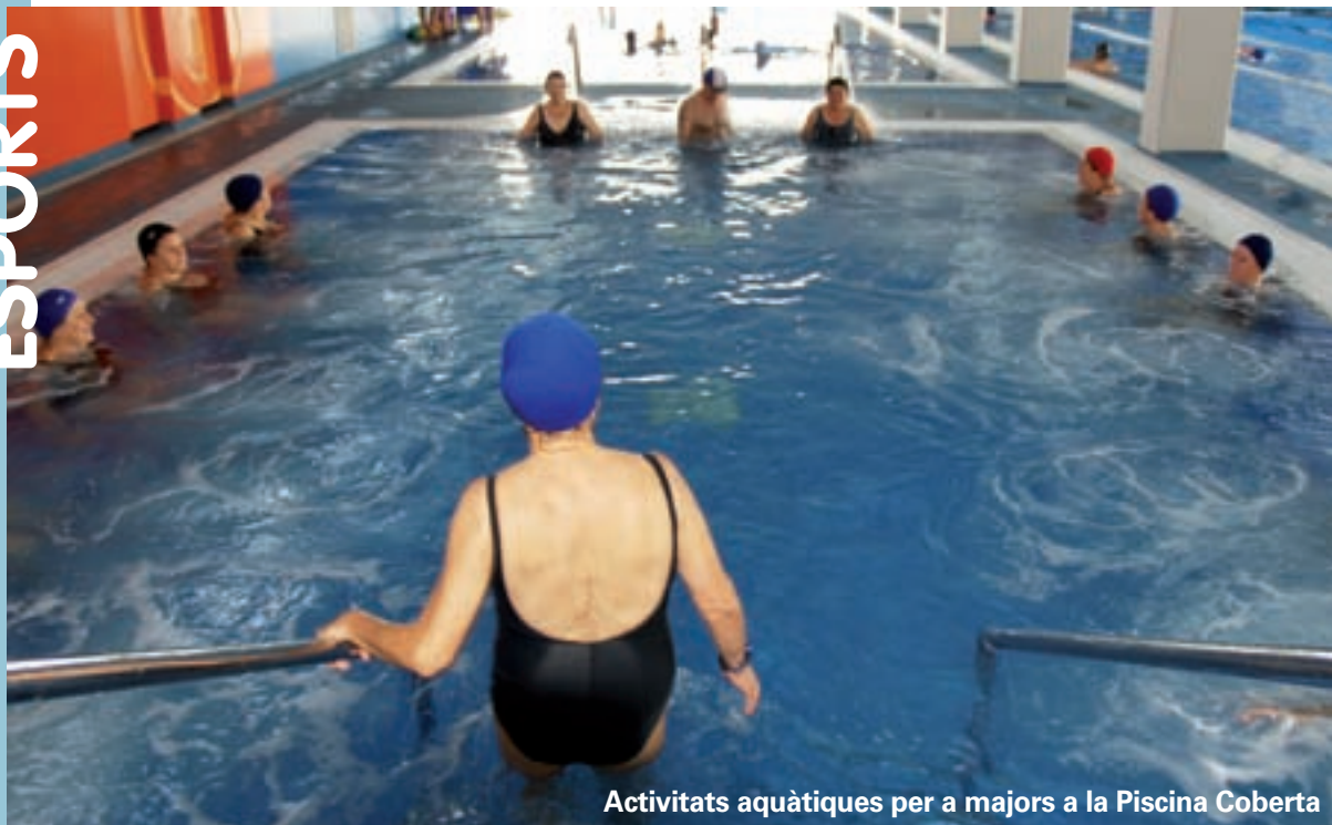
Activitats aquàtiques per a majors a la Piscina Coberta