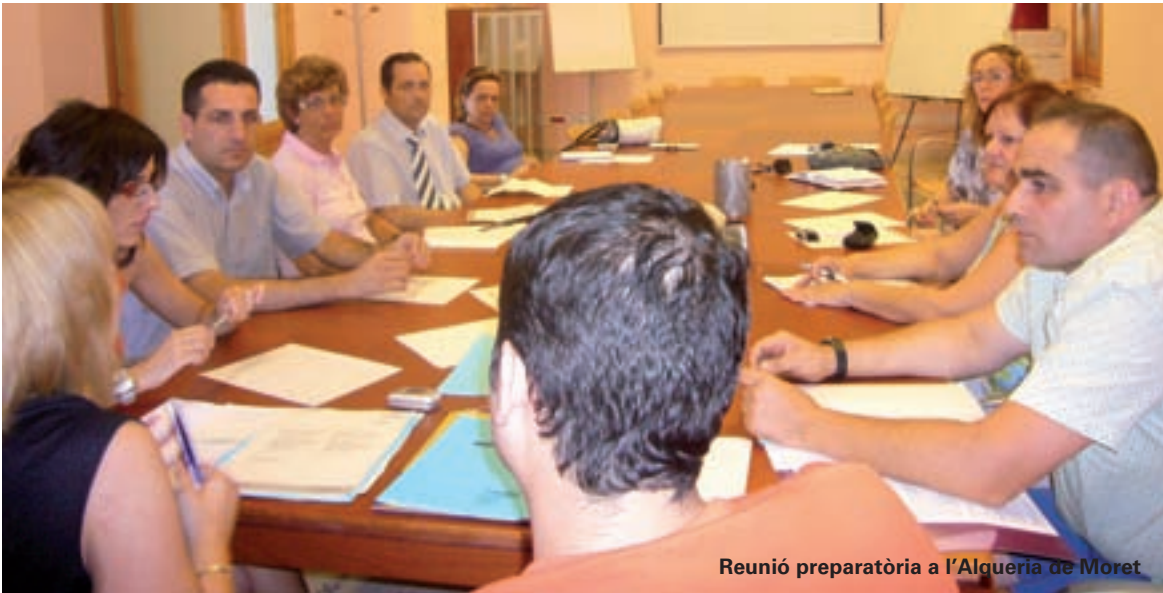
Reunió preparatòria a l'Alqueria de Moret