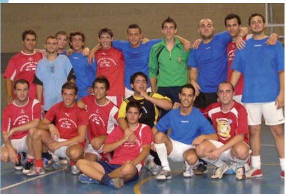
Transportes CS i Drink Team finalistes