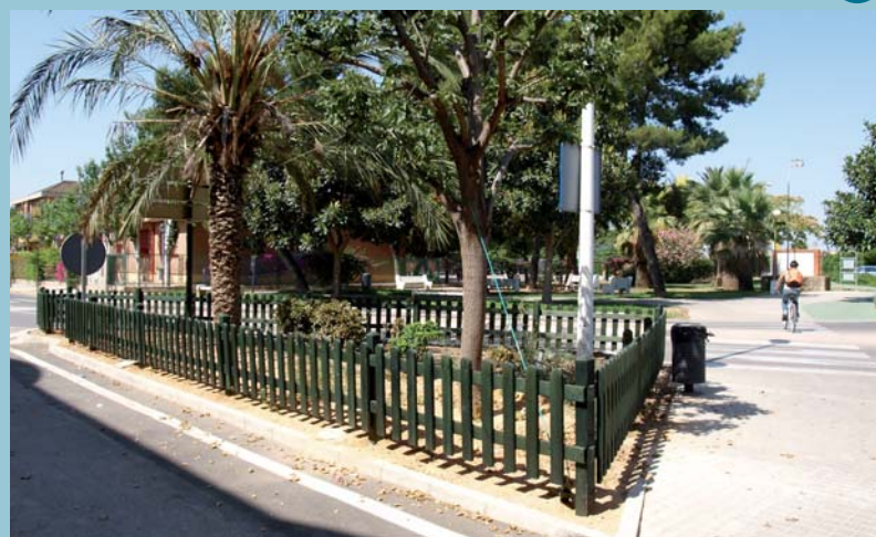
Noves tanques de fusta

Tota aquesta nova zona enjardinada, en la línia dels jardins del poble, ha estat dotada amb un sistema de reg per degoteig, per tal d'aprofitar al màxim els recursos hídrics.