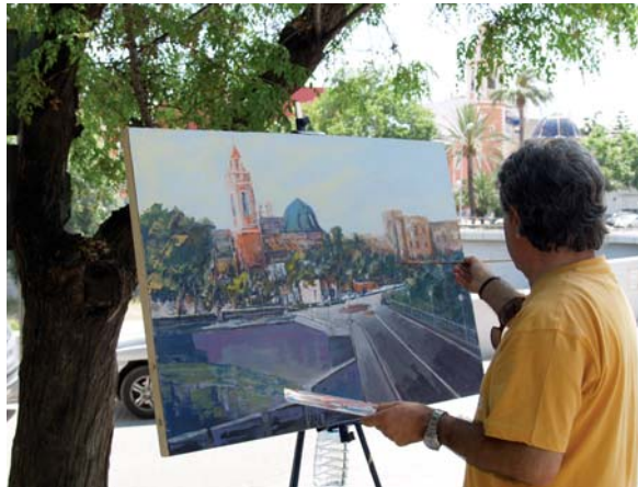
Concurs de pintura ràpida

Visites, cinema, xerrades, teatre... han completat un ampli ventall d'activitats