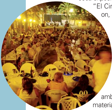
amb materials audiovisuals,

El 30 de juny arranquen dues setmanes de festa per als veïns i les veïnes de Picanya. Comencen les festes de La Sang, les festes grans del poble. Eixe dia s'inaugura la Fira medieval del oficis, una autèntic mercat medieval que estarà a la plaça Major i a l'Haima instal·lada a la Plaça del País Valencià. En aquest xicotet tros de l'Edat Mitjana, podrem veure demostracions d'oficis artesanals i gaudir d'animació de carrer. La fira obrirà els caps de setmana de festa fins a ben entrada la nit. També el dia 30, el Gran Fele presenta la seua exposició "El Circ" on,