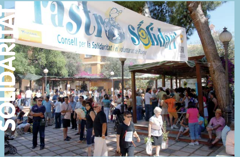
Rastro Solidari 2007