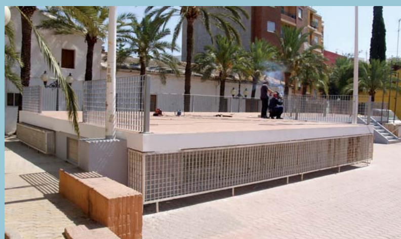
Treballs a l'escenari de la Plaça

L'Ajuntament està col·locant tanques de fusta en alguns parc i jardins de la localitat. Es tracta de protegir aquelles zones verdes que per la seua ubicació o per les varietats plantades, necessiten una major protecció. Aquestes tanques són de fusta, per tal que s'integren plenament amb les zones que han de protegir. La fusta de les tanques ha estat tractada perquè pugui resistir millor les condicions atmosfèriques.