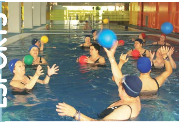
Majors a la Piscina Coberta