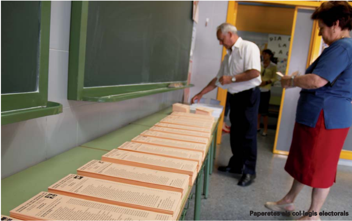
Paperetes als col·legis electorals