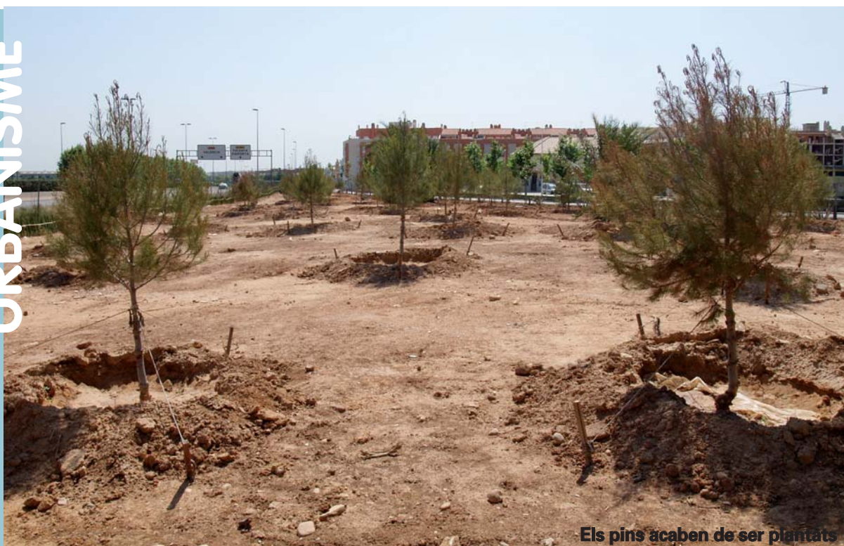
Els pins acaben de ser plantats