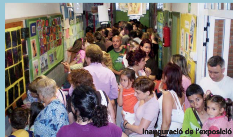
Inauguració de l'exposició

El cor Mil·lènim del CP Baladre de Picanya porta ja sis anys de trajectòria i enguany, en el seu concert de primavera, ha abordat una nova experiència, la de fer una cantata , la qual combina la narració amb la música. Aquesta cantata tracta d'una rebel·lió molt particular: la dels atifells de cuina que ja estan farts de cuinar per a uns xiquets que no mengen res. L'obra està pensada per a ser narrada per actors i està escrita amb un llenguatge ple de sentit de l'humor però alhora amb un argument molt entenedor per a totes les edats. L'orquestra de cuina va estar a càrrec dels coralistes mateix acompanyats d'un pianista professional. Amb aquesta experiència el cor ha superat un nou repte cantant i tocant en directe, a més de cantar a dues veus. Tot un èxit!