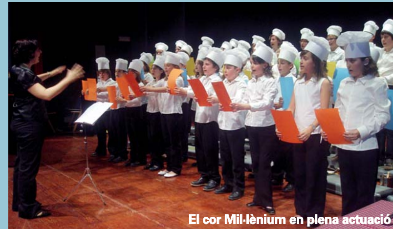
El cor Mil·lènim en plena actuació