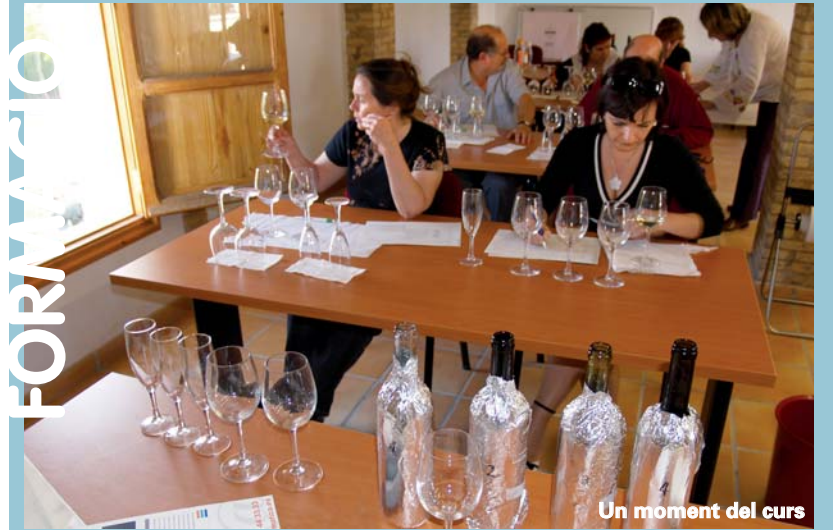
Un moment del curs