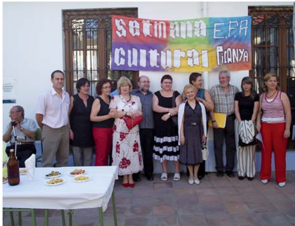
Acte de lliurament dels premis de poesia