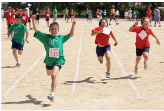
Jocs d'atletisme en la Setmana Esportiva

El club es planteja per a la propera temporada recuperar els seus jugadors cedits a altres clubs per formar un equip potent i competitiu que pugui optar als màxims objectius.