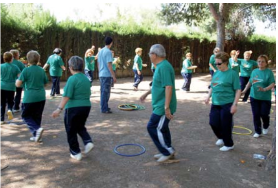
Majors al poliesportiu