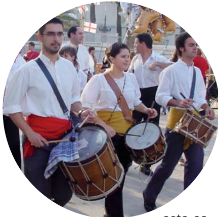
El dilluns es realitzarà la "coetà", a la zona acotada i protegida de la plaça del País Valencià. Eixe mateix dia, se celebra un altre acte tradicional i molt arrelat al poble, la "passà" del quadret. El 10 de juliol, un dels grups més premiats del passat any actuarà a Picanya. Es tracta de Nena Daconte, grup de pop que ha aconseguit convertir-se només amb un disc en una de les grans promeses de la música al nostre país. Una vegada finalitze el concert, la plaça Major es convertirà en una

Municipal de Danses de Picanya, el grup de Danses Carrasca i el grup de Danses Realenc. A més a més, enguany actuarà un nombrós grup de folklore vingut de Romania. Es tracta del grup Maria Tanase, arribat des de Craiova. Aquest grup actuarà convidat pel grup Realenc, que tornarà la visita a Romania en les primeres setmanes d'agost.