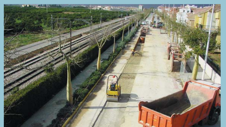
Millores en la xarxa de clavegueram pal·liaran els efectes de les fortes pluges que, de vegades, sobten el nostre poble.