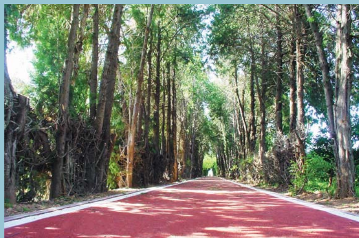
La xarxa de carril bici s'ha ampliat amb nous trams que conviden al passeig i l'esbargiment.