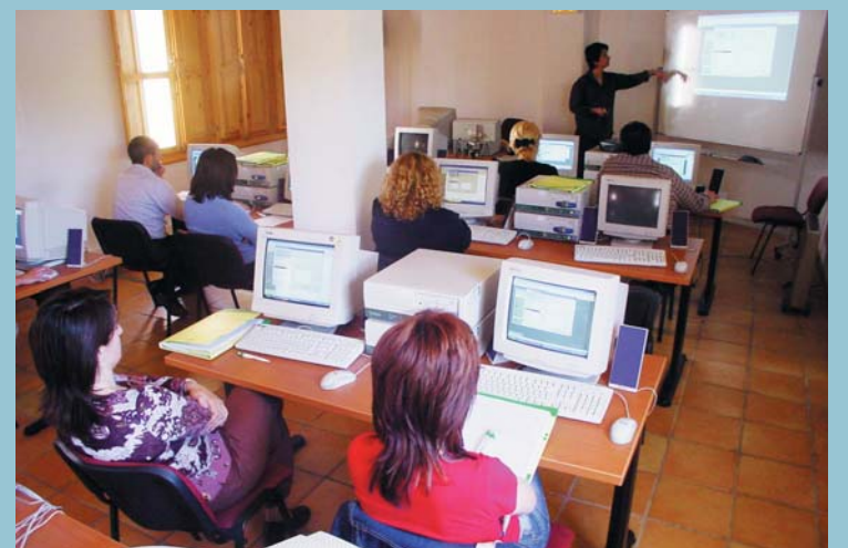
La formació en noves tecnologies: una important aposta de futur. Durant 2005 han augmentat les possibilitats.