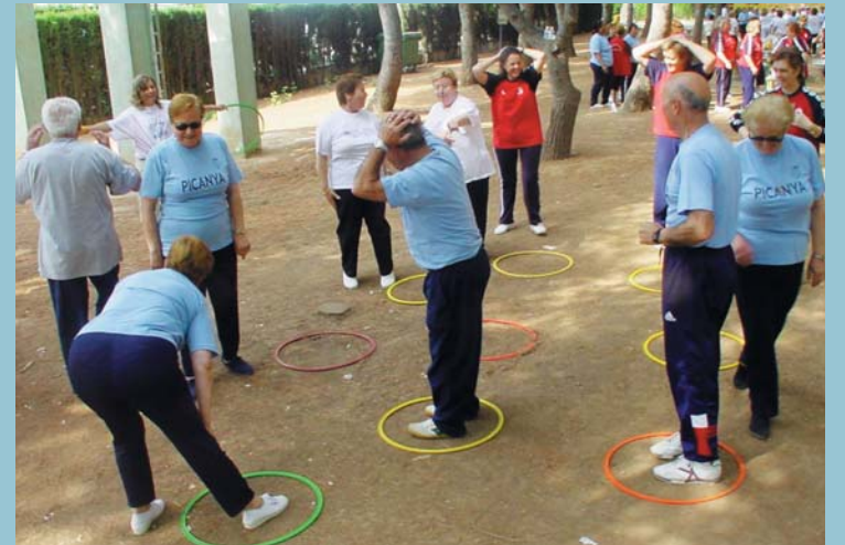
Les persones majors són objecte de contínua atenció: esport, activitats d'oci i culturals, teleassistència...