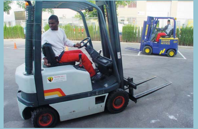
La formació professional per a joves continua sent uns dels eixos fonamentals en la lluita contra l'atur

S'ha continuat treballant en l'àmbit de l'educació a les escoles, junt als pares, les mares i escolars. Al Centre de Salut s'han organitzat cursos d'estimulació primerenca i preparació al part. Continua el treball amb el Consell de Xiquets i Xiquetes del poble de Picanya.