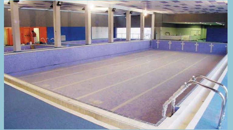
La piscina coberta se suma al poliesportiu i al pavelló, i amplia l'oferta d'instal·lacions esportives municipals.