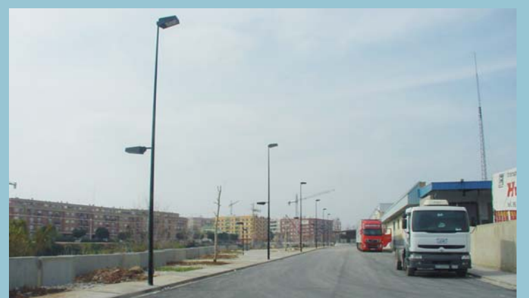
Renovació de l'asfalt, il·luminàries, plantació d'arbres... en la reforma del polígon de Raga.