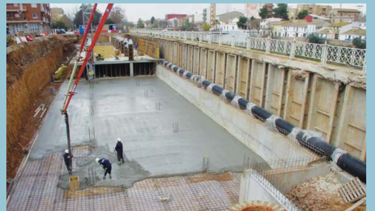
L'aparcament subterrani millorarà la mobilitat als nostres carrers amb la reducció de vehicles en superfície.