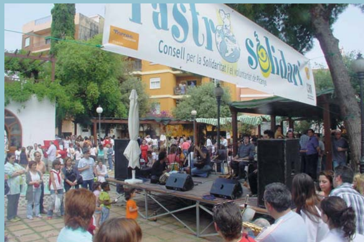
Picanya tornà a demostrar la seua preocupació pels menys afavorits. El Rastro Solidari va recaptar més de 15.000 euros.