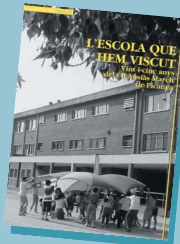
Noves publicacions de llibres. Durant 2006 s'ha continuat el procés d'ampliació dels estudis sobre la nostra realitat més propera.