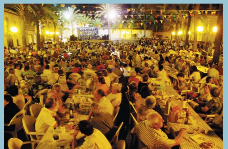
Les Festes Majors han tornat a ser punt de trobada i de participació per a tot el poble.

Quant a trànsit rodat, el nombre d'accidents a estat molt semblant al de l'any 2004, cosa que, donat l'augment en el nombre de vehicles als nostres carrers any rere any (cada any es matriculen més vehicles), pot interpretar-se com una xifra millor a la d'anys anterior, però sobre la qual caldrà continuar treballant i intentar millorar-la.