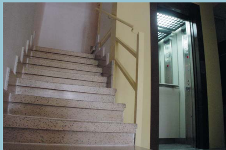
El programa de suport a la instal·lació d'ascensors ha continuat donant fruits durant 2005.

selectiva de residuos urbanos, la ampliación de las zonas verdes y del carril-bici o el fomento de hábitos saludables, por ejemplo. Las políticas de medio ambiente deben ir integradas a los programas sociales si queremos hacer un pueblo de mayor calidad para todas las personas.