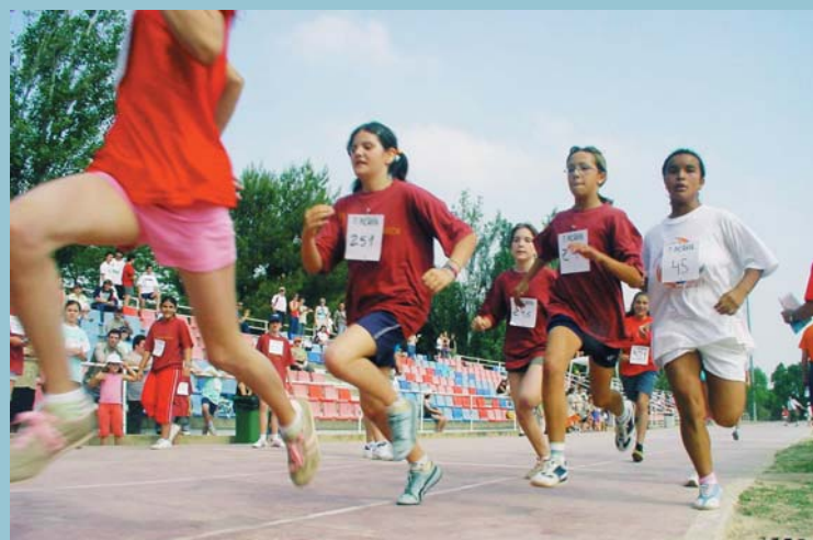
L'ampli programa esportiu ha mantés el seu interès per arribar a totes les edats i interessos.