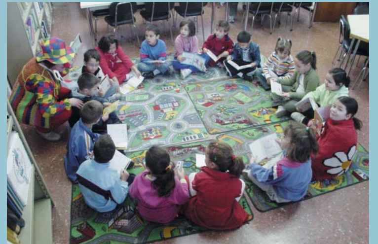
Campanyes com l'animació lectora, l'hora del conte, anem al teatre... tracten d'acostar a menuts i menudes al món de la cultura