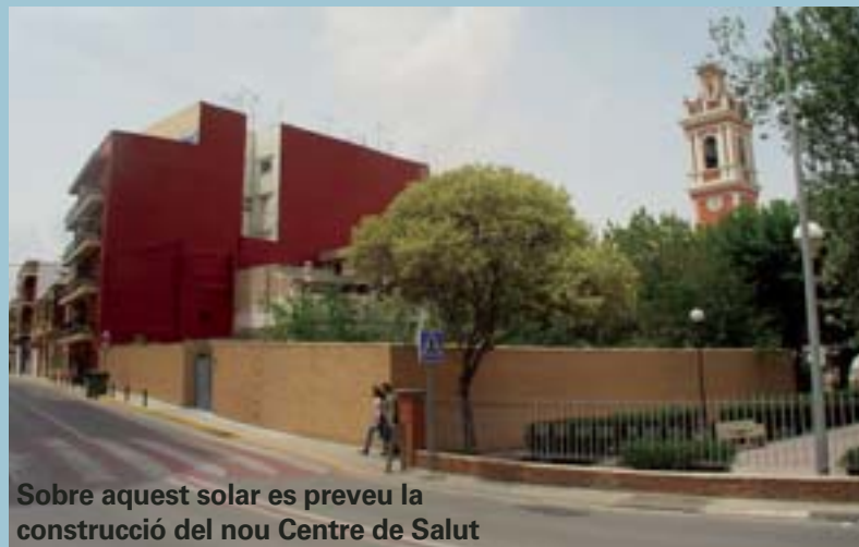
Sobre aquest solar es preveu la construcció del nou Centre de Salut

Para ampliar información y obtener asesoramiento sobre todos estos temas el Ayuntamiento de Picanya dispone del Servei Municipal d'Habitatge cuya oficina se sitúa junto al número 7 de la pl. Espanya (tel. 961 594 460).