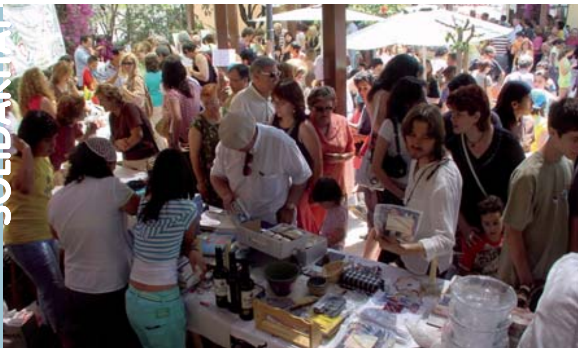
Paradetes del Rastro a ple rendiment