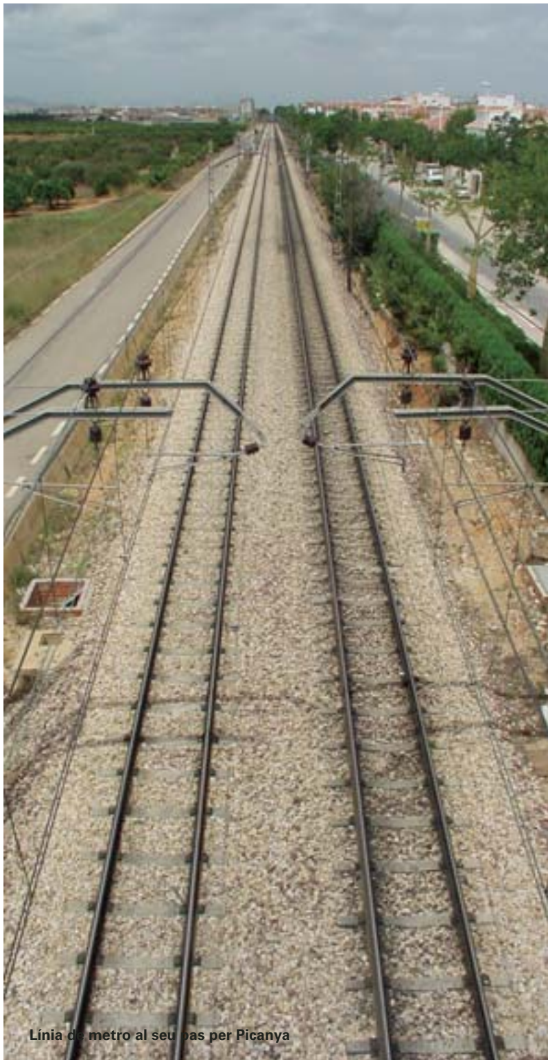
Línia de metro al seu pas per Picanya

El plenari de l'Ajuntament de Picanya va aprovar el passat 27 d'abril una moció per a demanar a la Conselleria d'Infraestructures i Transports el soterrament de les vies del Metro al seu pas per Picanya. Aquesta moció va ser aprovada per unanimitat i signada pels portaveus dels dos partits representats al plenari. La moció fonamenta aquesta sol·licitud en la possibilitat d'expansió del nucli urbà de la població cap al sud, expansió que ara mateix és impossible per l'existència de les vies del Metro i la barrera física que representen.