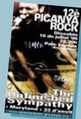
33 d'envit formen part del cartell del 12è Picanya Rock

Entre els huit grups seleccionats, estan els picanyers "Sardina hidrofòbica". Junt a ells, dos grups de Torrent, "Mar" i "Pau Alabajos i els músics furtius"; dos més de Mislata, "Cretino's Borne" i "Ochorizo"; "Stoke" de