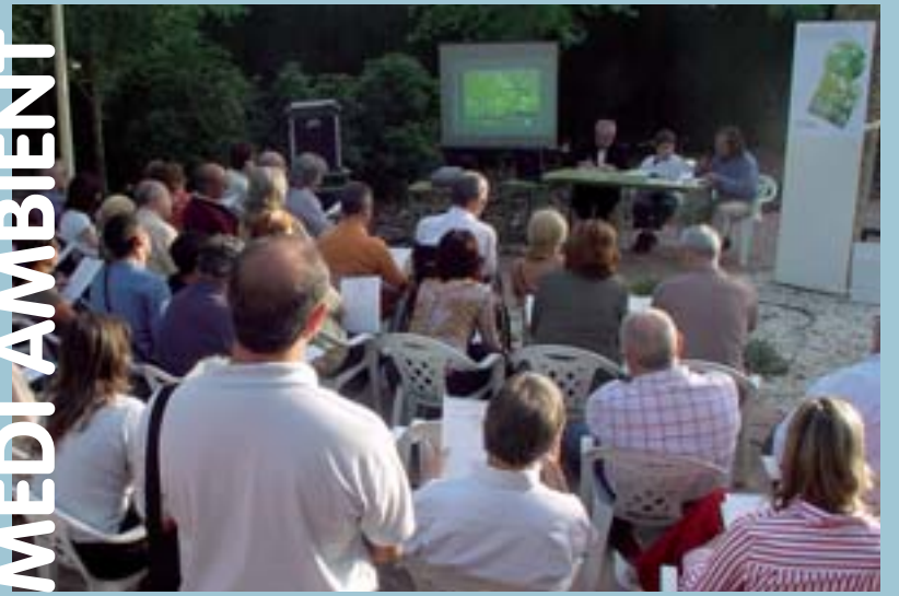
Acte de signatura de la Carta de Barcelona

Dos treballs que estaran acabats al maig de 2007 quan se celebri l'11a convocatòria d'aquests premis la intenció dels quals no és un altra que promoure el coneixement de la nostra realitat més propera.