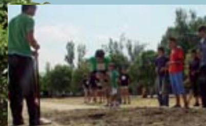
Salt de longitud