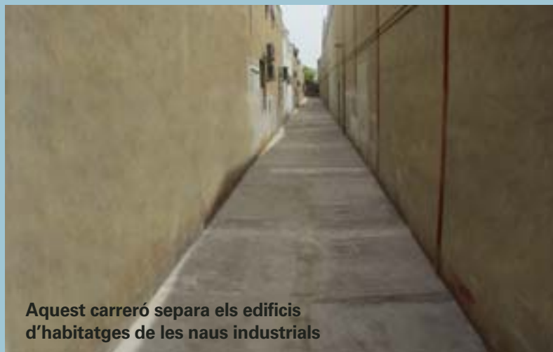
Aquest carreró separa els edificis d'habitatges de les naus industrials

Els terrenys per al nou Centre de Salut van ser cedits per l'Ajuntament de Picanya fa ja alguns anys. Es tracta d'un solar ubicat entre els carrers de l'Església i Senyera. El projecte preliminar preveu la construcció d'un edifici de dues plantes, amb una superfície útil de gairebé mil metres quadrats.