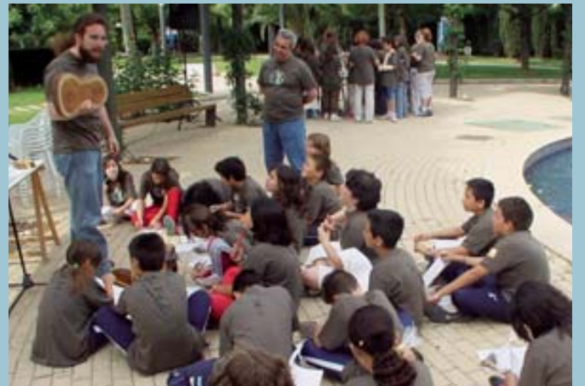
Escolars aprenent a descobrir l'edat dels arbres

D'aquesta manera, l'Ajuntament fa públic el seu compromís de situar l'arbrat com una de les prioritats a l'hora de pensar en qual-sevol desenvolupament urbanístic.