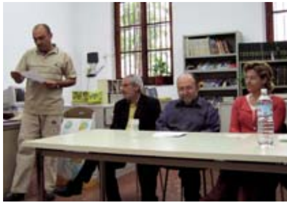
Acte de lliurament de premis

El 25 de juny se celebrà la segona trobada comarcal de boixets organitzada per l'Escola Permanent d'Adults de Picanya. A partir de les 10 del matí, totes les participants a aquesta trobada tingueren com a punt de trobada la Plaça Major, on els esperava l'esmorzar. Després, fou moment de mostrar els seus treballs amb els boixets i d'intercanviar tècniques i experiències amb altres participants. Després del dinar arribà el moment del lliurament d'un obsequi commemoratiu de la seua participació i de l'acomiadament.