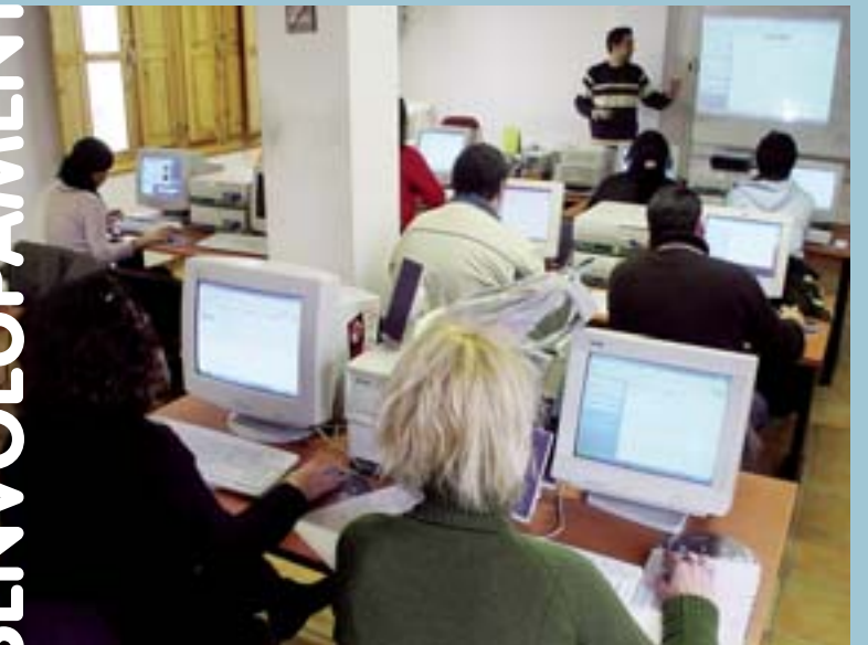
Curs d'informàtica a l'Alqueria de Moret