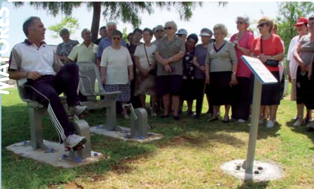
Demostración de uso de los aparatos

projecte de l'ONG "Menuts del Món", d'una escola a Melga (Bolívia), on 800 xiquets i xiquetes reben classe al pati per l'estat ruïnós del centre. El "Rastro" es va completar amb l'actuació del grup de música andina Inti-Nan i la demostració realitzada per l'alumnat dels tallers de patchwork i de boxets de l'EPA.