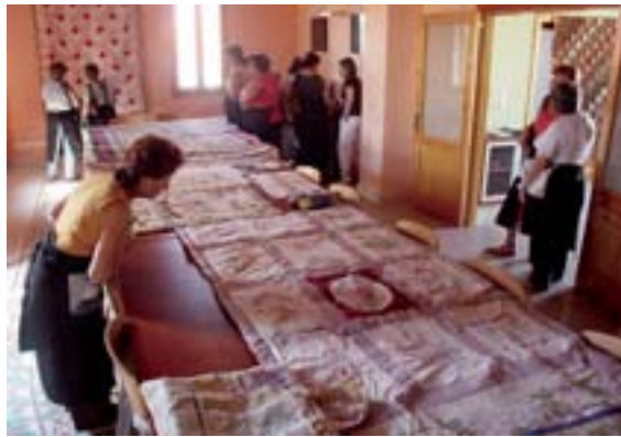
Treballs de patchwork a l'Alqueria de Moret