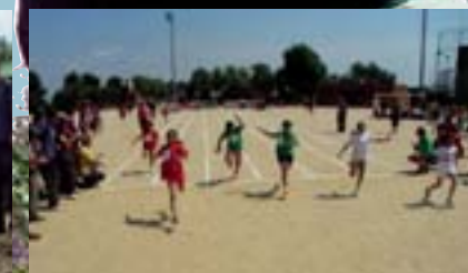
Proves de velocitat