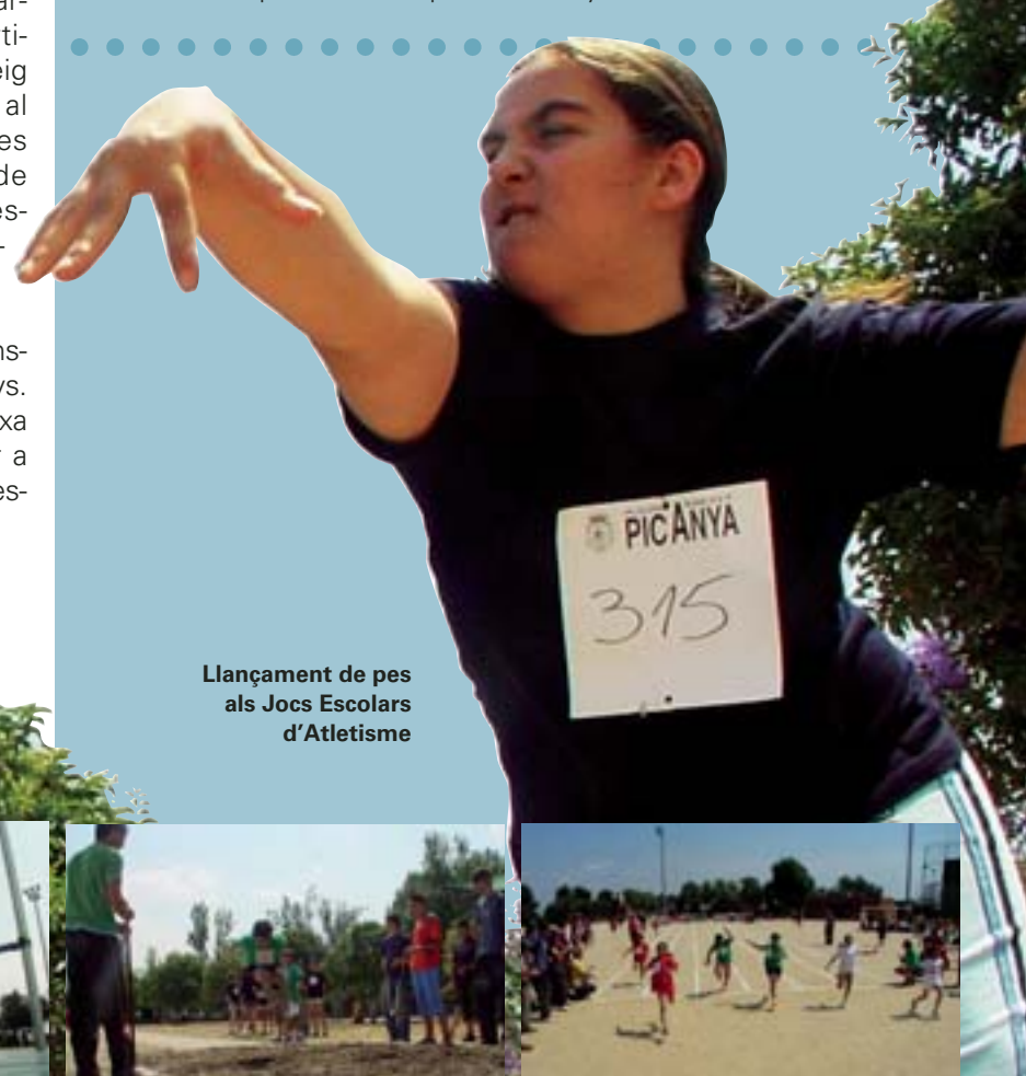
Llançament de pes als Jocs Escolars d'Atletisme