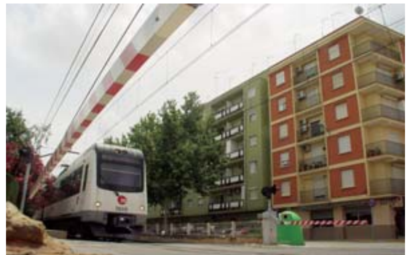
Actual pas a nivell

a la supressió de 121 passos a nivell de Ferrocarrils de la Generalitat Valenciana a la província de València. Aquest pla va començar a executar-se l'any 1996 i, fins ara, ja s'han suprimit 110 passos a