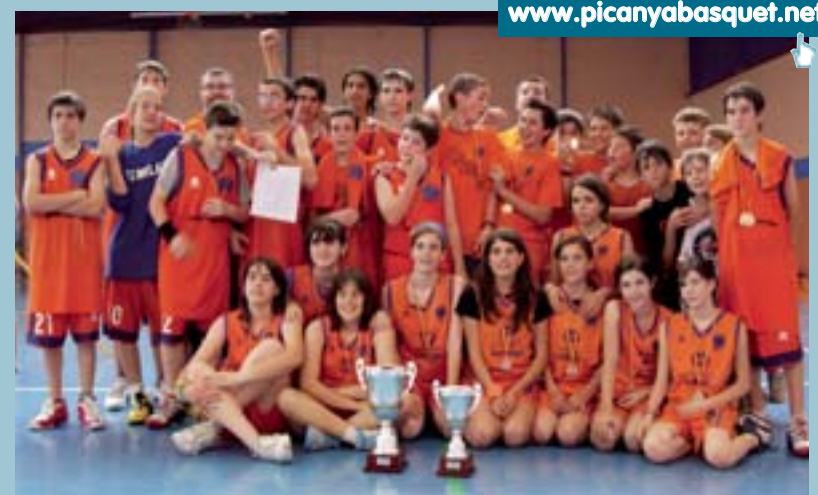
Els equips infantils del club Picanya Bàsquet amb dos dels tres trofeus aconseguits

La idea va començar a gestar-se durant la Setmana Esportiva. Es va organitzar un torneig triangular de futbol femení, al qual van participar 38 xiquetes de les diferents escoles de Picanya. Açò va donar els responsables del Club la resposta: a Picanya sí hi ha xiques que volen jugar a futbol. De moment, al Club ja s'han inscrit 7 xiques d'entre 8 i 12 anys. Per tal de poder posar en marxa l'equip i començar a competir en necessiten dotze.