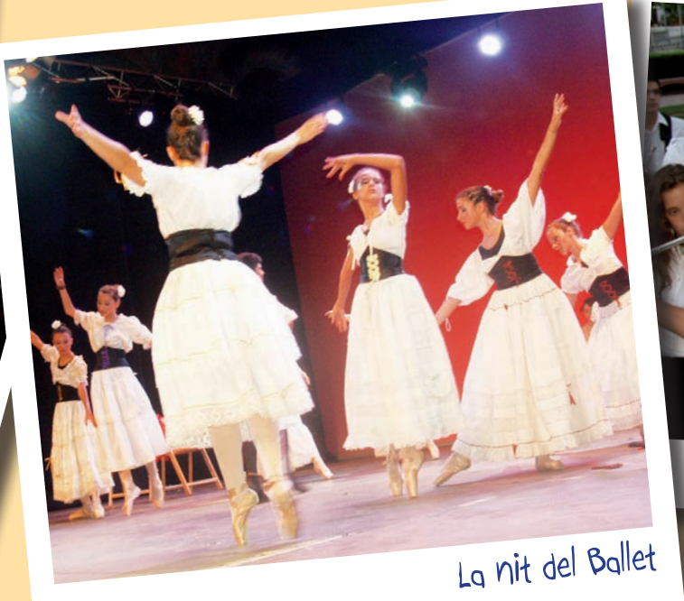
La nit del Ballet