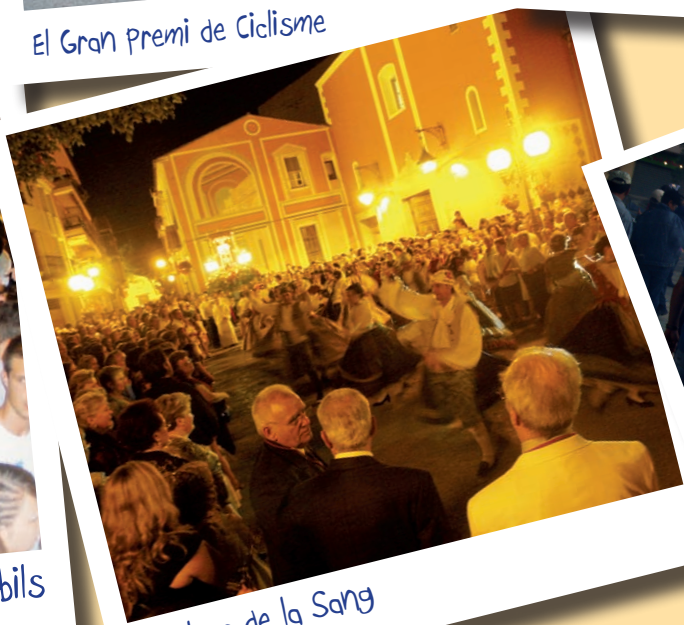
El bolero de la Sang