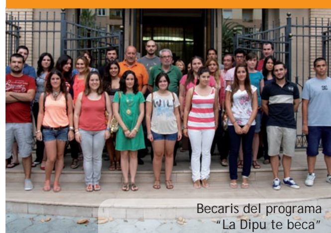
Becaris del programa "La Dipu te beca"