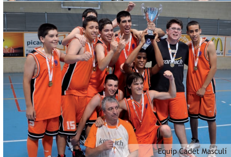
Equip Cadet Masculí