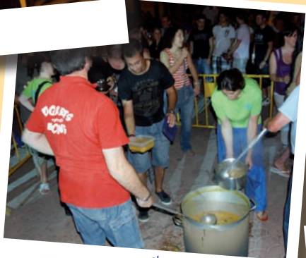
El sopar de les Olletes