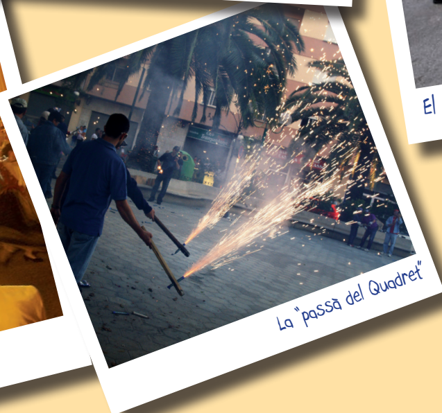
La "passà del Quadret"