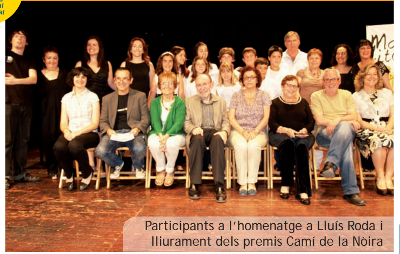
Participants a l'homenatge a Lluís Roda i lliurament dels premis Camí de la Nòria