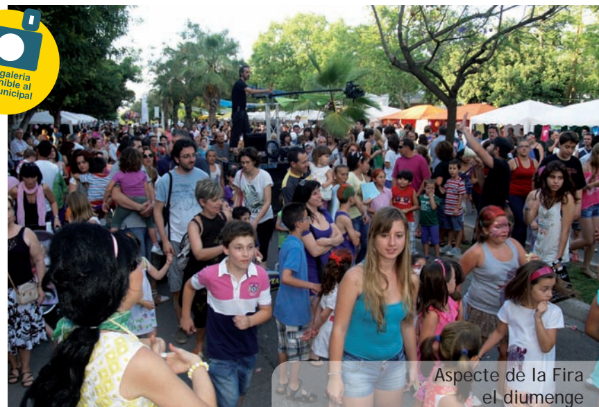
Aspecte de la Fira el diumenge