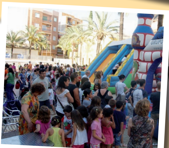
Els Jocs Infantils

23.00h ORQUESTRA VOCAL FACTORY a la Pl. País Valencià