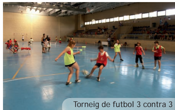
Torneig de futbol 3 contra 3

Finalment els xics de l'equip aleví masculí van completar aquest espectacular trio de títols amb un molt meritori subcampionat a la competició de Copa on sols van cedir a la final davant la superioritat física incontestable de l'equip rival.