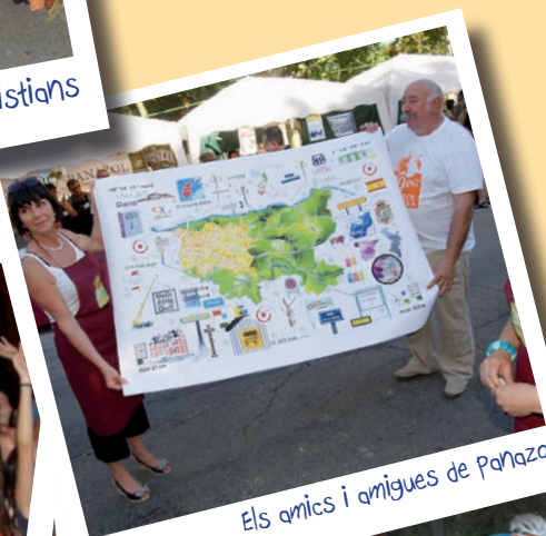
Els amics i amigues de Panazol