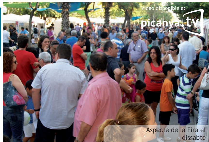
Aspecte de la Fira el dissabte

La 5a edició es tanca amb un gran èxit de públic