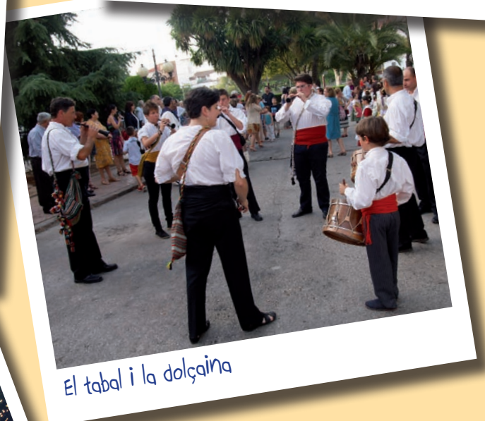
El tabal i la dolçaina