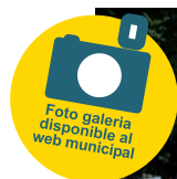
Foto galeria disponible al web municipal

En las últimas semanas la Policía Local, en colaboración con los colegios Baladre y Ausiàs March ha desarrollado un nuevo programa de educación vial. Estas clases se han dividido en dos partes. En una primera fase los policías han explicado nociones básicas sobre circulación en las vías públicas tanto desde la perspectiva de peatón como la de ciclista, patinador, etc... en una segunda fase estos conocimientos se han puesto en práctica con circuitos cerrados en los patios de los colegios donde ciclistas y peatones han compartido recorridos y donde había que interpretar señales, resolver cruces, etc... y también en salidas en bicicleta por el núcleo urbano en los que, acompañados por la Policía Local, se ha podido aplicar todos estos conocimientos. El objetivo final de esta actividad no es otro que mejorar la seguridad de nuestros menores en las calles.