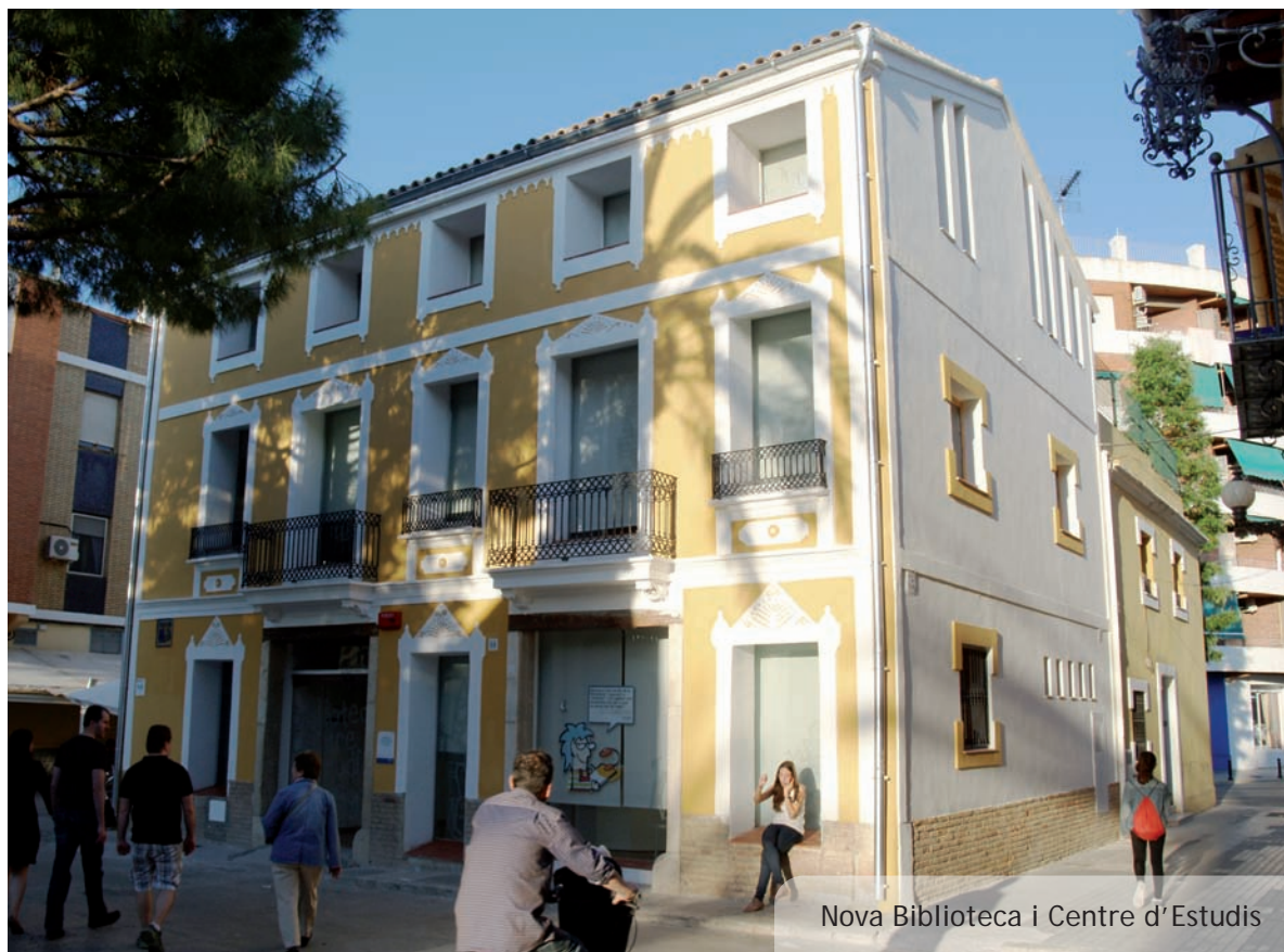
Nova Biblioteca i Centre d'Estudis