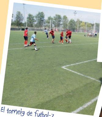
El torneig de futbol-7