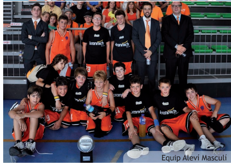
Equip Aleví Masculí