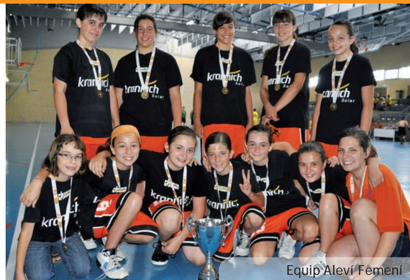
Equip Aleví Femení