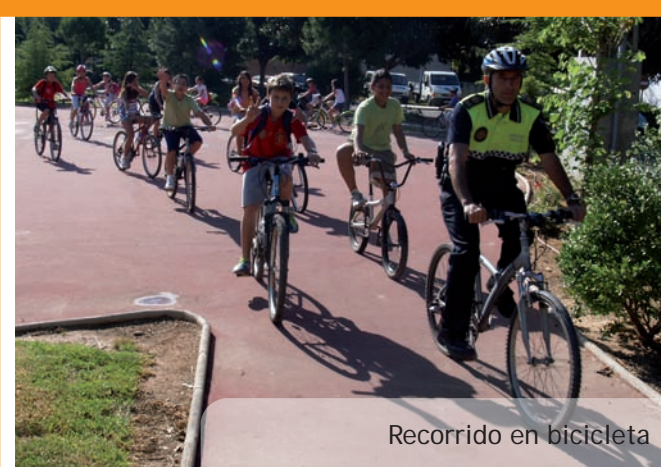
Recorrido en bicicleta