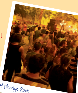
El picanya Rock

Torneig de Vídeo Jocs (Fifa, PES, Dragon Ball, Mario Kart, Guitar Hero, CoD, Naruto Generation...) al Pavelló Esportiu Vicent Martí "Galán"