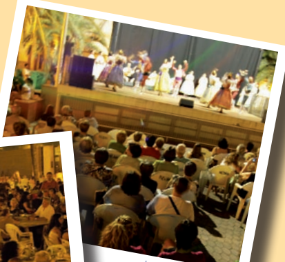
La nit del Folklore

20.00h "PASSÀ DEL QUADRET" de la Preciosíssima Sang Eixida des de la Plaça de l'Ajuntament 22.30h "DES DE SÍLFIDES A MADONNA" Espectacle de Ballet Clàssic i Ball Modern per l'Associació de Ballet de Picanya a la plaça País Valencià (Aquesta nit no hi ha sopar. Es posaran cadires per veure l'espectacle). 00.45h a 1.30h COETÀ al coetòdrom. Av. 9 d'Octubre, darrere Parc Albíziez