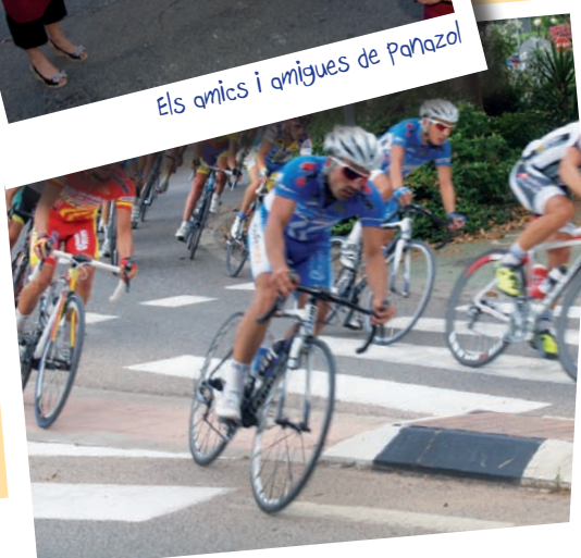
El Gran Premi de Ciclisme