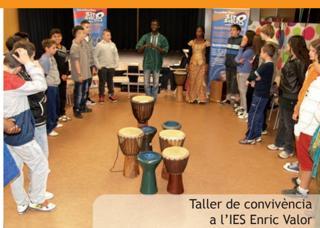
Taller de convivència a l'IES Enric Valor

Com en anys anteriors i dins el programa "La Dipu te beca" seran 36 estudiants de Cicles Formatius de Formació Professional o Ensenyaments universitaris oficials de Grau, Diplomatura o Llicenciatura o Màster oficial impartit per les Universitats els que, en les mesos de juliol i agost realitzaran pràctiques formatives remunerades a l'Ajuntament de Picanya. Aquest programa permet als joves un primer contacte amb el món laboral i adquirir una important experiència en àmbits com ara la informàtica, l'administració, la gestió cultural, urbanística o qualsevol de les altres àrees de treball que formen part del dia a dia de l'Ajuntament. Cada alumne disposa d'un tutor o tutora de les pràctiques que dirigix el treball a realitzar per l'alumne en les quatre setmanes de pràctiques.