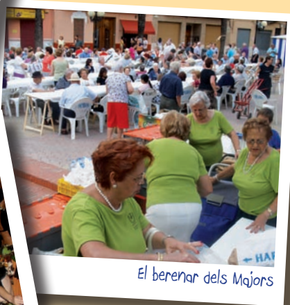
El berenar dels Majors