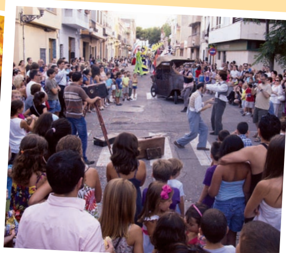
Mostra de Teatre i Música de Cercavila