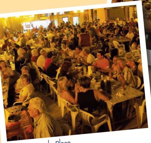
Els sopars a la plaça