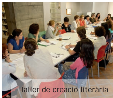
Taller de creació literària