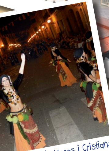
Els Moros i Cristians