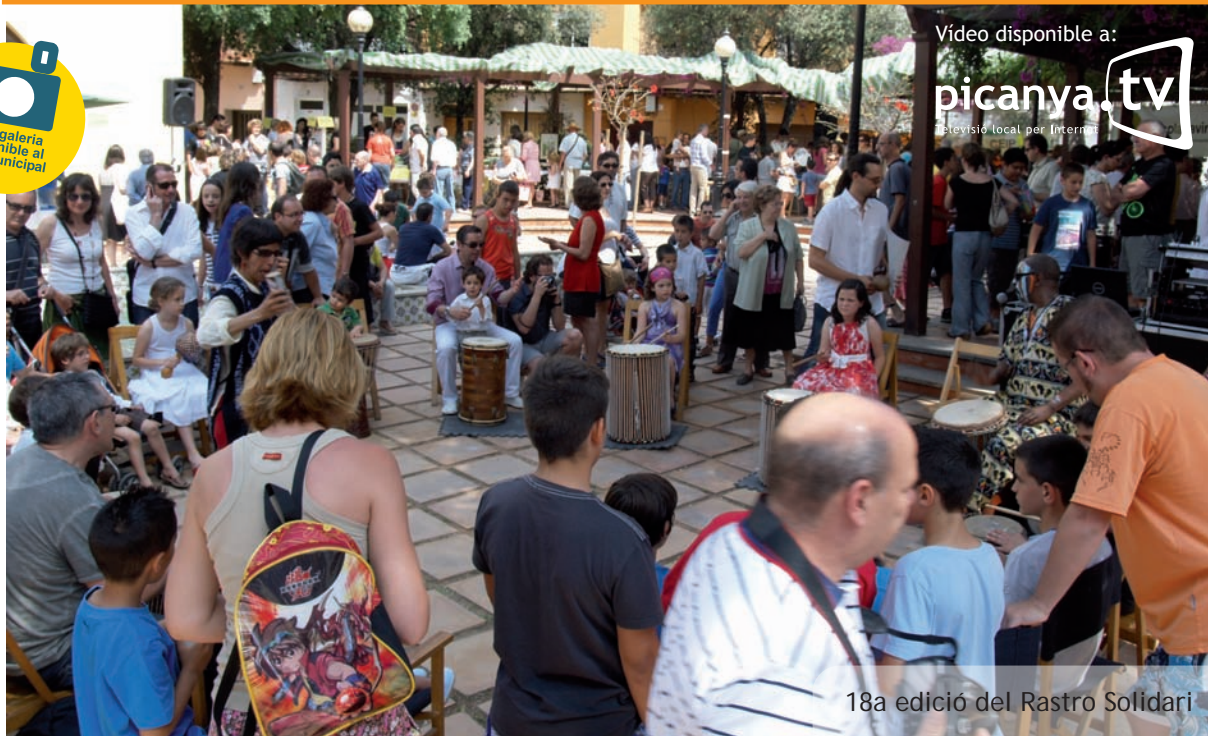
18a edició del Rastro Solidari