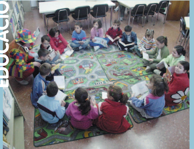
Hora del conte