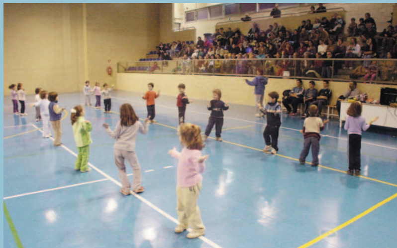
Xiqui-ritme al pavelló municipal

La tretzena edició de la Quarta i Mitja Marató Paiporta-Picanya té lloc el diumenge 18 de desembre amb eixida i arribada al Poliesportiu de la població veïna. Com cada any són més de 2.000 els corredors i corredores que prenen l'eixida per a recórrer un circuit de 10 kilòmetres i mig al que s'ha de donar una volta en cas de la quarta i dues si es participa en la mitja maratón.