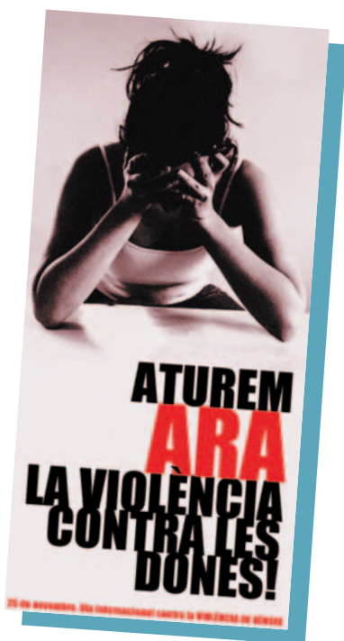
Fullet de la campanya

Des de l'Ajuntament de Picanya ja fa temps que es treballa per l'eradicació d'aquesta barbàrie (programes d'assessorament jurídic gra-