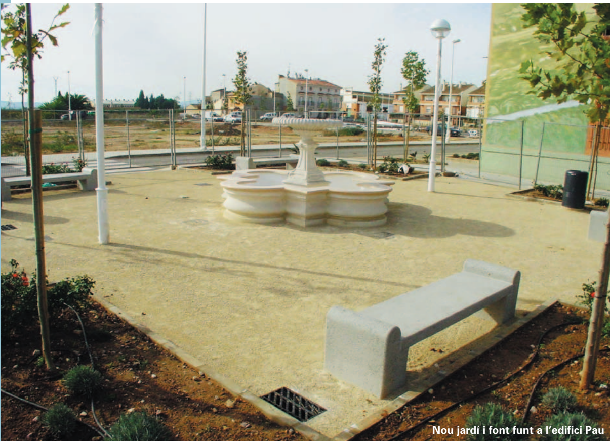
Nou jardí i font funt a l'edifici Pau

Una vegada finalitzen aquestes obres, tota la zona est de Picanya disposarà d'una xarxa de clavegueram amb capacitat per a absorbir unes pluges de fins a 110 l/m 2 a l'hora. Aquestes canonades de major capacitat s'instal·laran de manera progressiva en altres zones del poble, per tal de pal·liar en la mesura del possible així l'acumulació d'aigua en cas de pluges torrencials tan habituals i imprevisibles a les nostres terres.