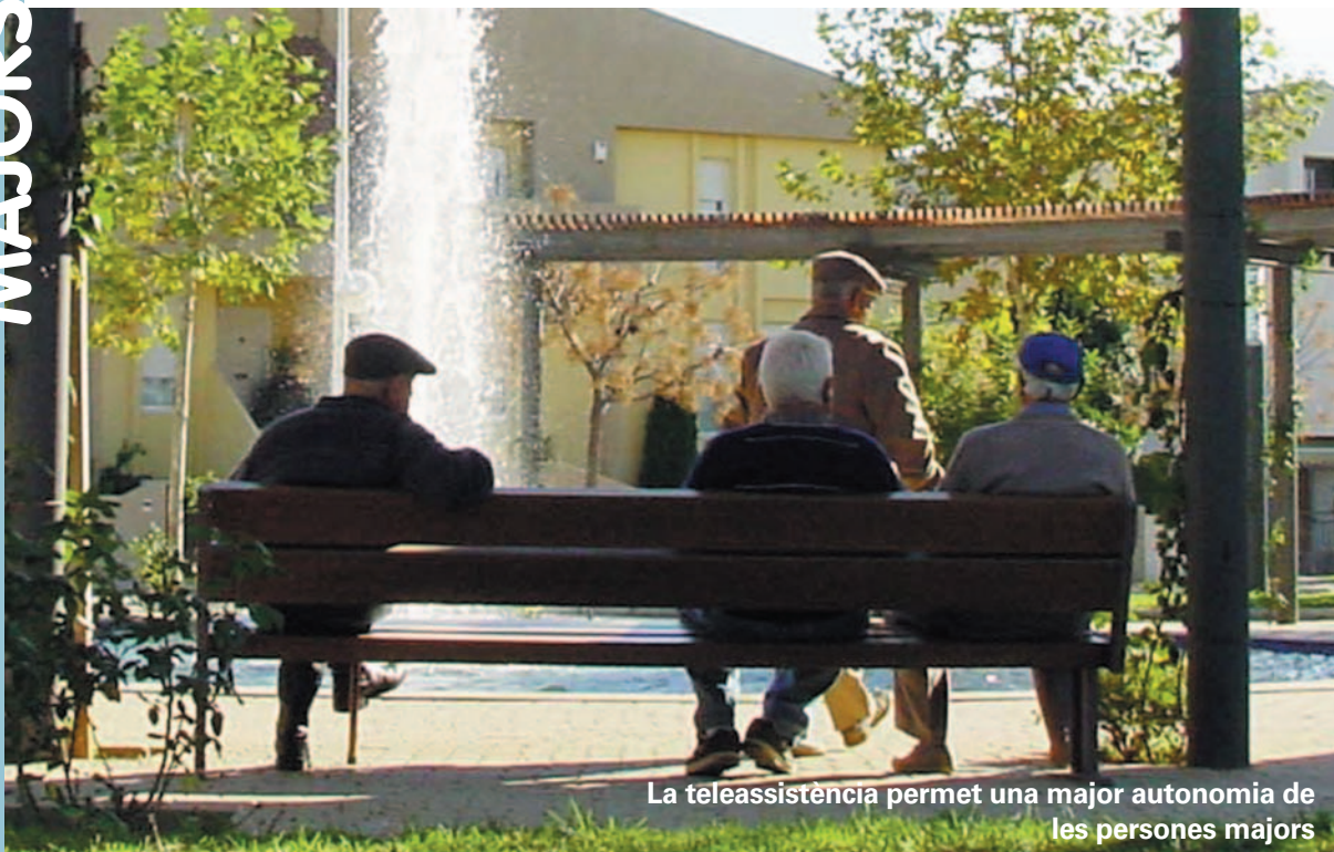
La teleassistència permet una major autonomia de les persones majors

Sería bonito que las calles de Picanya se vistiesen de otoño, que el rojo y el verde adornase nuestras ventanas y balcones calles, paseos, patios..