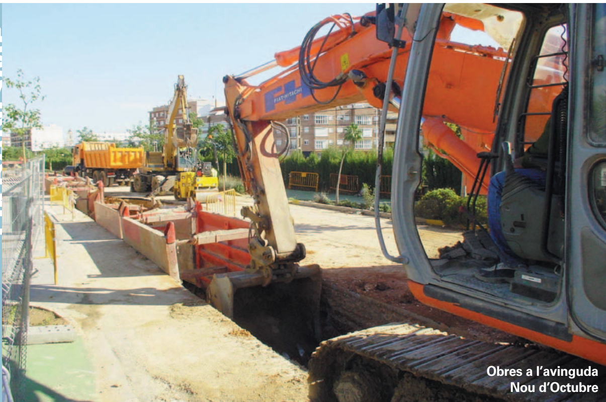
Obres a l'avinguda Nou d'Octubre