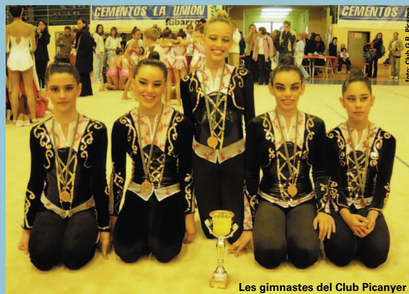
Les gimnastes del Club Picanyer

El xiqui-ritme i el ball modern són dues activitats que, mitjançant la música, el ritme i els exercicis físics, serveixen per a estimular la psicomotricitat i la coordinació de moviments dels xiquets i de les xiquetes. El xiqui-ritme està adreçat als més menuts, d'entre 3 i 6 anys, i el ball modern als xiquets i xiquetes de 6 a 9 anys.