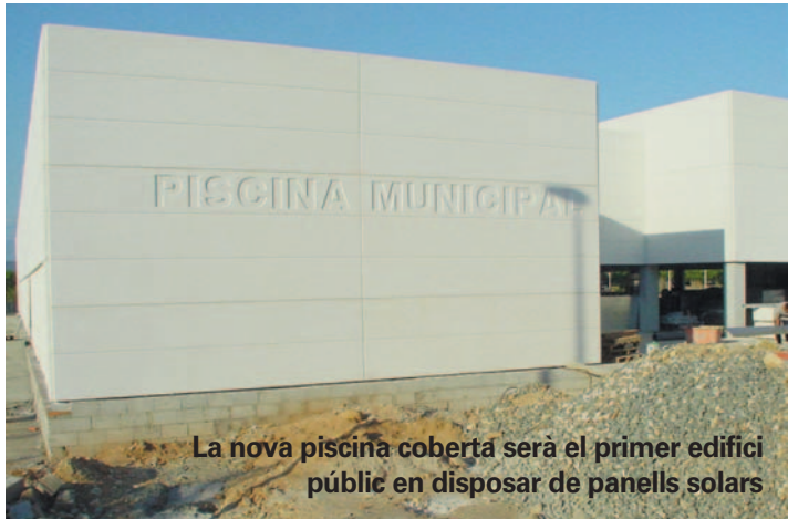
La nova piscina coberta serà el primer edifici públic en disposar de panells solars