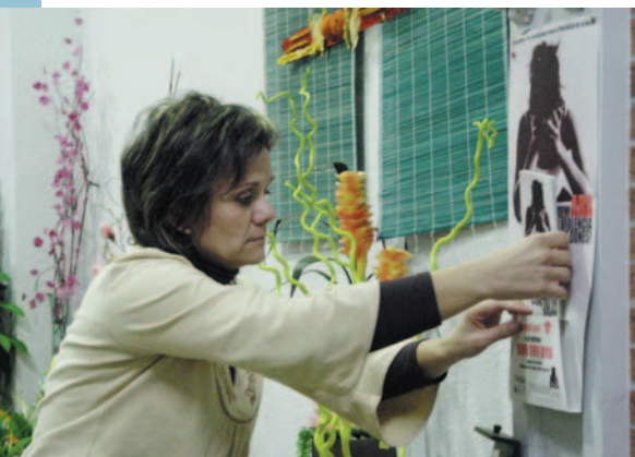
Col·locació del cartell de la campanya en un comerç local

Com sempre també se celebrà una revetlla de confraternitat, a la carpa de Les Floralties , i allà es pogué gaudir d'un grup de folklòric "L'Eglantino Do Lemouzi" i un sopar preparat pel xef del Restaurant Escolar, M.Boadas que va fer les delícies de totes les persones assistents.