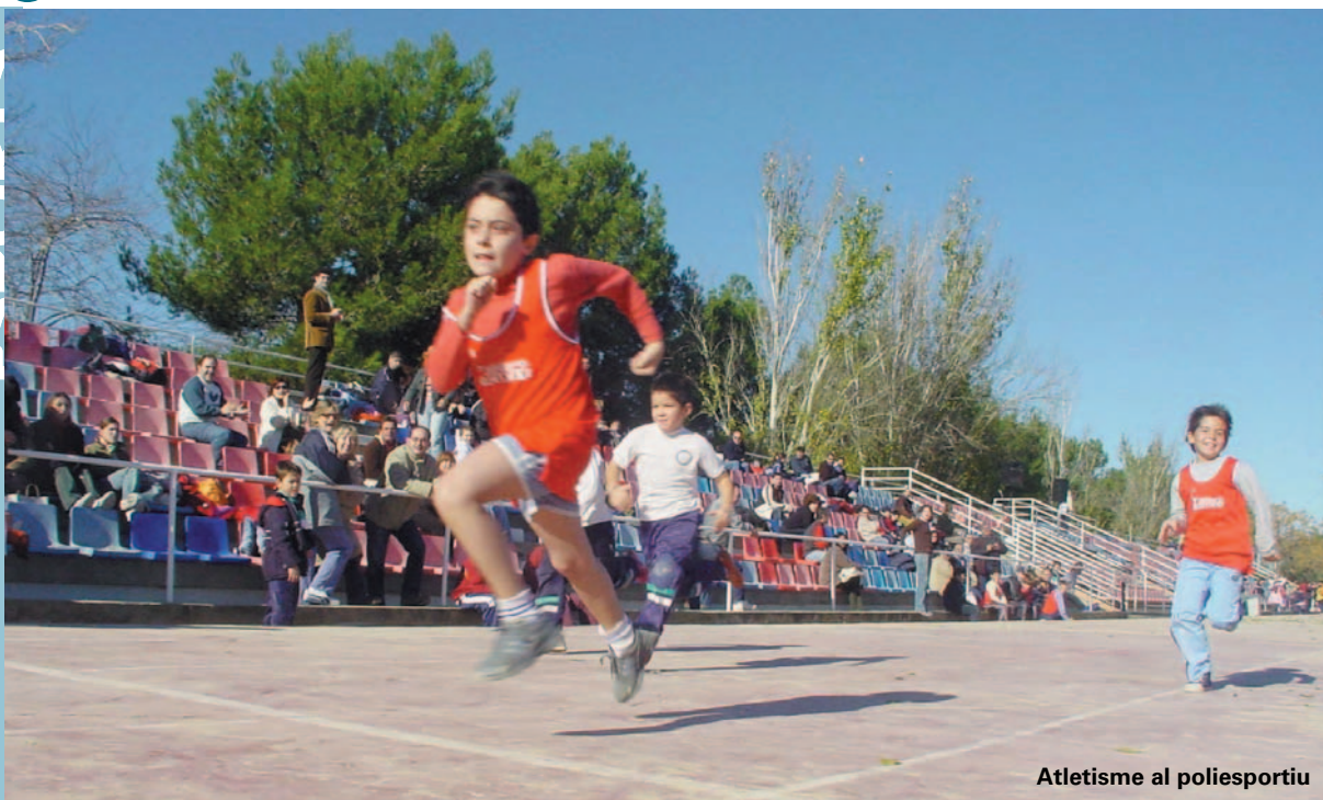
Atletisme al poliesportiu