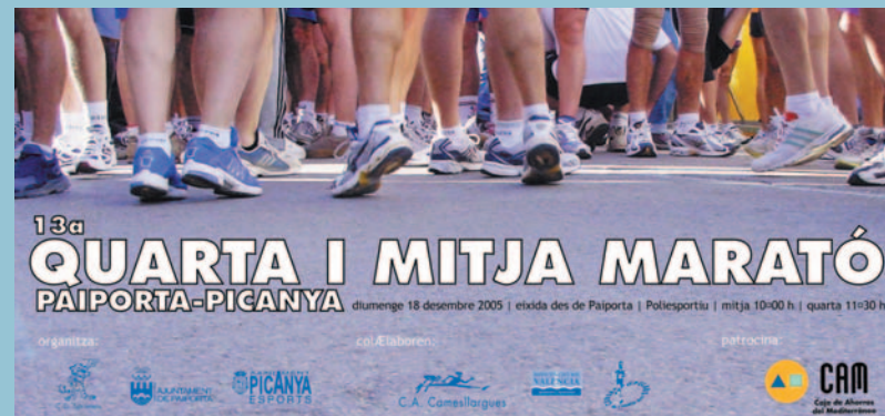
Cartell anunciador de la prova