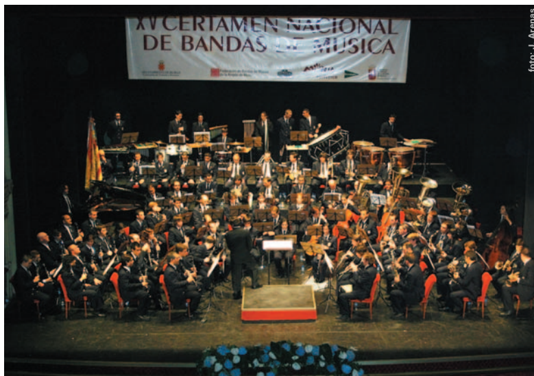
La Unió Musical de Picanya al certamen nacional de bandes celebrat a Múrcia

Per a finalitzar, el 26 de desembre, la companyia GUS Marionetas representarà Cenicienta , un clàssic per a tots els públics (molt adequat per a les dates de nadal) al que aquesta companyia de titelles ha sabut donar una nova lectura i adaptar-lo als nous temps. Il·lusió i divertiment per a tota la família.