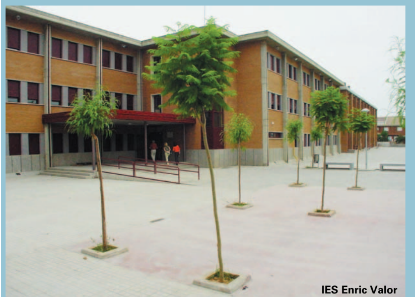
IES Enric Valor

Està previst que en els propers mesos siguen més de 30 els grups escolars (provinents del CP Ausiàs March, CP Baladre i Escola Gavina) els que prenguen part en el programa d'animació lectora. Seran més de 600 els i les escolars que d'aquesta manera passaran per la biblioteca per descobrir l'espai dels somnis, dels contes i de la imaginació. Molts d'ells i d'elles iniciaran així el camí de la lectura.