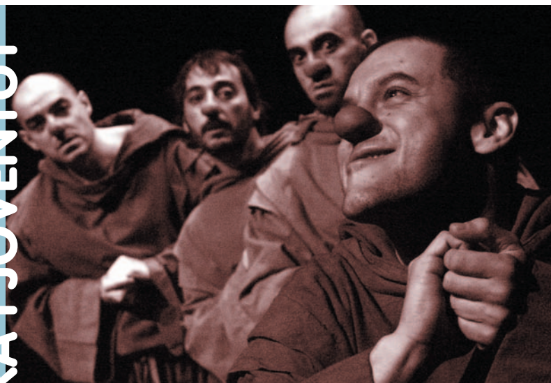
Imatge de Cloun Dei