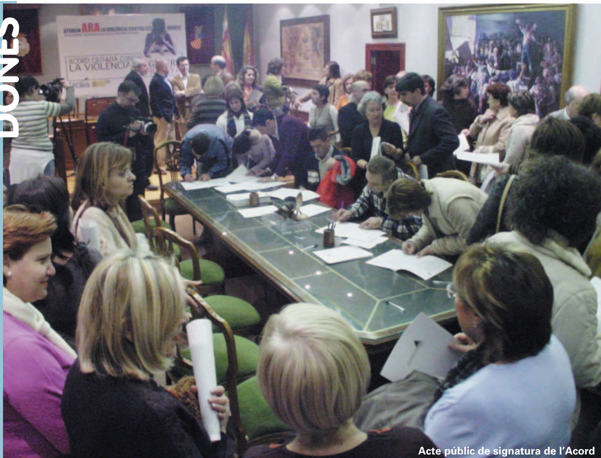
Acte públic de signatura de l'Acord