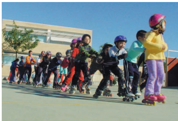
Patinatge al CP Baladre

Aquests encontres comarcals permeten a tots els xiquets i xiquetes que participen en les escoles esportives municipals, poder practicar el seu esport preferit i compartir-lo amb altres xiquets i totes les xiquetes. Front a altres competicions, on hi ha sempre una selecció dels millors, a aquests encontres el