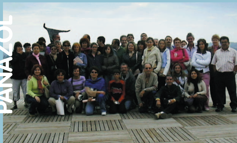
El grup durant la visita