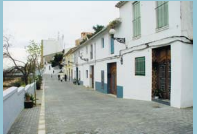
El carrer Almassereta ha estat completament renovat: nou paviment, noves conduccions, nous arbres...