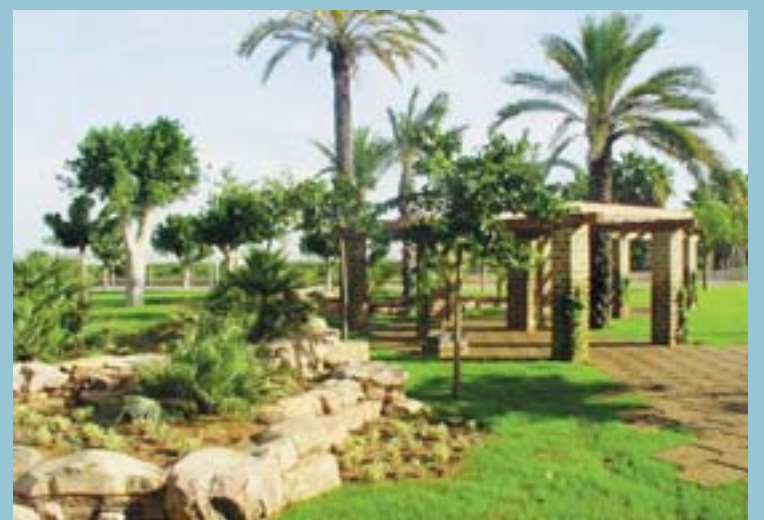
Noves zones enjardinades