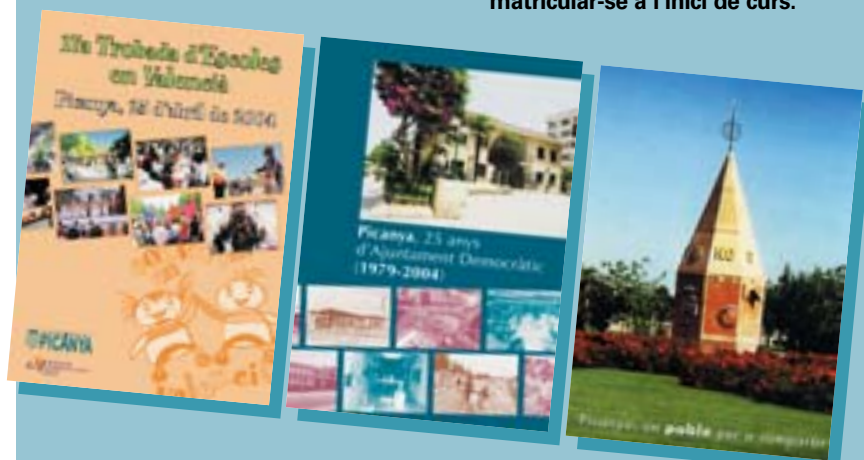
Retre comptes a la ciutadania del treball desenvolupat des de l'Ajuntament és l'objectiu de les accions en matèria de comunicació. En aquest sentit 2004 ha suposat l'aparició d'un nou suport, el DVD, que se suma als ja coneguts llibres, periòdic local, fullets, web, CD Rom...