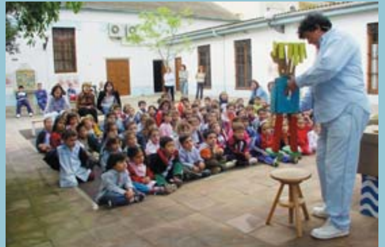
Fomentar l'interés per la cultura (el teatre, la lectura...) des de ben menuts és un altre dels objectius de les polítiques municipals