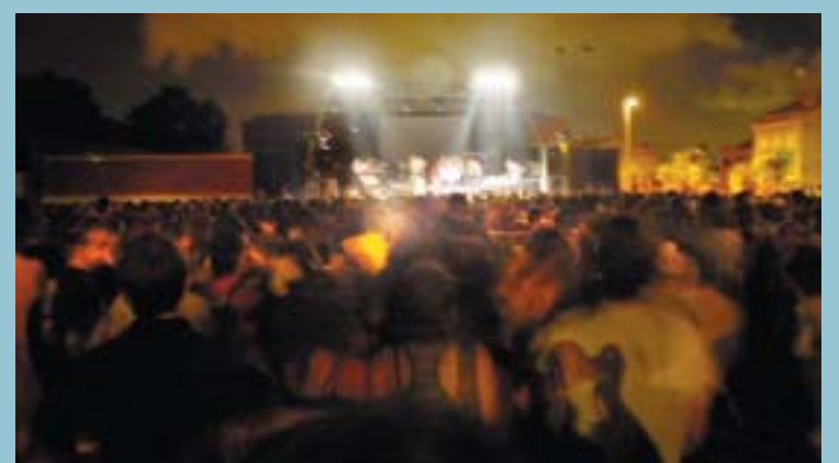
Les Festes Majors en honor a la P. Sang van tornar a traure al carrer tot el poble. Especialment el públic jove, que per milers va acudir a la 10a edició del festival "Picanya Rock"