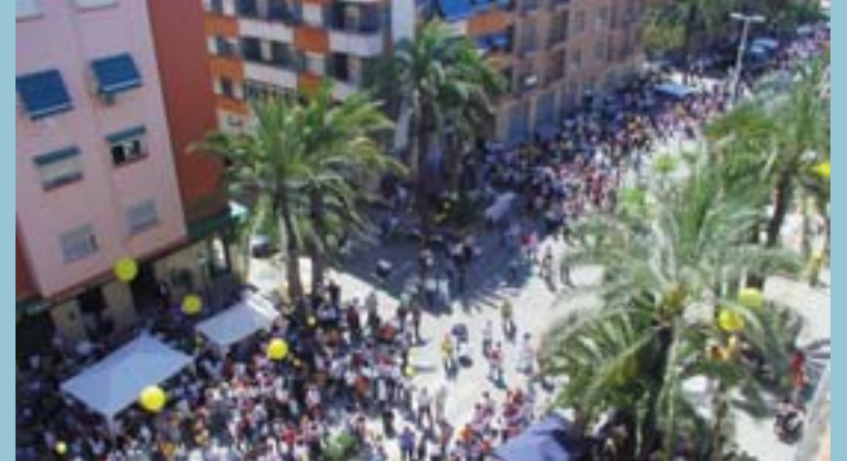
La 17a Trobada d'Escoles en Valencià i les activitats al voltant d'aquesta van marcar la vida cultural del nostre municipi durant 2004