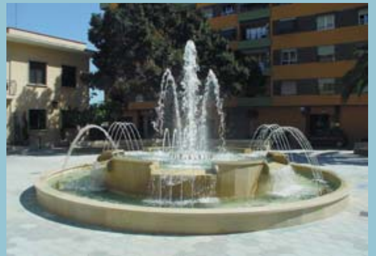
Així llueix la nova font de la Plaça de l'Ajuntament