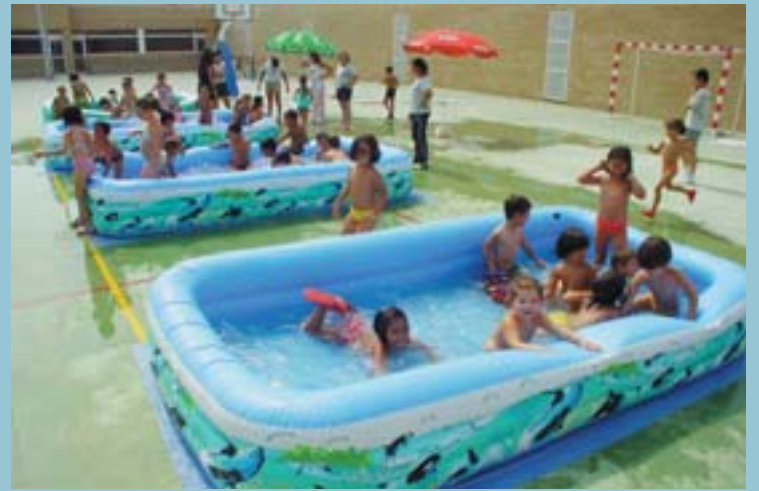
Al mes de juny l'Escola d'Estiu va acollir a més de 200 menuts i menudes que van passar els matins jugant, fent esport, aprenent...

Hace tres años que el Ayuntamiento ha ofertado a la Generalitat los terrenos necesarios para el nuevo Centro de Salud, estamos a la espera de que la Conselleria de Sanitat inicie las obras