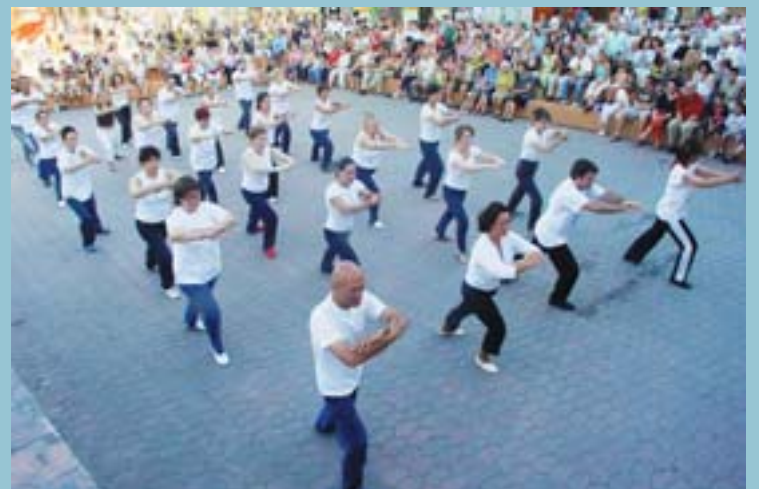
Els programes esportius municipals van continuar incrementant el nombre de persones inscrites. Més de 1.000 persones van matricular-se a l'inici de curs.