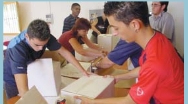
La formació, com a forma de promoure l'ocupació, o simplement pel plaer d'aprendre, ha estat una constant preocupació en els programes municipals. Joves i dones han estat objectiu prioritari.