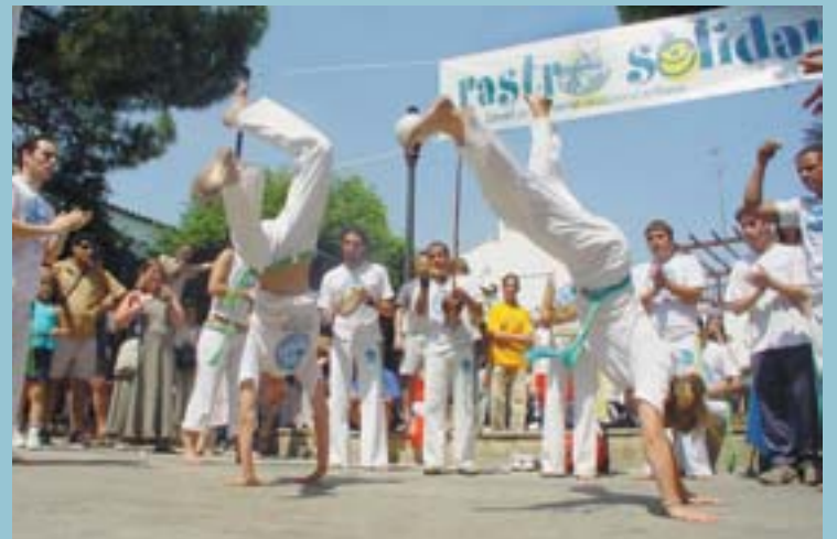
El "Rastro Solidari" va tornar a ser una gran festa de la solidaritat i l'esforç per les persones menys afavorides. La recaptació va superar els 15.000 euros