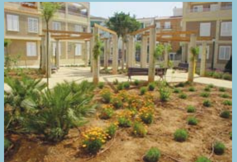
Plaça de la Concòrdia, una nova zona d'esplai i trobada