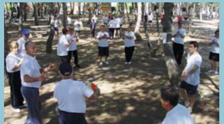
L'atenció a les necessitats de les persones majors destaca com a tret fonamental de les polítiques socials municipals: programa de teleassistència, ajuda a domicili, tallers, gimnàstica...