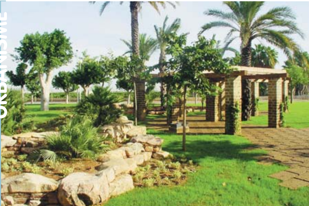
Aspecte de la nova zona verda