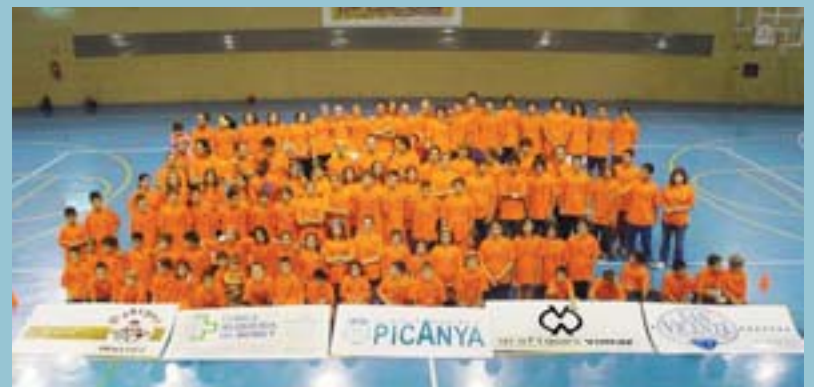
Presentació del club

El Club Valencià de Cant Timbrat Espanyol de Picanya es conta entre els millors del món. Dels 18 membres amb què compta en l'actualitat, quatre d'ells han guanyat el campionat del món i, habitualment, els seus canaris queden entre els millors classificats als concursos de cant.