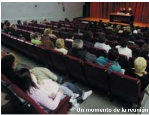
Un moment de la reunió

D'aquesta manera aquelles persones interessades a consultar aquesta publicació poden fer-ho de forma completa tant en format paper com edició digital.