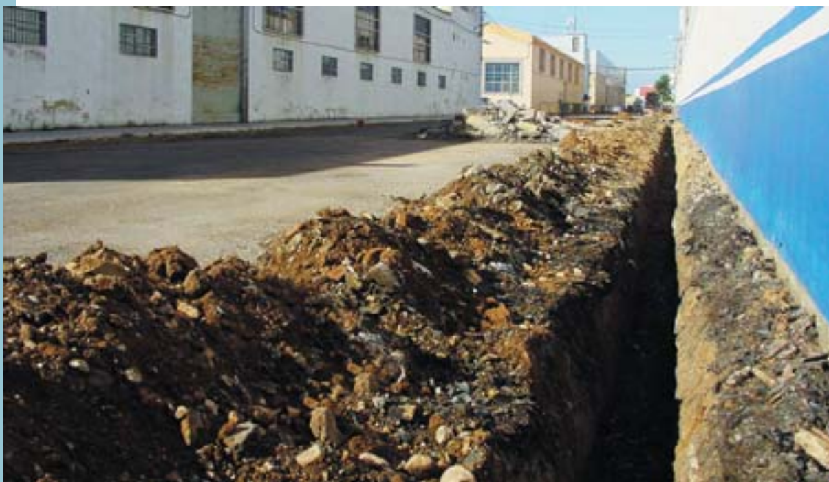
Carrers en obres al polígon de Raga

A més a més, a tota la zona s'han plantat nombrosos arbres i arbusts. A la pèrgola s'han plantat arbusts trepadors, com ara el viburnum opulus, que arriba als quatre metres d'alçada o la dodonea, un xicotet arbre que manté tot l'any el seu color verd. Amb aquest vegetació es crearà una agradable ombra a la pèrgola que a bon segur oferirà un bon lloc per al descans dels caminants i ciclistes que habitualment transiten per la zona.