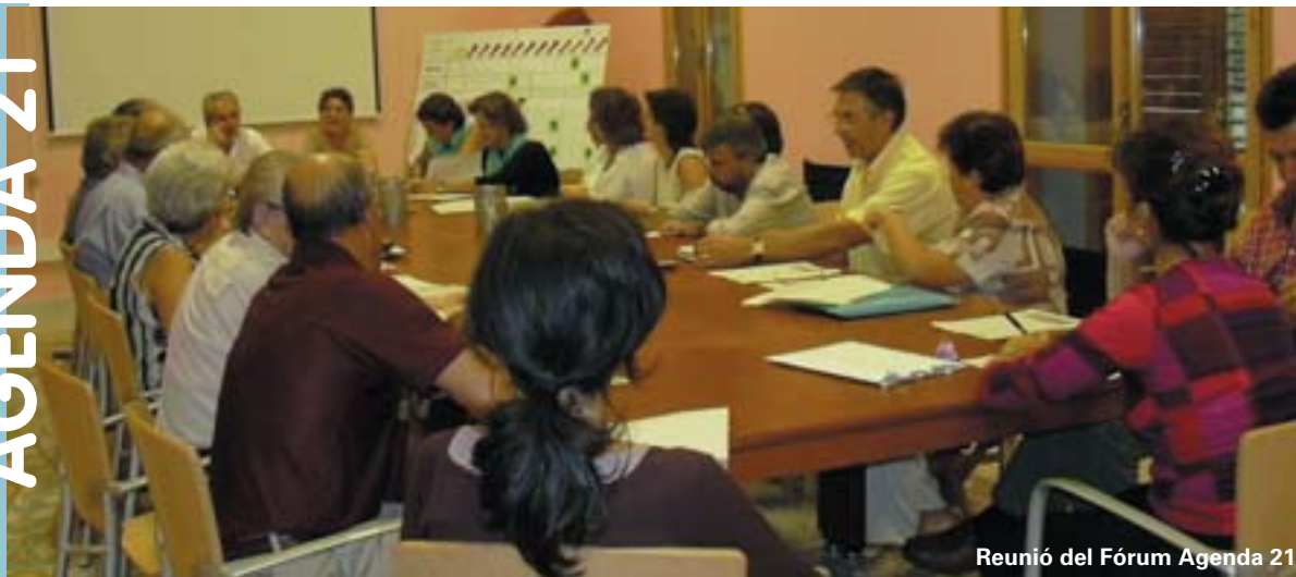
Reunió del Fòrum Agenda 21