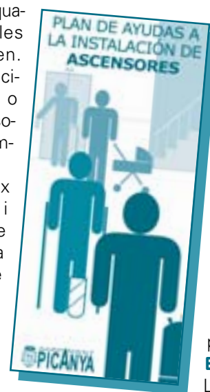
Fullet anunciador del programa d'ajudes a la instal·lació d'ascensors

La combinació de totes aquestes mesures no aconseguirà aturar un procés especulatiu que afecta tot l'estat, però sens dubte pot aconseguir solucionar, encara que siga un per un, els problemes d'accés a l'habitatge de persones que, d'altra manera, no veurien cap opció viable a l'hora de gaudir d'un bé tan bàsic com és el fet de poder disposar d'un habitatge digne. Un dret reconegut per la nostra Constitució.