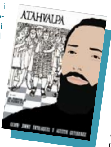
Cartel·l del curt