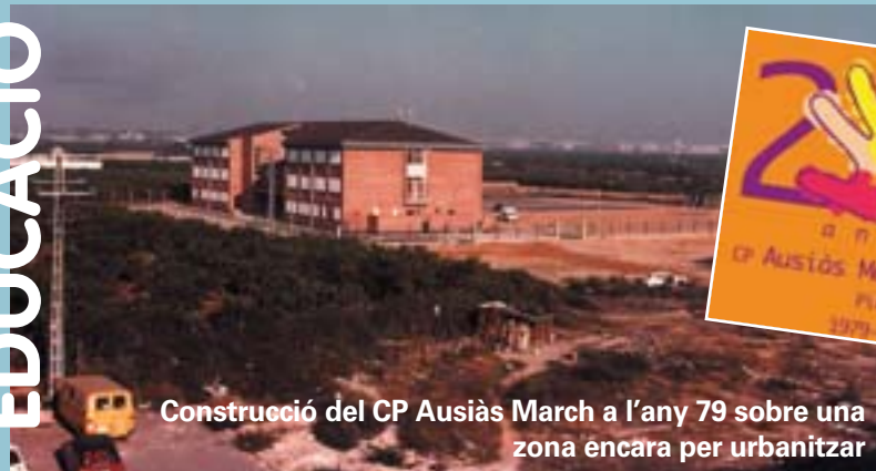
Construcció del CP Ausiàs March a l'any 79 sobre una zona encara per urbanitzar