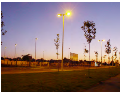
Les noves luminàries en funcionament