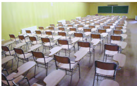
Saló d'actes de gran capacitat