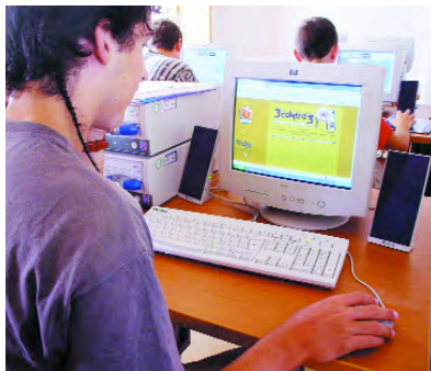
El curs de disseny web ha rebut una gran resposta entre el públic jove