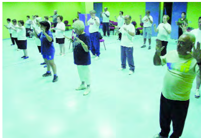
Gimnàstica per a persones majors