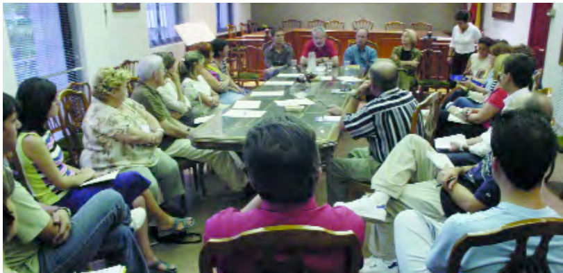
Un moment de la presentació a les Associacions Locals del projecte de la Trobada