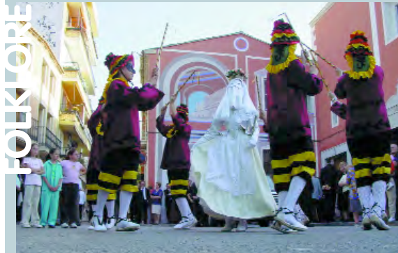
L'objectiu és apropar els joves al món del folklore tradicional

La zona industrial de Faitanar i l'Avinguda Pablo Iglesias ja tenen en funcionament el nou sistema d'enllumenat que permet, a més de l'aprofitament de la zona industrial i de la nova zona residencial, dotar de major seguretat els nous carrers i facilitar el trànsit pel carril-bici que travessa la zona. Les luminàries utilitzades són de baix consum i alt rendiment, cosa que permet un important estalvi energètic. Amb aquesta darrera acció la urbanització de la zona queda pràcticament finalitzada.