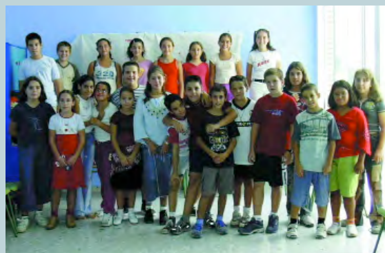
A la foto part dels representants del Consell, format per alumnat de 5é i 6é de les escoles: Ausiàs March, Baladre i Gavina

Sabem que l'ensenyament és un factor molt important en la superació de les desigualtats, un bon indicador de la salut social d'un poble i a Picanya estem encabotats a fer possible que cada vegada siguin més les persones que tinguen oportunitat de formar-se i afrontar el futur amb majors garanties d'èxit.