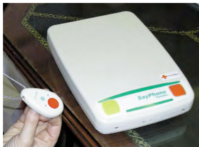
Sistema de teleasistencia