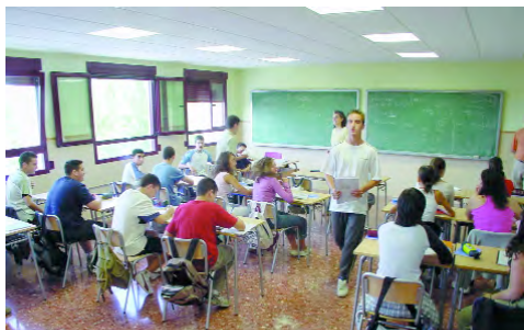
Aspecte de les noves aules