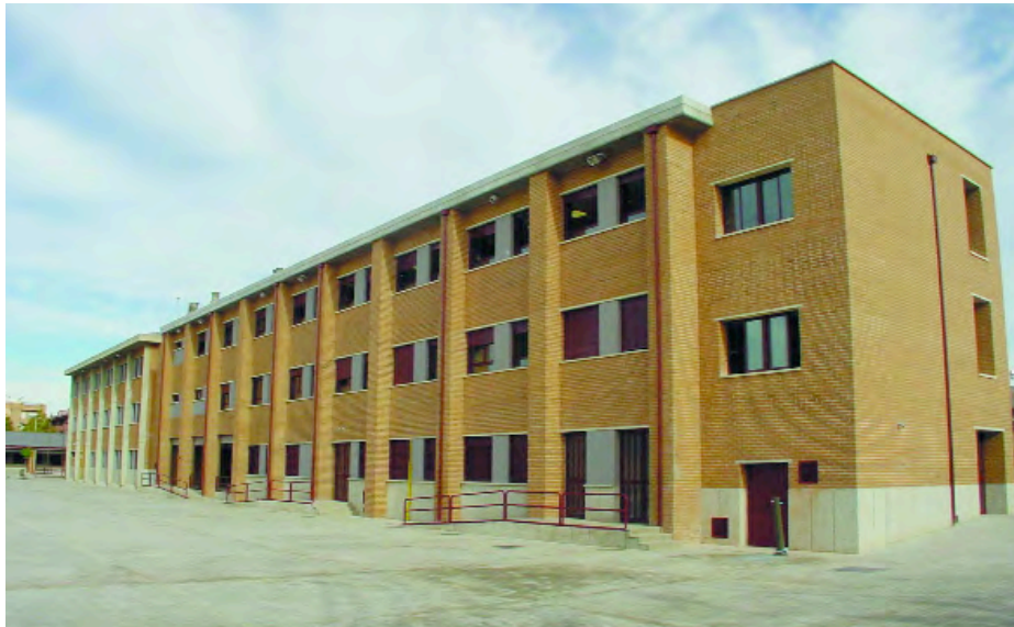
Aspecte de l'edifici principal una vegada ampliat