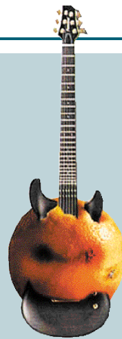
Image del 3r Taronja Rock