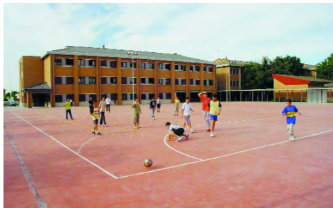
El pati ha estat ampliat i ara permet la ubicació de diverses pistes esportives