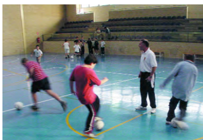
Escola esportiva de futbol-sala