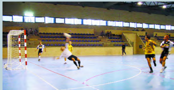
El futbol-sala torna a omplir d'espectacle el Pavelló