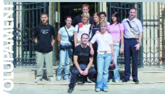
El grup a la porta de l'Ajuntament

Esperamos que este tipo de trabajos ayuden a poder dar al fenómeno de la inmigración, respuestas constructivas en la resolución de los problemas de integración, comprensión y aceptación de la diversidad cultural.