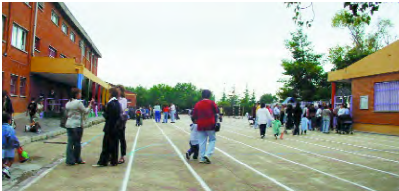
Pati del CP Ausiàs March en el moment de l'entrada

Aquest setembre hem pogut arrebregar algunes albergines. A l'alumnat li agradà molt veure com creixien les plantes, eixien les flors i es convertien en fruits. Tota l'escola va gaudir d'aquesta activitat i esperem millorar-la en cursos vinents. Volem seguir contant amb l'ajuda de l'Agència de l'Agricultor. La seua orientació serà important perquè l'experiència pugui seguir endavant.