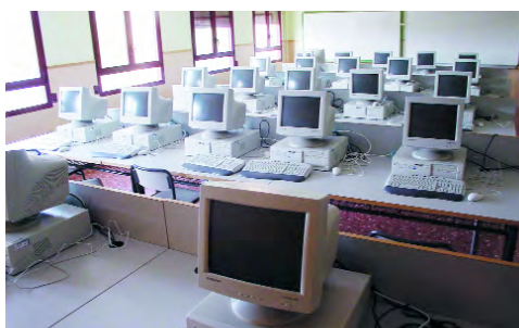
Nova aula d'informàtica