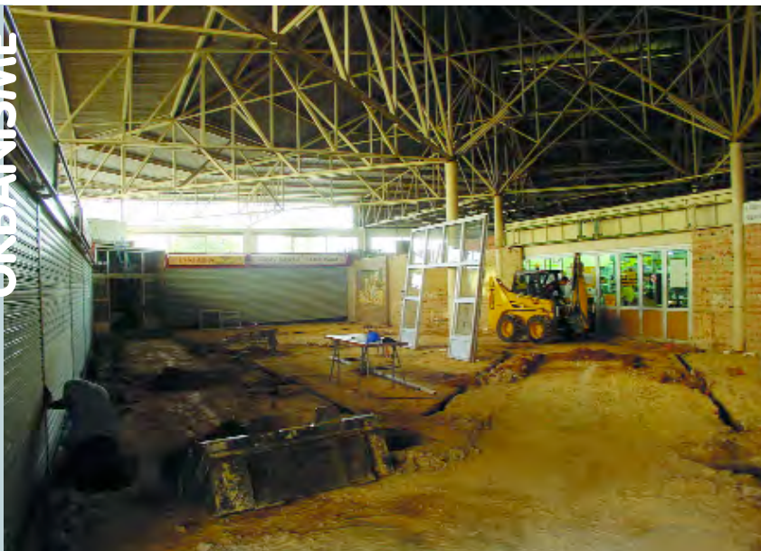
L'interior del mercat està sent completament remodelat