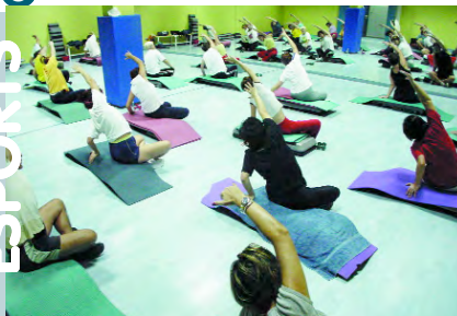
Gimnàstica per a adults