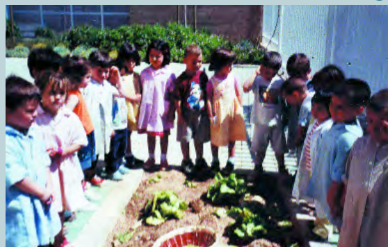
L'alumnat d'educació infantil junt a l'hortet

Des de l'Ajuntament ja s'han mantingut reunions informatives amb tots els col·lectius i associacions del poble per tal que s'integren i participen en l'organització i celebració de la Trobada.