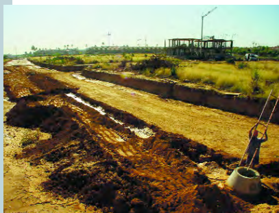
Aspecte del procés d'urbanització

L'Ajuntament de Picanya ha dut a terme la realització i pintat d'una tanca de formigó de dos metres d'alçada al solar de Vistabella que es troba situat entre els carrers Alqueria de Rulla, Alqueria de Prósper i Alqueria Mangarrota. Les obres, que es completaran amb la col·locació d'una tanca metàl·lica per a protegir la façana de la casa confrontant, tenen com a objectiu la seguretat i neteja d'aquest espai públic.