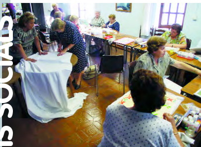
Un momento del taller en el hogar del jubilado