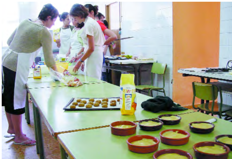
La cuina guanya adeptes entre la gent jove