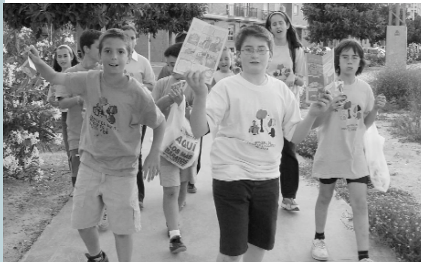
Els membres del Consell en una eixida per millorar la neteja dels parcs

Per als que ja tenen entre 8 i 14 anys l'oferta se centra en els esports i l'activitat a l'aire lliure. El poliesportiu i la platja del Saler són els seus espais, encara que enguany, com a novetat, també s'han organitzat eixides a parcs naturals i paratges de la Comunitat Valenciana.