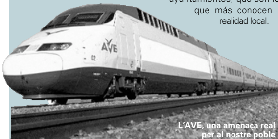
L'AVE, una amenaça real per al nostre poble

DE CASA EN CASA PERIÒDIC LOCAL DE PICANYA II ÈPOCA - ANY XI - NÚM. 62 JUNY-JULIOL '02