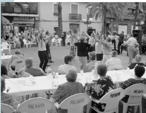
Les persones majors van demostrar el seu esperit jove