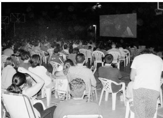
Cinema a la fresca