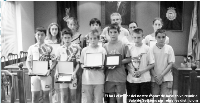
El bo i el millor del nostre esport de base es va reunir al Saló de Sessions per rebre les distincions