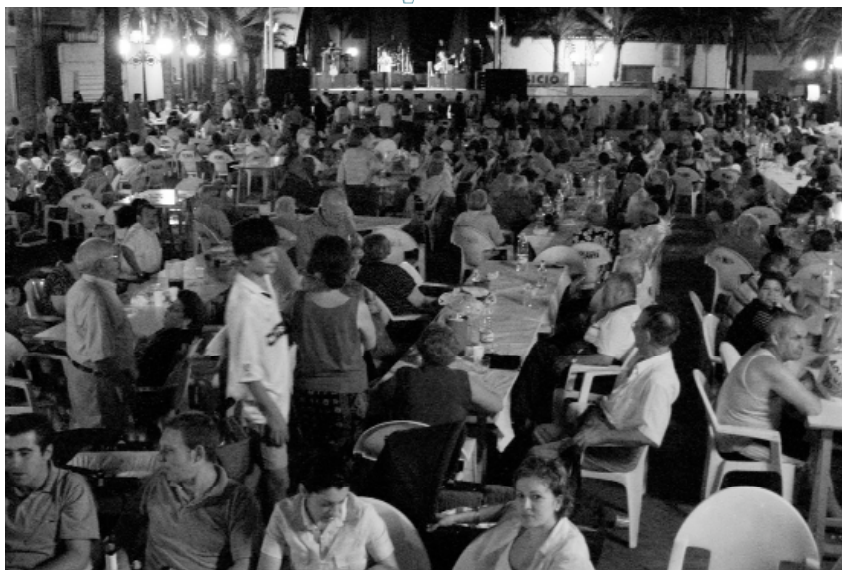
La plaça del País Valencià es convertí novament en el centre de la Festa