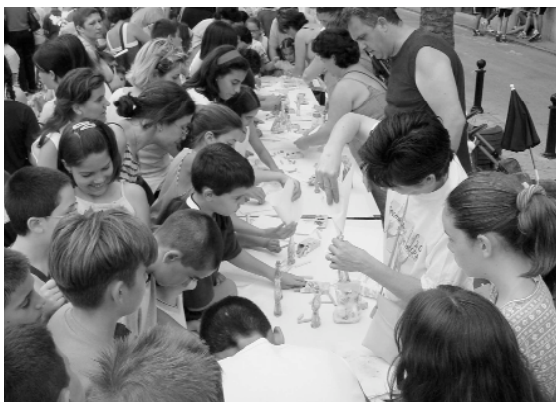
Tallers per als més joves