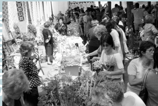
Picanya va tornar a respondre a la crida a la Solidaritat que suposa el Rastro

Una altra de les propostes del Consell de Xiquets i Xiquetes és que es creen llocs de reunió per als xiquets des d'on anar tots junts caminant cap a les seues respectives escoles. L'objectiu és que els escolars de Picanya puguin anar sols a l'escola i que no es produïsquen els problemes de trànsit que ara es veuen als voltants dels centres escolars a les hores d'entrada i d'eixida de classe.