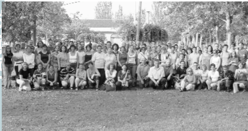
El grup de francesos i picanyers en el moment de l'acomiadament