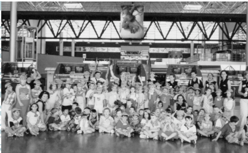
Els i les més joves durant una de les seues excursions, en concret, en la visita que van realitzar als cinemes "Kinopolis"