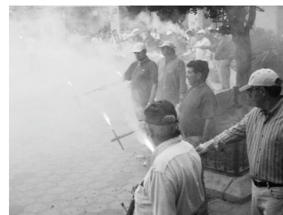
"Passà del Quadret"