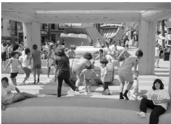
Diversió per als menuts al parc unflable