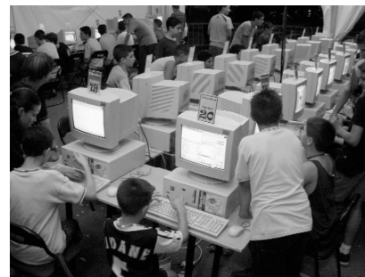
Descobrir Internet: la novetat d'enguany

Picanya consolida un model de festa participada i oberta a tots els públics amb una oferta ben variada i fonamentada en el treball i les sollicituds de les associacions del poble.