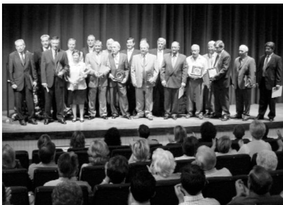
Els clavaris de 1997 van rebre un record