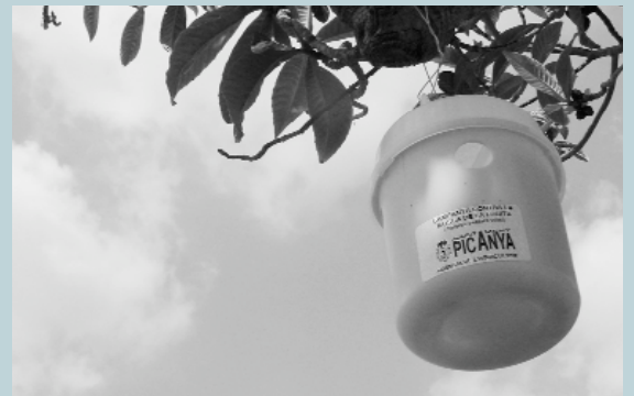
Una de les trampes contra les mosques instal·lades als fruiters

Per ampliar aquesta informació podeu adreçar-vos a l'Agència de l'Agricultor, bé personalment, a les oficines de la plaça Espanya num. 7, bé per telèfon: 961 594 460 o per correu electrònic: ada@picanya.org