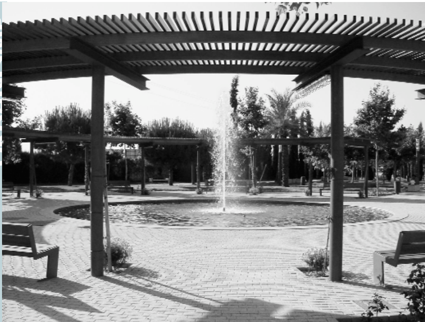
Aquesta font ja s'ha convertit en punt de trobada per a les caloroses vesprades d'estiu