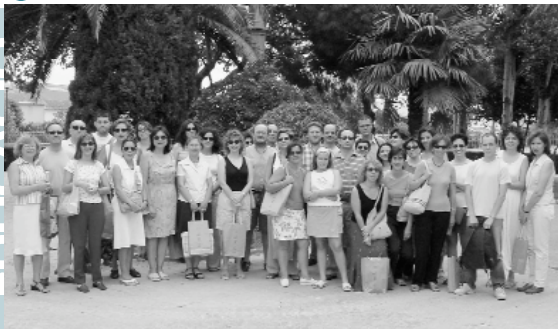
El grup a la PI. de la Constitució