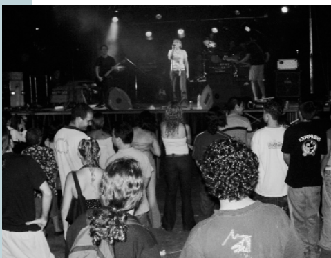
Rock per a tancar la festa