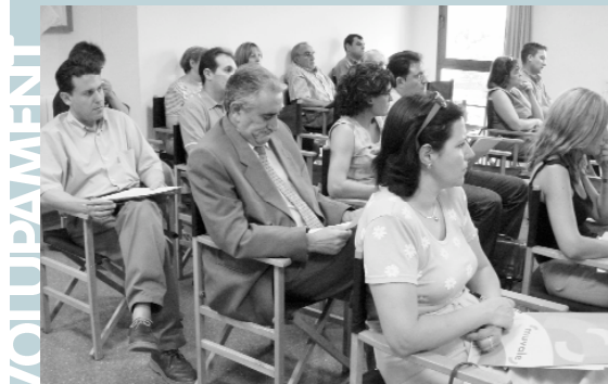
Part dels assistents al seminari sobre riscos laborals

Podem demanar exemplars a l'Ajuntament de forma gratuïta.