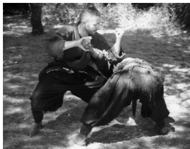
Un moment de l'entrenament a l'aire lliure una de les característiques del Nin-jutsu