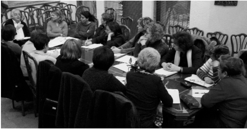
Reunió del Consell de Solidaritat al Saló de Sessions