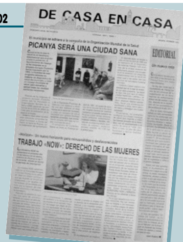
Aquesta va ser la primera portada del De Casa en Casa allà per l'any 1992