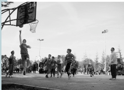
L'equip de la nostra escola municipal de bàsquet en ple partit

dríd, Canàries...) i també a altres països, com ara Mèxic. Al setembre s'incorporà a la residència Joaquin Blume, centre d'alt rendiment per a l'elit de l'esport espanyol, on es troba vivint en aquests moments. Les perspectives per a l'any que acabem de començar passen per presentar-se al campionat d'Europa i a partir d'ací plantejar-se la important decisió de passar al professionalisme.