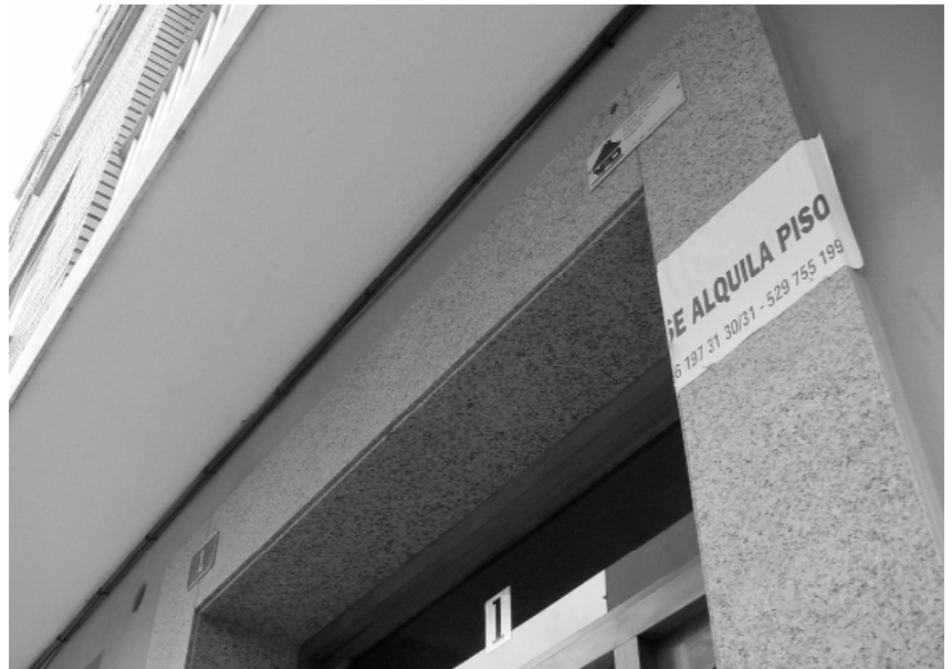
El lloguer pot ser una solució per a la emancipació dels i de les joves

"Jo a la teua edat..." és el comentari que més han de sentir els i les joves hui dia. I, normalment, és un comentari injustificat i sense fonament, ja que la situació econòmica-social ha canviat molt els darrers trenta anys. Actualment es produeixen diversos factors i problemes que determinen el comportament dels joves. D'una banda, la longevitat de les generacions anteriors no permet un relleu generacional més accelerat als llocs de treball. A més a més, l'automatització cada vegada major de les empreses fa que la demanda de mà d'obra haja caigut respecte als anys 60 i 70. També l'educació ha canviat en les darreres dècades del segle XX. Actualment un alt percentatge dels joves arriba a finalitzar els seus estudis secundaris i es decideix a encetar una carrera universitària, que no finalitzaran fins als 23 o 24 anys. En conseqüència concorren més tard al mercat