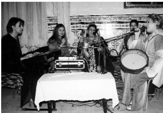
Orquestra femenina "El Nor"