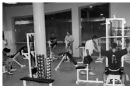
Sala de musculació al Pavelló, activitat a totes hores

Per a una població com la nostra, d'uns 9.000 habitants, si fem un ràpid càlcul, i a les 1.140 persones vinculades als programes