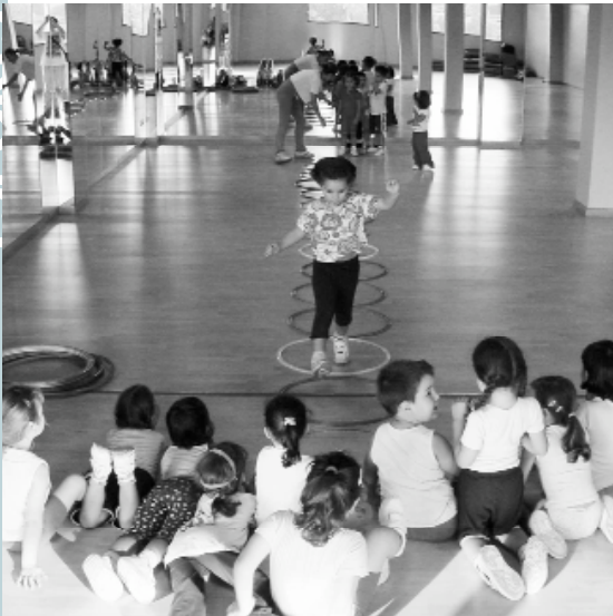
Activitats al Pavelló. A l'esquerra: Xiqui-rítme, nova activitat de coordinació i psicomotricitat per a menuts. A la dreta: aeròbic, ball-gim (menuts de 6 a 8 anys) i gimnàstica per a adults.