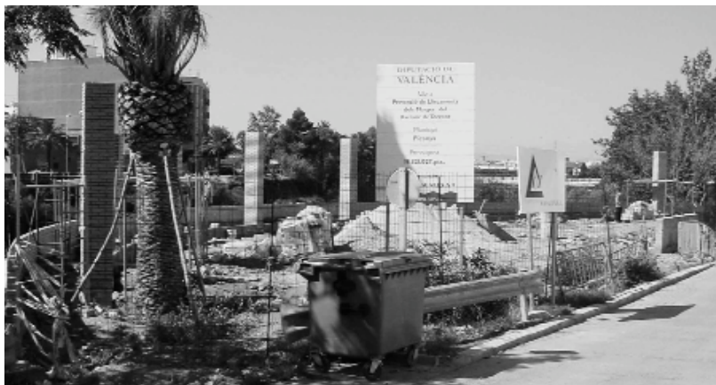
A hores d'ara la plaça ja comença a oferir una idea de com serà el seu aspecte definitiu