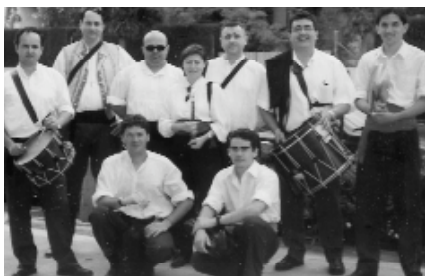
El grupo de tabal i dolçaina de Picanya