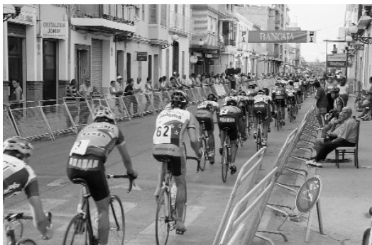
El grup al seu pas per meta durant la passada edició del GP de la Sang