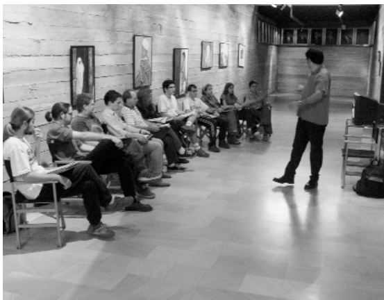
Assistents al curs de curtmetratge durant una de les sessions a la sala d'exposicions

Quatre peces teatrals ben recomanables per a combatre el fred de la tardor amb humor i intel·ligència.