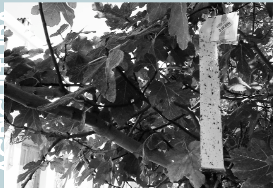
Els fruiters aïllats també han estat objecte de tractament