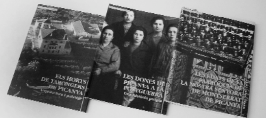
Treballs guanyadors d'anteriors convocatòries ja publicats a la col·lecció Pont Vell

municipals, sumem les persones que formen part dels clubs i aquelles que practiquen esport pel seu compte, ràpidament podem valorar que més d'un 25% de la nostra població practica esport d'una forma regular, un percentatge molt superior a la mitjana de la resta del país. Poc a poc anem aconseguint fer de Picanya una població més esportiva, i per tant una població més saludable.