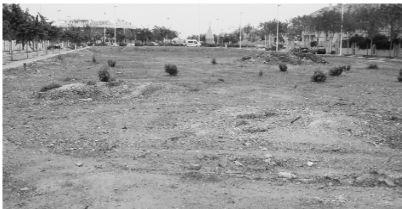
En aquest zona s'instal·laran les aules prefabricades que permetran mantindre l'activitat docent durant les obres