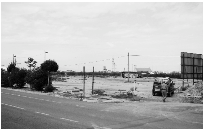
En aquest solar junt a la rotonda d'Andreu Alfaro es construirà el Centre de Dia de Persones Majors