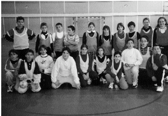
Els escolars de Picanya i Panazol gaudiren d'uns dies de convivència que sens dubte hauran fet nàixer amistats que perduraran en la distància

El segon dia possiblement serà un dels més recordats pels alumnes, ja que fou el dia de la visita al Futuroscope. Obrien els ulls de manera impensable quan parlen de tot el que varen veure i deixen d'existir paraules suficients per