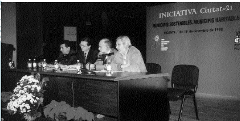
Jornada inaugural de l'encontre

L'Ajuntament s'integrarà en la Xarxa Europea de Ciutats Sostenibles per a potenciar la millora del medi ambient