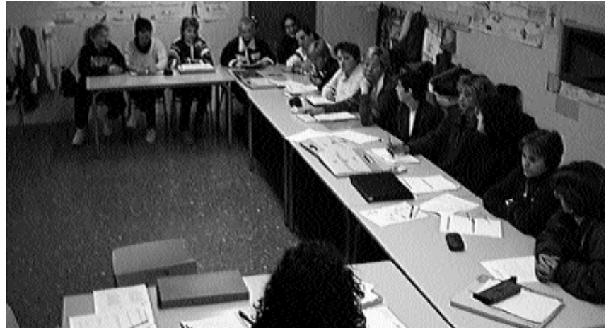
El grupo de trabajo durante el periodo de formación que más tarde se completará con prácticas en distintas empresas de la localidad

Para contrarrestar esta situación, los responsables del programa han previsto el desarrollo de tres fases a través de las cuales los asistentes reciben una formación teórica que podrán poner en práctica en diferentes empresas durante tres meses. El objetivo final del proyecto supone la contratación del trabajador de manera permanente. «Parte de la formación teórica se basa en incentivar el conocimiento propio, porque a pesar de las dificultades, son personas perfectamente válidas y preparadas para trabajar, y eso es algo que todos deben saber» , concluyen. La Iniciativa Comunitaria INTEGRA