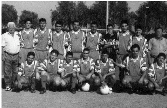
Aquest és el nou d'equip de futbol

En aquest moment "Les Palmeres" es troba a la meitat de la taula de classificació, i tenint en compte que es tracta d'un equip nou és una bona posició. A més,