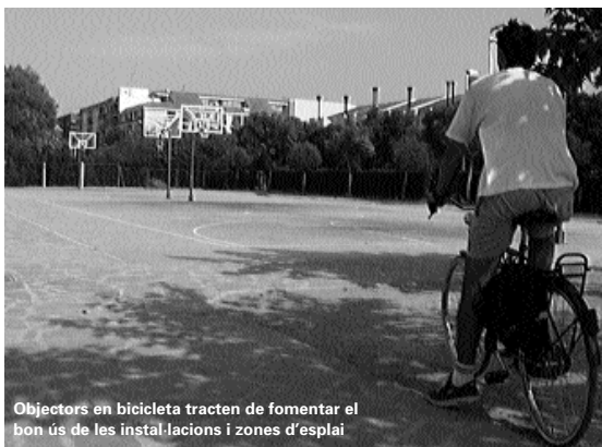
Objectors en bicicleta tracten de fomentar el bon ús de les instal·lacions i zones d'esplai

Els objectors que prèviament hagen realitzat treballs com a voluntari en algun tipus d'associació, poden sol·licitar la convalidació d'aquest temps de