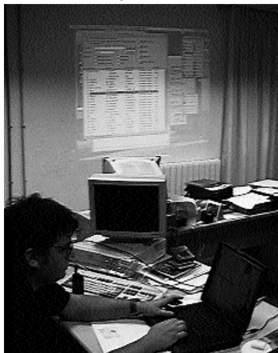
Durante la reunión se presentó la intranet que permitirá la conexión de los socios a través de Internet con lo que se garantiza el flujo constante de información entre las diferentes instituciones

Durante el mes de diciembre se celebró en Picanya una Reunión Transnacional que acogió a un total de 13 instituciones de diferentes países europeos promotores de proyectos similares a los desarrollados en Picanya bajo el nombre de Xarxa Local d'Inserció y Joves Errequeerre2 . El objetivo del seminario ha sido múltiple, los responsables de los proyectos compartieron sus prácticas con la finalidad de ayudarse mutuamente a resolver problemáticas que se plantean: motivación de beneficiarios, contenidos formativos, metodologías adaptadas, etc. Con este trabajo se proponen completar un modelo compartido de desarrollo de proyectos que favorezcan la ocupación, y que contempla modelos parciales referidos a: investigación de las oportunidades de ocupación en los diferentes sectores económicos, búsqueda de beneficiarios potenciales que reúnan el perfil, desarrollo de programas formativos tanto de competencias sociales como técnicas; metodologías e instrumentos de evaluación; cómo establecer relaciones estratégicas con las empresas, y finalmente el necesario modelo compartido de difusión a lo largo del proyecto. El grupo de cooperación transnacional, en la reunión de Picanya y gracias a la colaboración del Centro de Formación e Inserción profesional de la Generalitat Valenciana al prestar sus aulas y medios, ha realizado una especie de "ensayo general" de lo que será al mismo