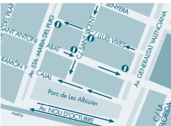
Nova organització del trànsit a la zona

La finalització d'aquestes obres, a més de millorar la comunicació, suposarà també un nou planejament del trànsit de vehicles a