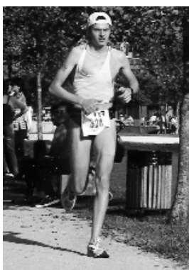
El duatló és una modalitat esportiva molt exigent que convina en una mateixa prova la cursa a peu i en bicicleta