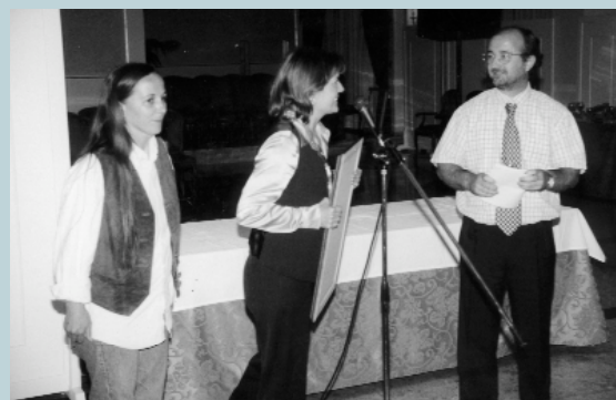
Una representació del professorat de l'escola va recollir el premi

La sisena edició del Premi Celobert ja té guanyador: el col·legi Ausiàs March de Picanya. Amb aquest premi s'ha volgut reconèixer el treball de sensibilització sobre el medi ambient que està fent aquesta escola des de fa 17 anys amb la seua Setmana Ecològica. La Setmana Ecològica consta d'un programa d'activitats que realitzen entre professors de l'escola Ausiàs March per tal de conèixer millor el nostre entorn i aprendre a donar-li el seu just valor. A més, també es realitzen activitats sobre els problemes mediambientals