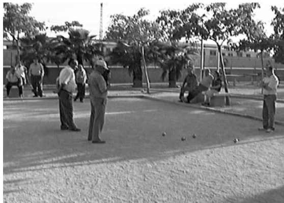
La petanca ha calado hondo entre nuestros mayores y estará presente en "Los Días de las Personas Mayores"

El jueves 27 de mayo, a las doce del mediodía, se celebra-