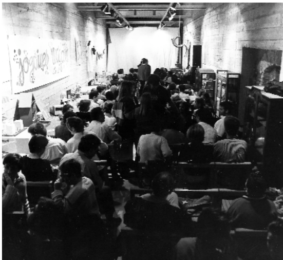
Ple total de la Sala d'Exposicions en el inici de les projeccions organitzades pel grup Méliès Cinema i l'Ajuntament

Han triat com a lloc per a les projeccions la Sala d'Exposicions perquè és un lloc més familiar que el Centre Cultural i permet moure les cadires i organitzar debats d'una manera més informal i pròxima després de les pel·lícules. El problema que té aquest espai és que el seu aforament és molt limitat, com va quedar demostrat durant la primera projecció. Des del primer moment s'han plantejat com a objectiu fer-li un lloc al cinema menys comercial i alternatiu. A més, per al futur tenen previst triar pel·lícules que plantejen un tema o un problema i que servisquen de fonament per al debat posterior.