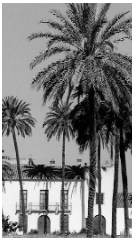
hort de Les Palmes