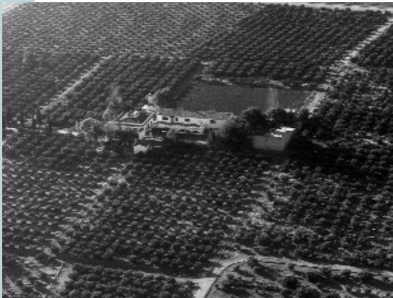
hort de Montesinos

carregat d'ornamentació, derivava cap a un estil decò amb una decoració més simple. Altres elements paisatgístics que introduïren els horts van ser els jardins i els passejos. Els jardins, que normalment envoltaven la casa, presentaven espècies exòtiques desconegudes per a la gent de la comarca i els passejos, que unien la porta de la propietat amb la casa, imitaven els que en aquells moments estaven construint-se a la ciutat, que eren molt del gust de la burgesia.