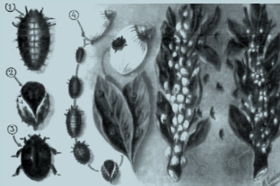
Procés d'evolució del depredador de la cotxinilla acanalada

La lluita biològica contra les plagues que pateix el nostre camp està estenent-se en els últims anys com a alternativa a les solucions basades en la utilització de productes químics, que són més cars i agressius amb el medi ambient i a llarg termini poden resultar perjudicials.