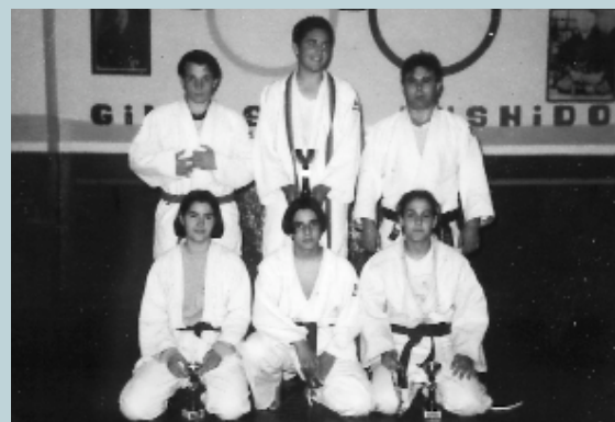
Los y las judokas de Picanya continúan imparables