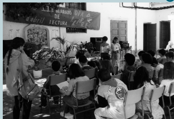
El pati de la casa de cultura va acollir a lectors, lectores i oients