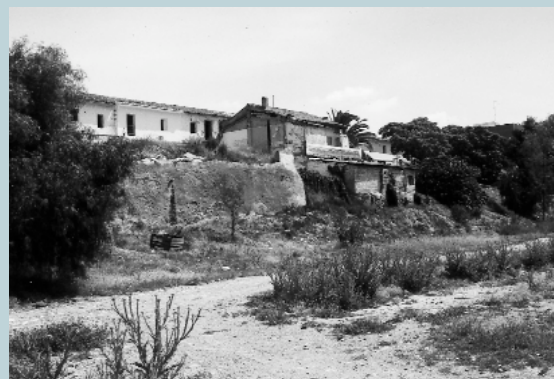
Zona dónde se construirán los muros (antes de la demolición de la casa)

Una vez finalizadas las obras, el tránsito de vehículos agrícolas por estos caminos será más cómodo y más seguro.