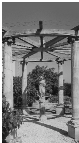
hort de Gamón