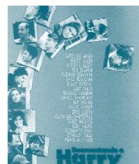
Pròxima projecció: "Desmontando a Harry"

Méliès Cinema és un grup completament obert i qualsevol que estiga interessat a unir-s'hi pot buscar algun dels seus membres els dies de les projeccions. La Diputació de València i l'Ajuntament de Picanya subvencionen totalment el lloguer de les pel·lícules i els diners que es recapten van íntegrament destinats al Consell per la Solidaritat.