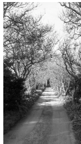
hort de Coll