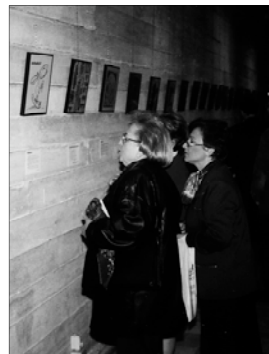
Inauguració de l'exposició de l'Assoc. d'Il·lustradors Valencians

El sopar del premi va estar precedit per una sèrie d'activitats culturals, realitzades a Picanya i València, entre les que destaquen una exposició de l'Associació d'Il·lustradors Valencians a la Sala Municipal d'Exposicions.