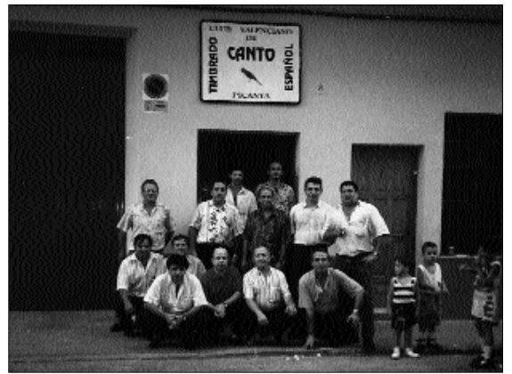
Membres del club a la porta de la seu al carrer Sant Pasqual

El Consell Per la Solidaritat de Picanya elaboró las bases que regulan el acceso de cualquier ONG a los fondos de la entidad, entre las que destacan la constitución legal del organismo, la finalidad del desarrollo de sus actuaciones o la representación en el territorio de la Comunidad Valenciana. El Consell apoyará como prioridades los proyectos destinados a la atención primaria, desarrollo integral, pacificación o iniciativas destinadas a la mujer, así como planes de actuación para la mejorar la situación social del llamado "cuarto mundo".