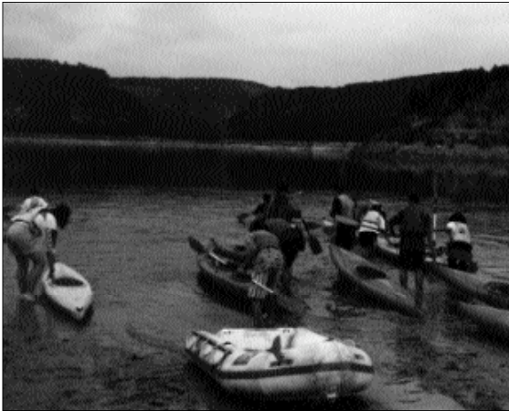
El passat 31 de novembre, 1 i 2 de desembre s'organitzà una eixida de cap de setmana a l'Embassament de Benaixeve a la Serrania. L'objectiu era passar allí uns dies de convivència, al temps que es realitzaven activitats d'esplai a la natura i de formació.

Entre les activitats que du-gueren a terme aquest grup de joves i entusiastes esportistes, malgrat que l'oratge no acompanyà massa, destaquen el piragüisme, l'orientació, l'escalada lliure, i un passeig en un circuit de mini motos. Assenyalar així mateix, l'excel·lent ambient de companyonia i motivació de va presidir aquesta eixida a la natura.