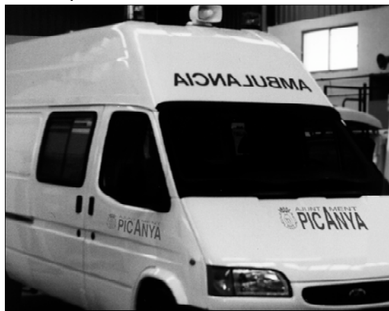
La nueva ambulancia municipal entrará en funcionamiento a partir de principios del año 98.

El valor total de esta inversión ronda los 5.000.000 de pesetas. Se consigue así disponer de un vehículo adecuado a la reglamentación existente sobre traslados sanitarios de corto recorrido.