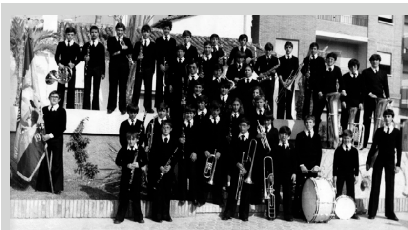
Algunos de los primeros miembros de la Unió Musical

- COU; 12,19, y 26 de Enero y 2 y 9 de Febrero, a las 12'30 h.