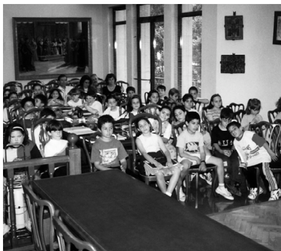
Alumnos de 3er de primària al saló de sessions de l'Ajuntament