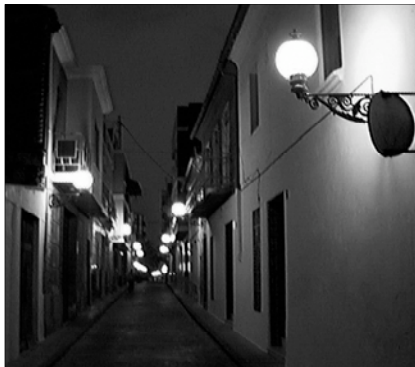
Nuevas farolas de estilo clásico embellecen e iluminan el casco antiguo de Picanya