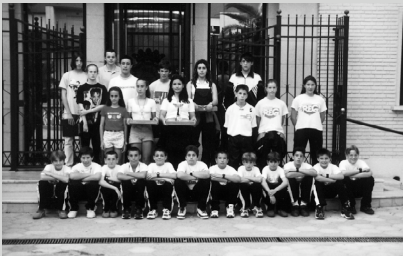
Els i les esportistes premiats a la porta de l'Ajuntament