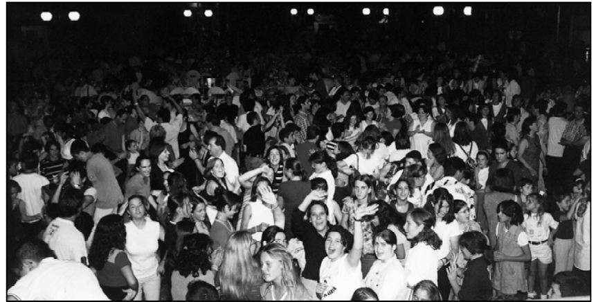
La plaza del País Valencià volverá a ser el centro de la Fiesta

Son más los jóvenes que han colaborado para dar como resultado un ambiente festivo superior a lo ya vivido otros años. Es el caso de las típicas cenas de sobaquillo organizadas por las distintas peñas de Picanya ( El Glop , el Xupito y DIC gent sense problemes ). Además este año el