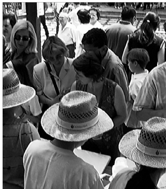
El calor no desanimó a los y las participantes