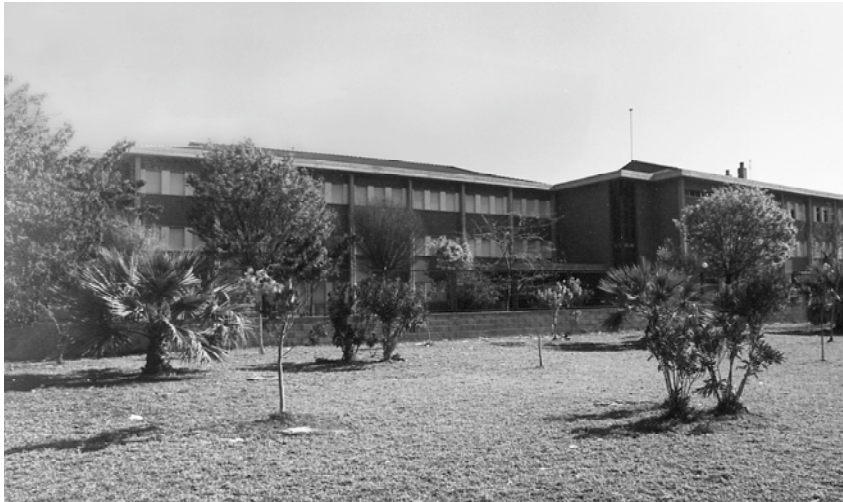
L'institut haurà d'adaptar les seues instal·lacions a les noves necessitats

Això no obstant, l'institut no té actualment prou capacitat