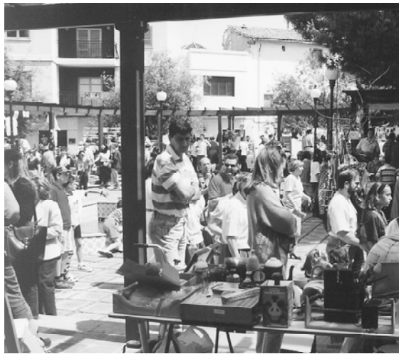
El "rastro solidari '97" contó con una gran afluencia de público dispuesto a colaborar