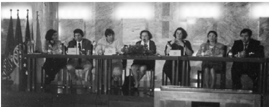
Una de les reunions dels socis europeus del projecte Youngpath

El Youthstart, conegut a Picanya com Errequerre, és un programa de la UE per al foment de la formació ocupacional per a joves menors de vint anys amb baixa qualificació professional. Mitjançant aquest programa, els joves reben formació especialitzada