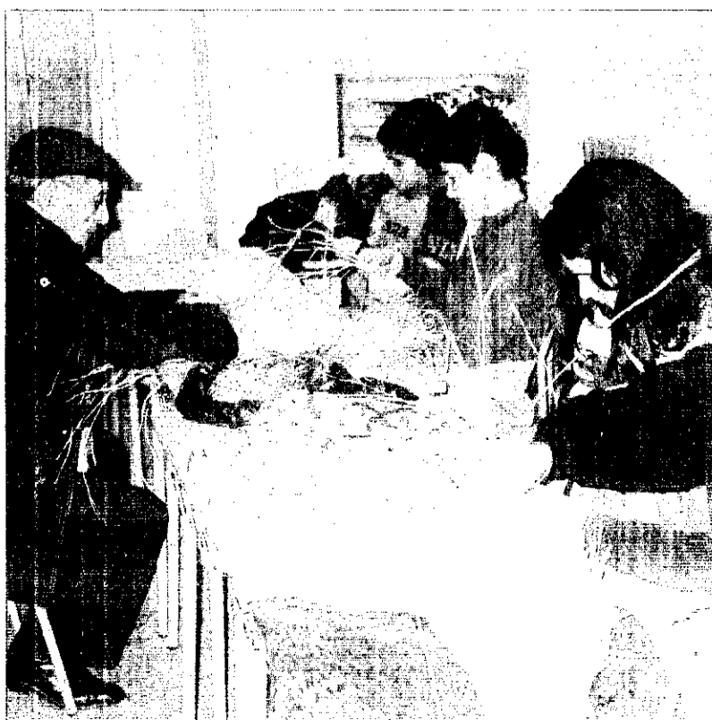
Participantes en el taller de carpintería en el colegio Baladre.

Lo más importante de esta experiencia es el acercamiento generacional en la escuela más que el trabajo en sí que se realiza en los talleres. En el futuro se espera ampliar la oferta de talleres impartidos por personas mayores para que de esta manera transmitan su conocimiento a las nuevas generaciones.