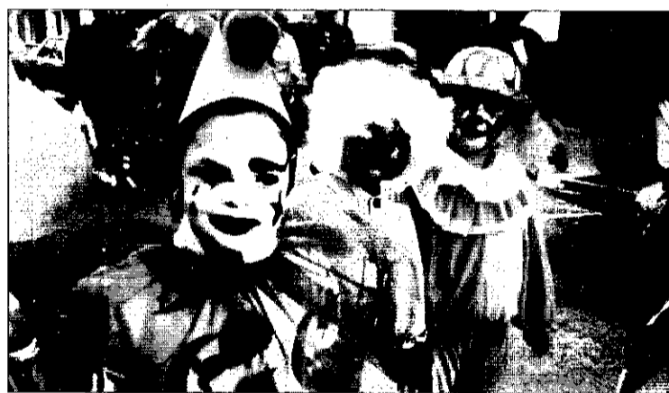
Escolars participants en els carnestoltes d'aquest any.

Als darrers temps carnestoltes té una nova vessant: el món escolar. Cada vegada més la el carnestoltes té un caràcter festiu-escolar. Dita celebració es va consolidant a les escoles i també millorant. Permet una programació d'activitats de caràcter marcadament festiu. S'aprofita per a la realització de màscares, amb diferents tècniques que, després, serveixen també com a elements decoratius.