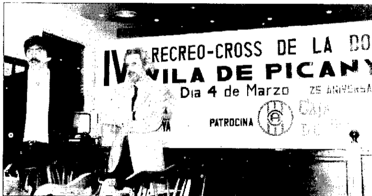
Presentació del IV Recreo-Cross de la Dona a l'ajuntament.

D'aquesta manera, l'Associació d'Ames de Casa i Consumidors Tyrius va organitzar una exposició sobre treballs manuals realitzats per dones de la localitat així com una xarrada col·loqui al voltant del tema "Propietats del pa", a càrrec del Gremi de fomers. Les dues activitats es celebraren el dia 2 de març, al Centre Cultural. El dia 8, aquesta associació va organitzar un dinar al restaurant Rex de L'Alcúdia. Per la seua part, l'Associació de Dones Cafè-Dimarts organitzaren, el dia 3 de març, la xarrada col·loqui "Dones d'arreu del món", en la qual dones de