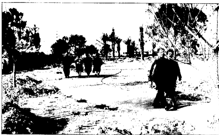
Caminar es el mejor ejercicio para todos.

El Servei Municipal d'Esports de Picanya se hace eco de esta iniciativa buscando este refrán que expresa claramente esta idea. Se ha venido observando, de un tiempo a esta parte, que son muchas las personas que salen a andar desde primeras horas de la mañana, hasta bien entrada la tarde. Unas lo hacen de forma preventiva, y otras por consejo médico para corregir alguna dolencia.