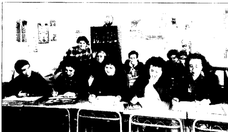
Alumnes de l'EPA de Picanya.

Han passat deu anys i ha hagut un gran canvi en molts aspectes. No ve solament la gent que per edat no obtingué el títol de graduat escolar, sinó un grup de població jove que abandonà els estudis. A més, un altre grup de persones que vénen amb la inclusió d'activitats no reglades per a omplir el lleure. En abril de l'any 1987 es creà l'Associació d'Alumnes i Ex-alumnes de l'EPA. La formaven un grup d'alumnes, per iniciativa pròpia, encara que sí comptaven amb el suport dels mestres que en tot moment els motivaren i ajudaren per a seguir en-