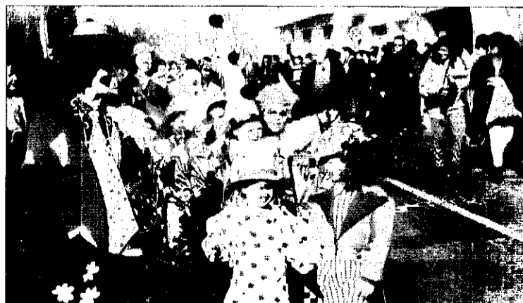
La participació fou massiva.

Igualment, a les classes o nivells escolars es treballa el perquè, la història i altres aspectes de la celebració de la festa de carnestoltes, a més d'eleger un motiu per a la disfressa. Personatges com monstres, bruixes,