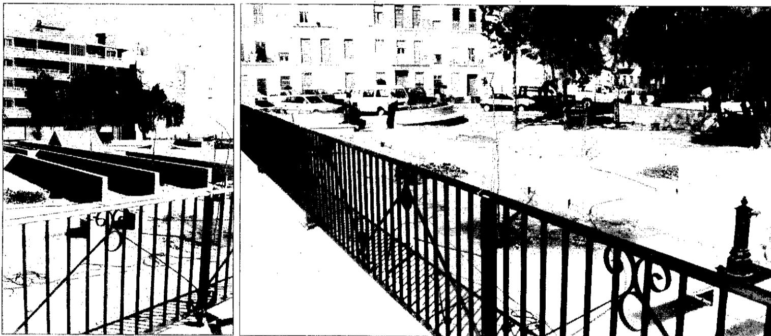
Dos vistas del nuevo parque construido junto al casco urbano de Picanya.

PERIÒDIC LOCAL DE PICANYA - II ÈPOCA - ANY III - NÚM. 14 - MARÇ/ABRIL 1994