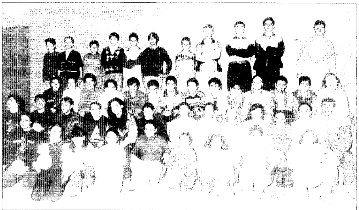
Membres del Club de Balonmano de Picanya.

Picanya no s'ha quedat al marge d'aquest alt nivell esportiu en els últims anys. Des de l'Escola Municipal de Judo, que coordina el Servei Municipal d'Esports, s'ha anant fent un entrenament constant i progressiu per a situar els nostres esportistes locals en el cim de les competicions de judo nacionals i europees.