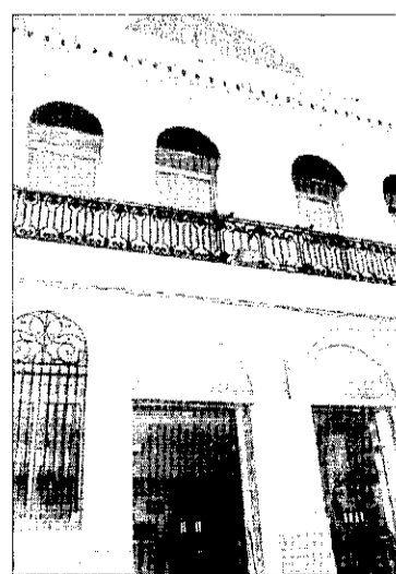
Centre cultural de Picanya.

L'àrea de Cultura del Ajuntament de Picanya ha introduït dues modalitats de bonos. El de temporada, que val 2.500 pessetes i dura fins el mes de