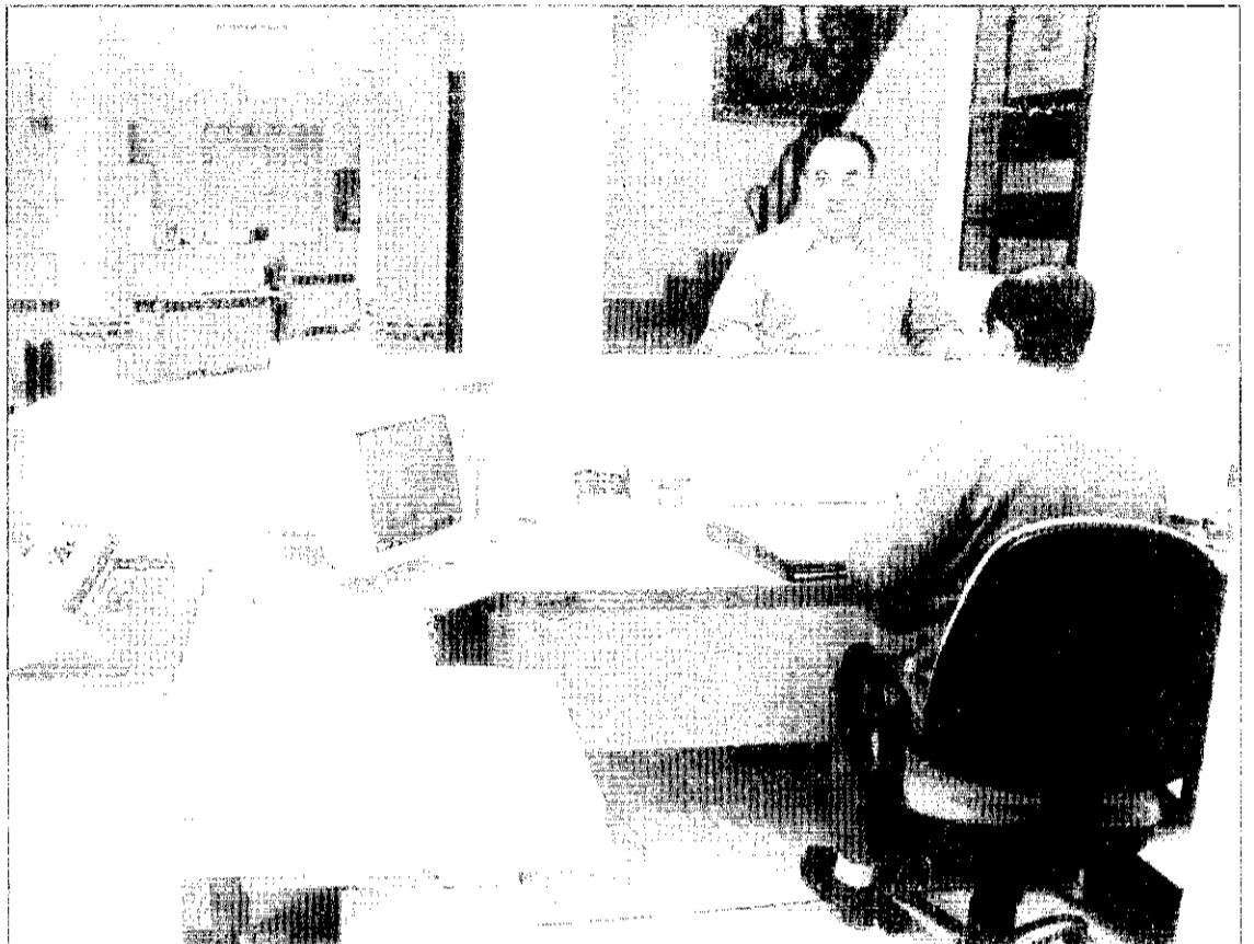
Aspecte actual d'una part de les oficines municipals.

Des de fa algunes setmanes, és ja una realitat la rehabilitació de la casa consistorial de Picanya. L'ajuntament, ja fa alguns anys, s'havia plantejat la necessitat de remodelar les oficines municipals en base a tres criteris.